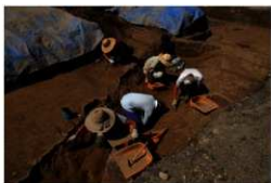
発掘現場の様子（樋の上遺跡：三ヶ尻）

平成23年度の各種開発等に伴う届出等の件数は、文化財保護法第93条に基づく発掘の届出が165件、照会文書が127件の計292件でした。前年度比約10%の増加となり、昨年度に続き、過去最高の件数となりました。これらの届出・照会文書に対する試掘調査実施件数は33件であり、措置としては、本発掘調査4件、工事立会148件、慎重工事140件でした。なお、埋蔵文化財包蔵地の窓口照会件数は473件でした。今後とも、届出・照会文書の提出をはじめ、埋蔵文化財の保護にご協力をお願いいたします。