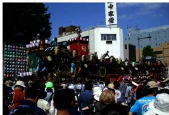
「熊谷八坂神社祭礼行事」（熊谷うちわ祭）巡行祭

熊谷市教育委員会は、「熊谷八坂神社祭礼行事」（熊谷うちわ祭）を平成24年3月30日付けで、熊谷市指定無形民俗文化財に指定しました。「熊谷八坂神社祭礼行事（うちわ祭）」は、7月20～22日の3日間において実施されており、毎年多くの観客者を集めています。祭礼行事の起源は、文禄年間に愛宕神社に合祀された八坂神社での例祭であります。現在においても、江戸中期から開始された祇園柱の設置を伴う祭礼行事、江戸中期から開始された神輿渡御を中心とした祭礼行事、明治後期から開始された山車・屋台の巡行行事、これら原型が残されていることが、昨年実施した調査により明らかとなり、文化財指定に至りました。