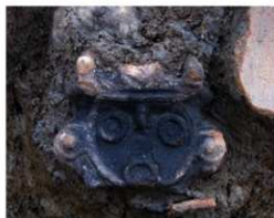
ミミズク土偶が出土した様子

1月～3月末まで行った上之地区の発掘調査では、縄文時代後期(約3300年前)と古墳時代の初めころ(約1700年前)の遺跡を確認しました。縄文時代は竪穴建物跡3軒などが見つかり、谷状の窪地からは多量の縄文土器や、剣形石製品、石器などが出土しています。また、土偶も多く出土しており、良好な資料を有する遺跡として注目されます。古墳時代は前方後方形周溝墓と呼ばれる、お墓が見つかりました。市内では初の事例で、県内でも数例しかありません。お墓の規模は、横幅が