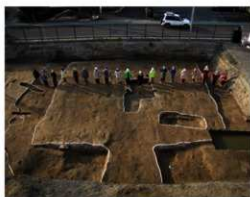
前方後方形周溝墓(人間の位置は1m間隔)

18.8m、縦幅が14.8mでした。遺物も祭祀に関係する土器や木製品が出土し、資料的価値の高い成果をあげることができました。今後、整理調査を進めて江南文化財センターなどで公開展示を実施したいと考えています。