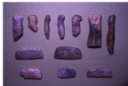
石製模造品（人形・馬形・横櫛形）