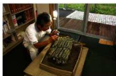
埋蔵銭クリーニング作業風景

埋蔵銭は発掘現場から土の付いた状態で取り上げましたが、時間の経過とともに乾燥が進み、土台のひび割れや古銭の崩落等が生じてきました。そこで平成21年度に土台の固定、クリーニング（埋め土や容器の痕跡と思われる植物片の除去）、現状の図面作成作業を実施しました。また崩壊してしまった場合、出土状態を復元できるように3D計測も行いました。3Dデータときれいになった埋蔵銭の写真をホームページ「熊谷市の文化財」に掲載いたしましたので、どうぞご覧ください！