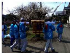
地区内を巡回する「お獅子様」

平成22年3月13日(土)、市内小江川の高根神社および小江川地区内にて市指定無形民俗文化財の小江川獅子祭りが開催されました。この祭りは、高根神社の春祭りとして行われるもので、上尾市の八枝神社から借り受けた「お獅子様」を担いで、高根神社から地区内を巡り、春の到来を告げる風物詩となっています。戦後の時期から長い間中断していましたが、平成になると復活の機運が高まり、今日では多くの地元住民が参加する重要な伝統行事として盛り上がりを見せています。