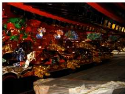
修理が終了した本殿軒下の彫刻と彩色

本保存修理工事は、平成22年度に全てが終了し、平成23年6月に一般公開される予定となっています。