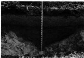
Gトレンチ大溝 (西壁)

範囲内の調査が一段落した後、時期を平行して行われている第5次調査地でみつかった集落内の大溝の延長部確認のため、A～Jのトレンチを入れた。その結果、A・G・H・Jトレンチで大溝を確認でき、南西から北に膨れて、南東、そして東、と蛇行しつつ流れていくことがわかった。大溝からは飛鳥・奈良時代の土器がみつかった。