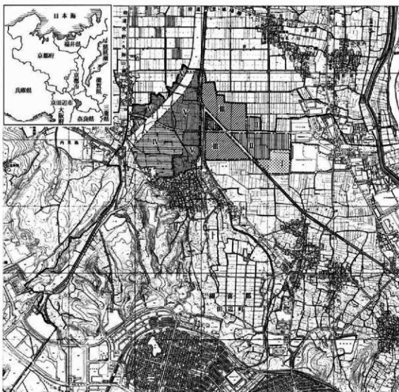
調査地位置図 (S = 1 : 20,000)

なお、土地所有者の方々をはじめ、関係者の方々、寒中強風のなか作業に従事された皆さん、その他多くの方々の協力によって今回の調査が行われたことをここに記して感謝の気持ちとしたい。