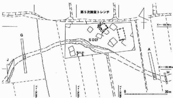
第5次調査地周辺トレンチ配置図 (アルファベットが教委調査トレンチ)

灰色系の粘土や暗い青灰色系の粘性細砂層がみられる。中世から近世の遺物がわずかにみつかると。但し、一部の灰色系の粘土層では直径0.1m程度の不定形の穴が密にあり、灰色の砂が入っている地点がある。洪水等で流された水田跡とも考えられる。