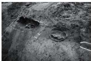
4 北辺断面（北西から）