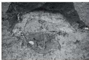
2 西辺柱穴断面（西から）