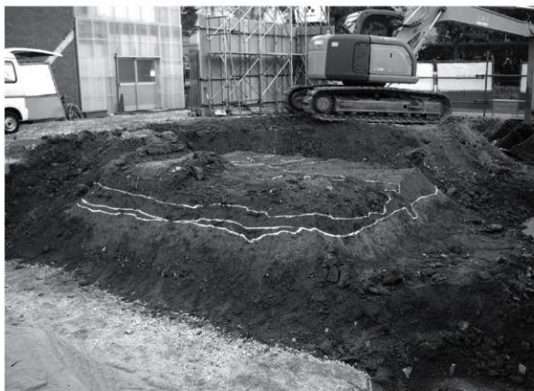
1 調査区全景（北西から）