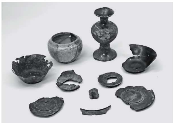
1 寄付受納品1 (集合写真)