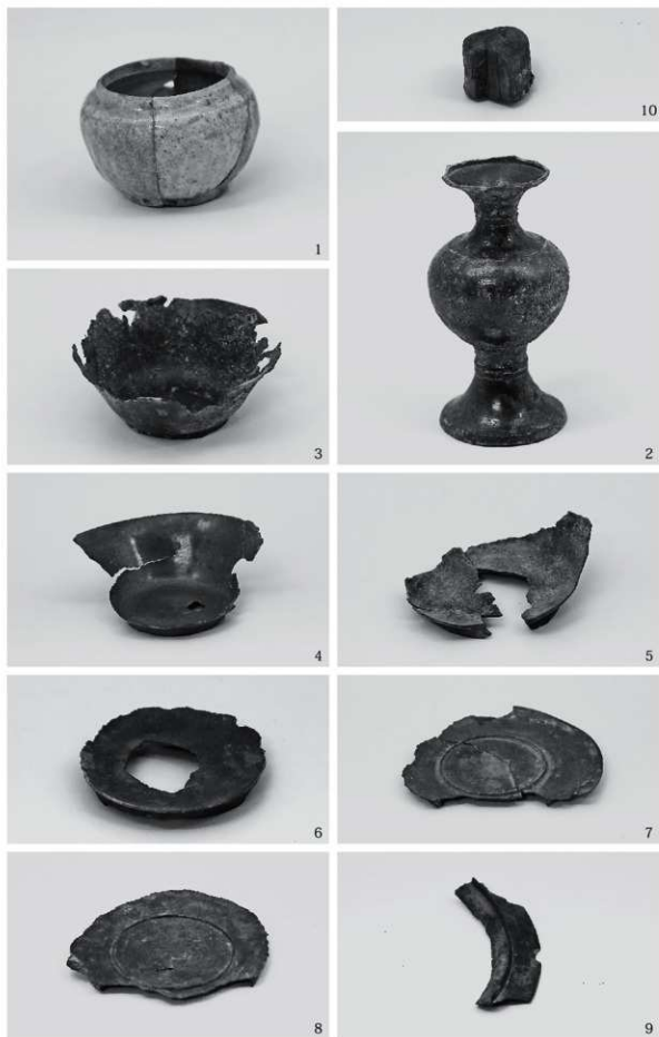
1 寄付受納品1 (1~10)