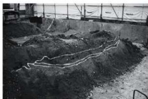
3 北辺断面（北東から）