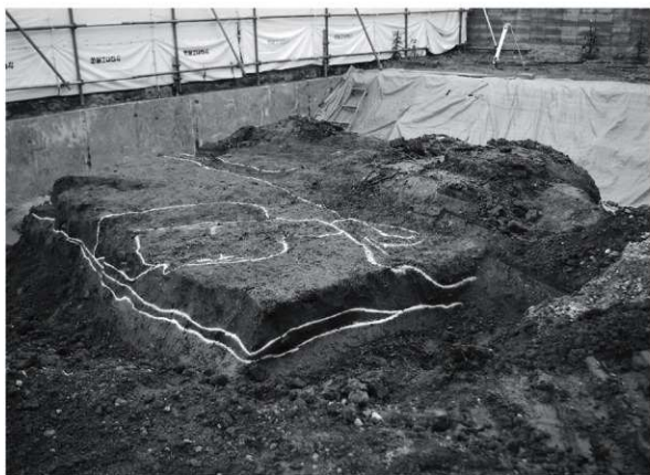
2 調査区全景（南東から）