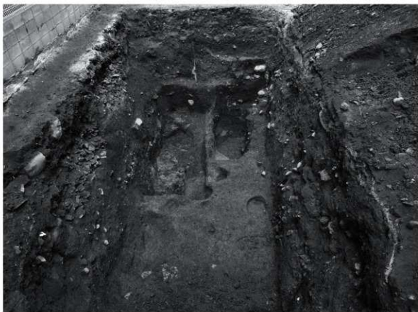
3 第3面全景 (西から)