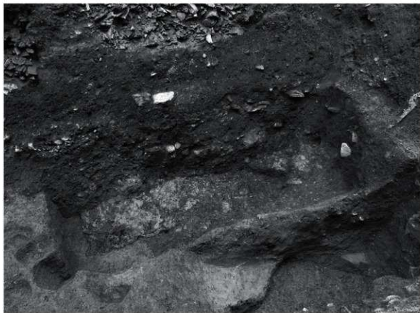
10 SK55 炭 検出状況(南西から)