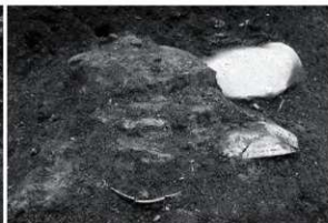
20 SX 7 近接 (南西から)