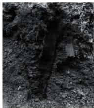
14 SK55 炭化材近接(東から)