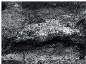
12 SK55 炭化材検出状況(南東から)