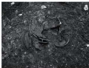
21 SP9 検出状況 (南西から)