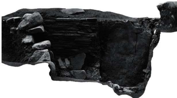
24 SK1 オルソー画像