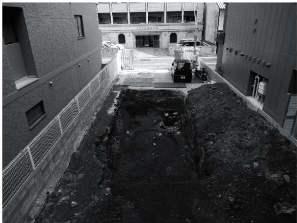
1 第1面全景 (西から)