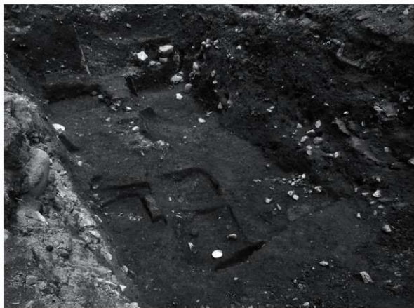
15 第4期の遺構 検出状況(北西から)