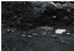
19 SX 7 検出状況 (南から)