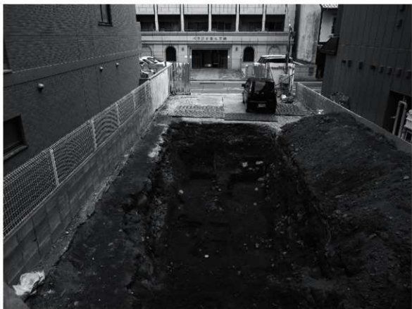
2 第2面全景 (西から)