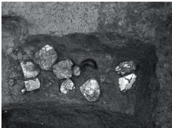
6 SX51 (北から)