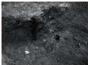
13 SK55 床面断割り(東から)