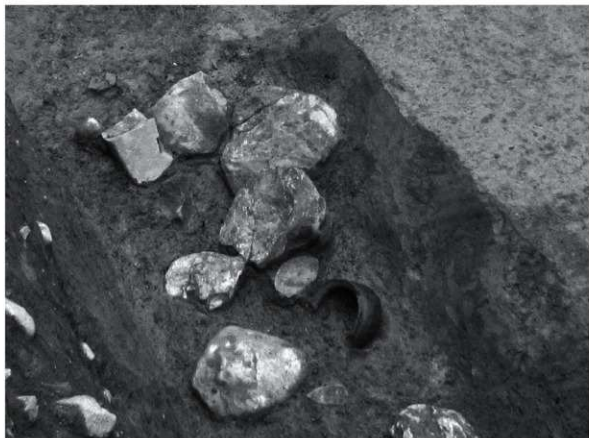
7 SX51 (南西から)