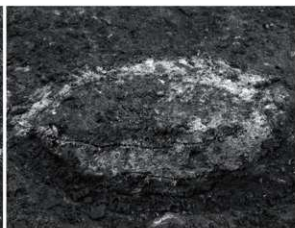
22 SP16 断面 (東から)