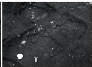
17 SK27 (南西から)