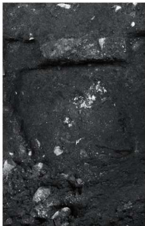
16 SK28 (南西から)