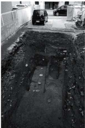
4 第4面全景 (西から)