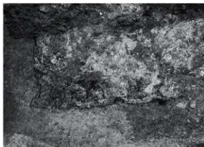
11 SK55 炭部分近接(南から)