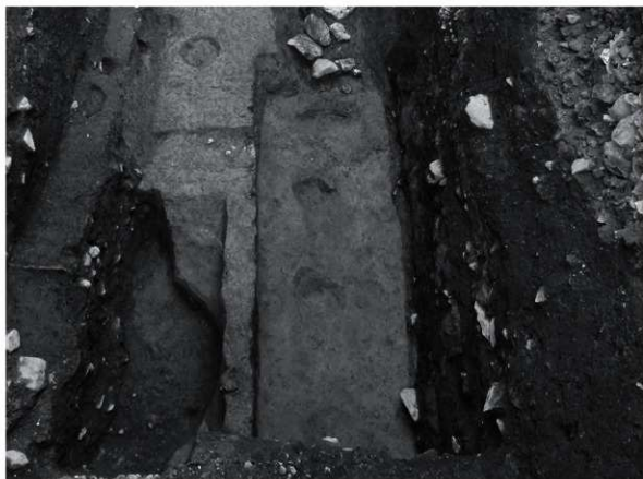
9 SK55 完掘状況 (東から)