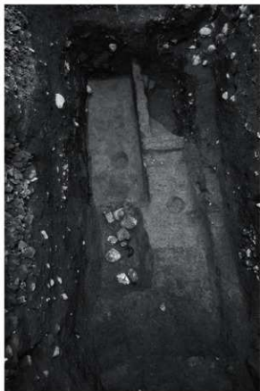
5 第5面全景 (西から)