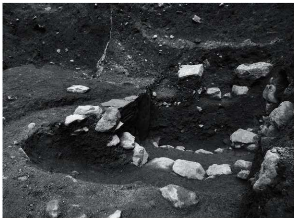
23 SK1 検出状況 (西から)