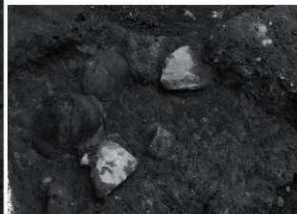
18 SK18 (南東から)