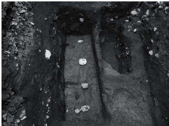
8 SK55 床面 (西から)