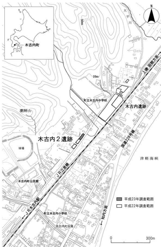
図 I-1 遺跡の位置と周辺の地形