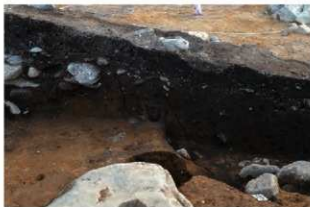
SR121 検出状況(ベルト内)(北東から)