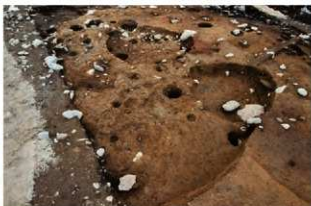
S14012・4013・4016 完掘状況(東から)