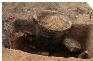
S165 埋設土器土層(北から)