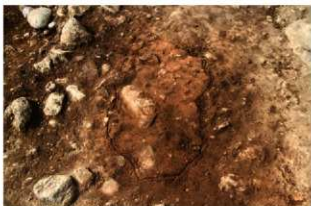
S11063 炉2検出状況(南から)