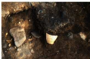
S11125 小型土器出土状況(北から)