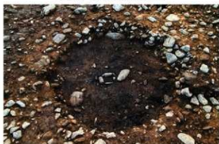
S13014 炉・炭化材検出状況(東から)