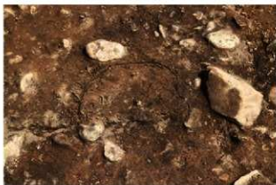
S11065 炉1検出状況(西から)