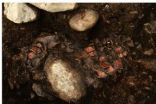
S11097 土器出土状況(南から)