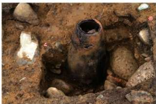
SR4004 土器埋設状況(西から)