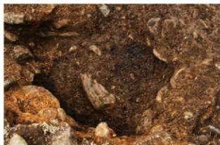
S15034 Pit7柱痕検出状況(東から)