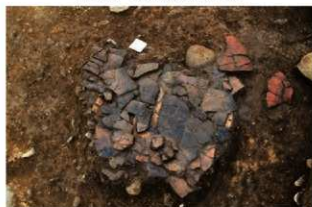
S14010 土器(2-図67-2)出土状況(西から)