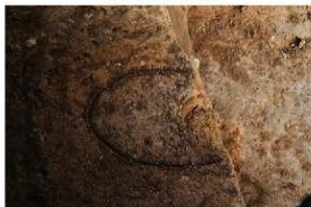
SR88 掘方検出状況(西から)