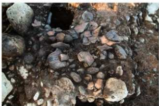
S11078 検出及び遺物出土状況(西から)