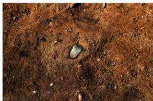
SI1070 石製垂飾(2-図148-4)出土状況(南から)