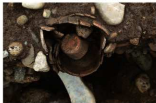
SR10001 土器内部検出土状況(南西から)