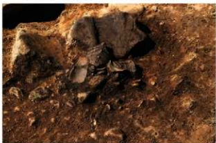
S11079 床面遺物(2-図45-1)出土状況(東から)