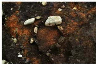
SN5010 検出状況(南西から)