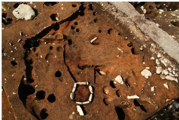
S1109 床面検出状況(南から)