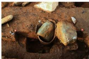
SR30 土器内部礫出土状況(南から)