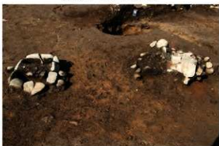
SN4026(左) 検出状況(南東から)