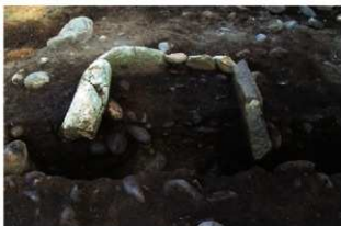
S15016(新) 炉土層A-A' (北から)