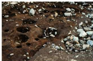
S14047 完掘状況(北西から)