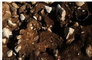
SN70 礎抜き取り痕(西から)