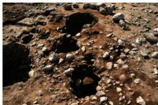
SB10003-SP10153(上)・10160(下) 完掘状況(東から)