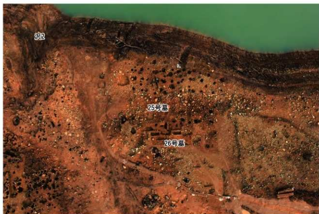
遺跡北東部の段丘斜面