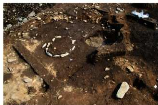
S14020 検出状況(北西から)