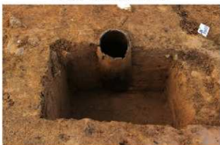
SR4053 土器埋設状況(南東から)