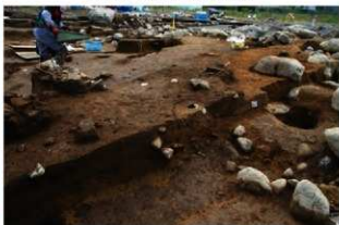
SR89 検出状況(13ベルト内)(北西から)