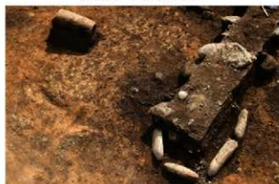
S14013 石棒(2-図151-4)出土状況(北西から)