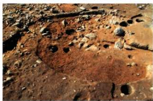
S15017・5049 完掘状況(北東から)