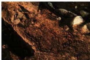
SN1022 検出状況(南西から)