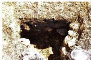
S15043 Pit4土層 (西から)