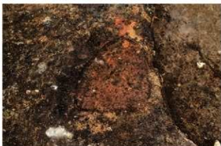
S13 炉検出状況(東から)