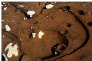
S14017 完掘状況(南西から)