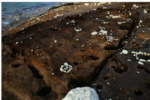
S1404 遺物出土状況(西から)