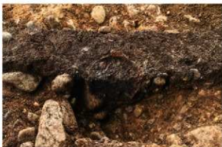
S13010 土器埋設炉土層(西から)