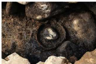
SR5001 検出状況(南東から)