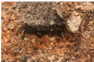
S15048 Pit5 土層(南西から)