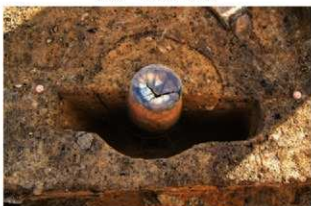
SR26 土器埋設状況(南から)