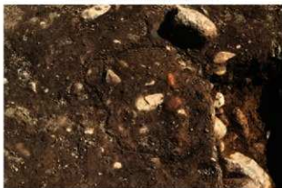
SI1064 炉検出状況(北から)