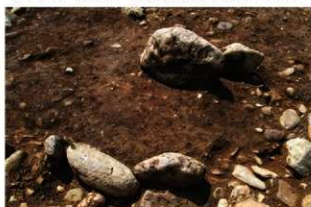
S110018 炉火床面検出状況(北東から)