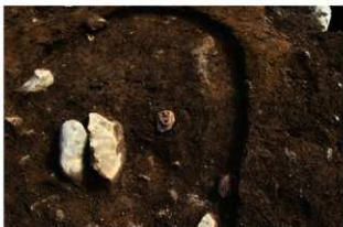
S14013 Pit11脇床面土偶(2-図143-1)出土状況(北から)