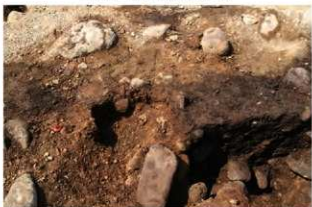
SR109 掘方完掘状況(南から)