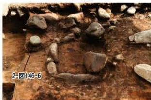
S163 円盤状石製品出土状況(北から)