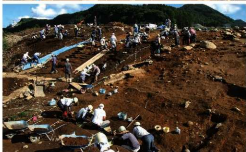
斜面部 (捨て場)調査状況