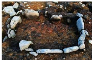
S15072 炉完掘状況(北西から)