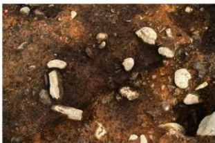
S11094 炉検出状況(西から)