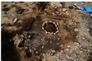
S14020 炉検出状況(南から)