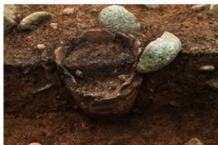
SR1016 土器埋設状況(北から)