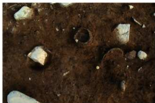
SR54(左)・55(中)・56(右) 検出状況(北から)