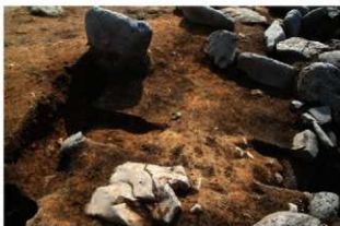
SN123 硬化面検出状況(北東から)