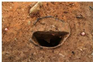
SR101 土器内土層(北から)