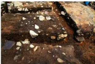
S15011・Ⅲ(廃棄層)1 土層B-B'(西から)