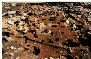
S15047 完掘状況 (南西から)