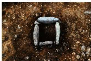
S11201 炉検出状況(南東から)