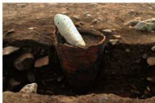
SR1014 土器埋設状況(東から)