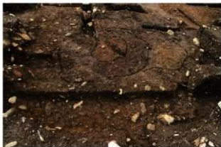
S11082 炉検出状況(南から)