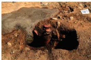
SR5 土器埋設状況(西から)