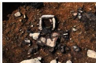
S11201 遺物出土状況(南東から)