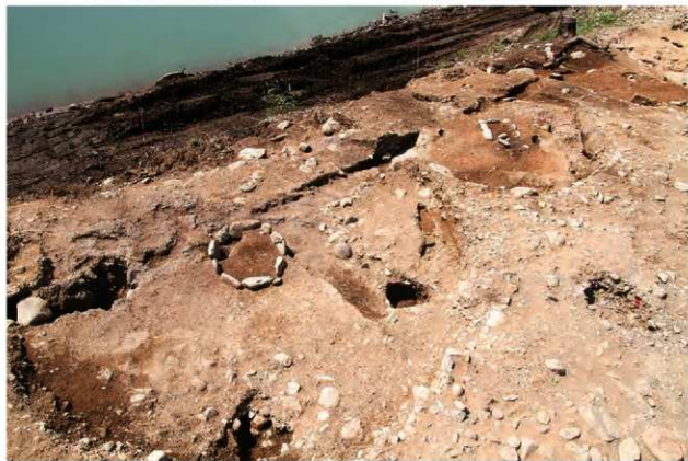
SI10017・10009・10010 完掘状況(北から)