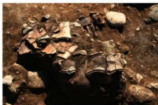
S11063 土器(2-図34-5)出土状況(東から)