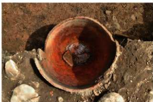
SR1014 土器内完掘状況(西から)