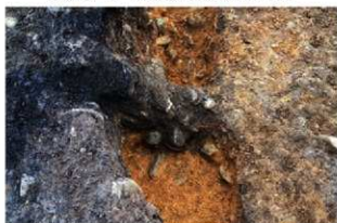
S15038 壁周溝土層C-C'(北から)