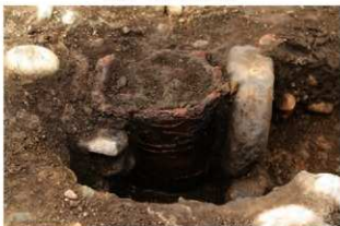
SR93 土器埋設状況(南東から)