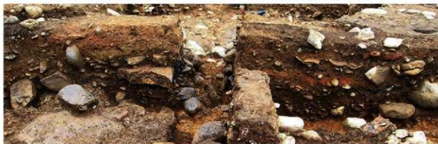
SI5019 土層A-A' (南東から)