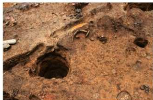
S14049 完掘状況(南西から)