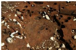
S1115 床面検出状況(西から)