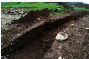
基本層序図⑤b (ⅨE-61ヶ'リット' 付近・北西から)