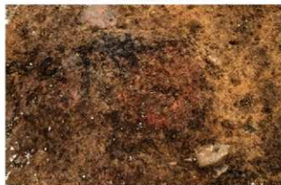
S14055 炉検出状況(西から)