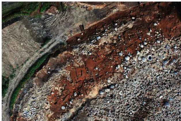
遺跡北西部の段丘斜面