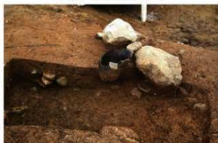
SR4009 土器埋設状況(北東から)