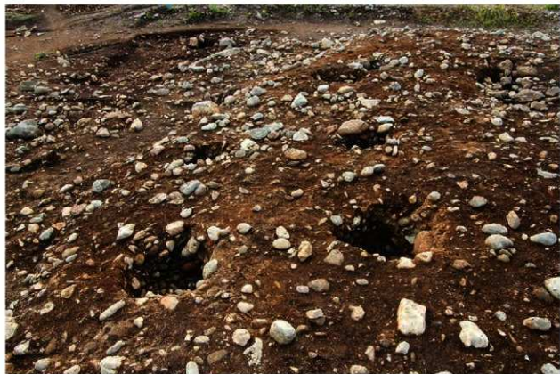
SB1001 完掘状況(北東から)