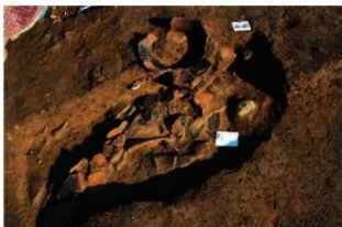
SR19と捨て場堆積層出土の個体土器(西から)