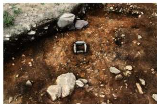
S11201 完掘状況(南東から)