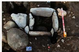
SN68 内部完掘状況(南から)