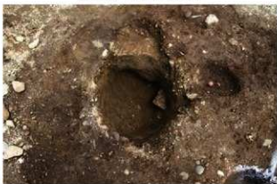
SN5502 掘方完掘状況(南西から)