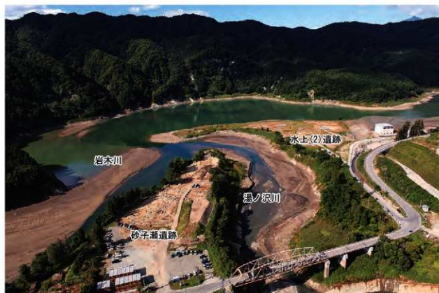
水上(2)遺跡と周辺環境(南から)