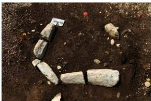
SI10013 石囲炉検出状況(北から)