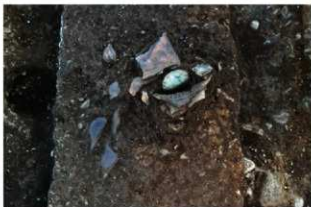
S11096 遺物出土状況(北から)