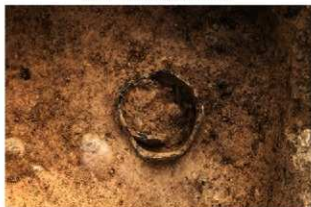
SR78 検出状況(北東から)