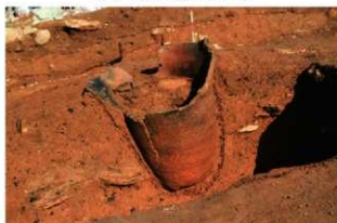
SR19 土器埋設状況(西から)