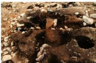
SI1109 炉掘方完掘状況(西から)