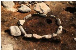
S140 炉検出状況(北から)