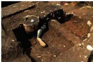
SR4024 土器埋設状況(南東から)