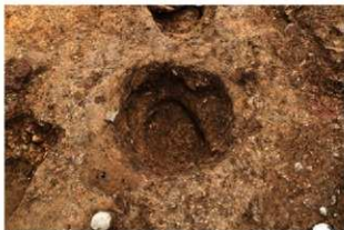
SI110 Pit1-特殊施設完掘状況(北から)