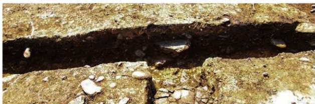
S15011・Ⅲ(廃棄層)1 土層A-A'(北から)