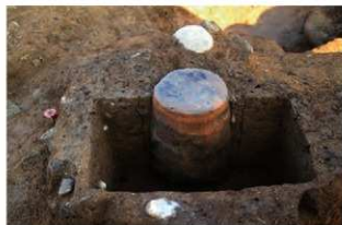
SR24 土器埋設状況(西から)