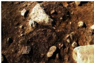
S11087 炉1・2検出状況(南から)