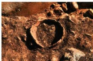
S13002 土器埋設炉確認状況(北から)