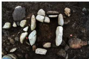
S15039 炉完掘状況(南東から)