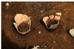
SR4006(右)・4007(左) 検出状況(南から)