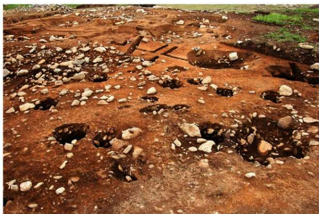
SB1002 完掘状況(北東から)