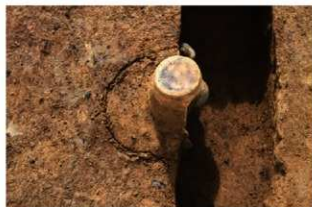
SR90 検出状況(北西から)