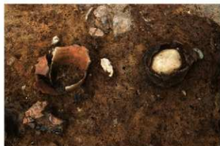
SR4039(右)・4040(左) 検出状況(南から)