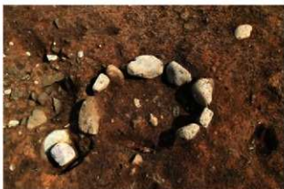
S13001 炉完掘状況(西から)