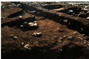
S11063 土層B-B' (南東から)