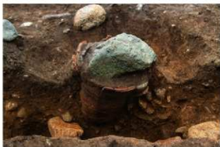
SR1011 土器埋設状況(北西から)