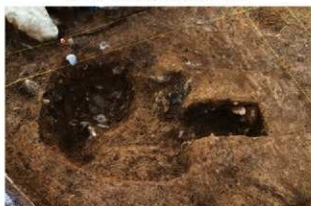
S1115 特殊施設周堤部土層(北から)