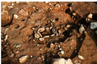
S152 炉完掘状況(西から)