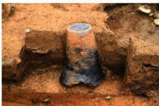
SR22 土器埋設状況(南から)