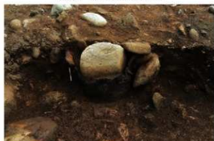
SR5008 土器埋設状況(西から)