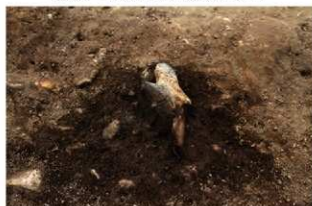
S15502 土偶(2-図145-1)出土状況(東から)