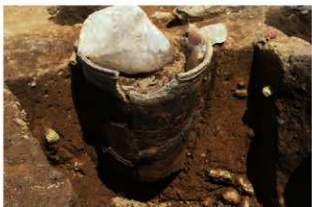
SR117 土器埋設状況(南から)