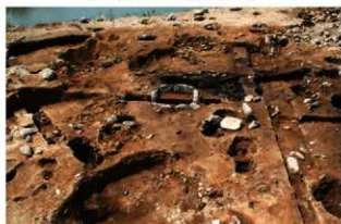
S110007 完掘状況(北東から)