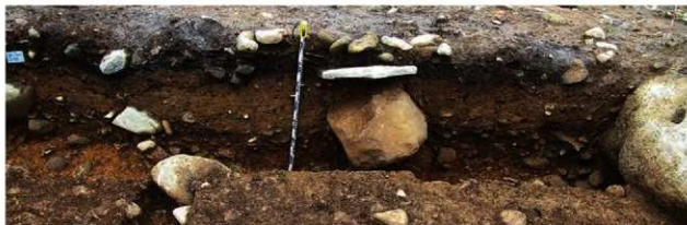
S15028 土層B-B' (南東から)