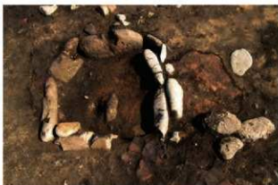
S11071 炉検出状況(南西から)