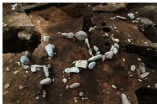
SN121 硬化面検出状況(東から)