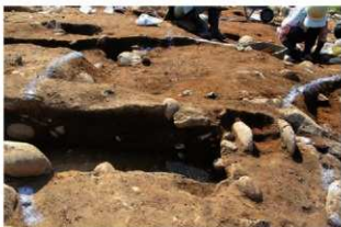
S169 検出及び土層(東から)