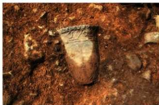
S15006 第2号埋設土器検出状況(南東から)