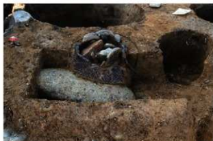
SR4045 土器埋設状況(東から)