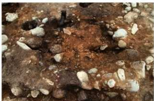
SI1111 炉掘方完掘状況(西から)