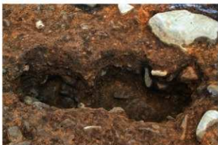
S15073a・b Pit1柱痕完掘状況(南西から)