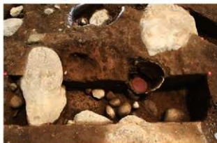
SR1022 土器内完掘状況(北西から)