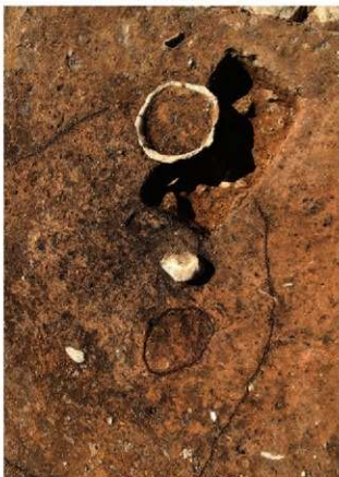
S165 炉・埋設土器検出状況(北から)