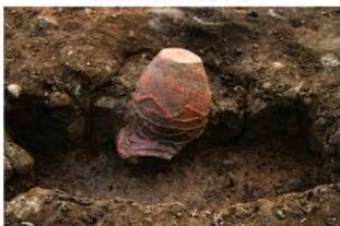
S11085 埋設土器土層(北から)