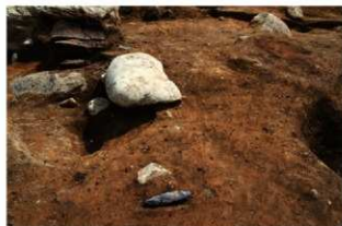
S177 剥片石器(2-図103-8)遺物出土状況(西から)