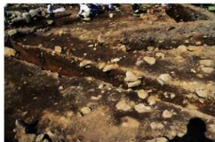
S15017・5018・5049 土層(南西から)