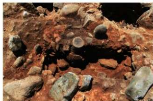
SR5006 土器埋設状況(北東から)