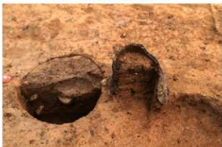
S171 出土土器土層(北から)