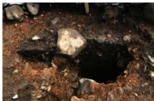
SK5025(右)・SP5066(左) 土層(西から)