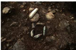
SI1110 炉検出状況(南東から)