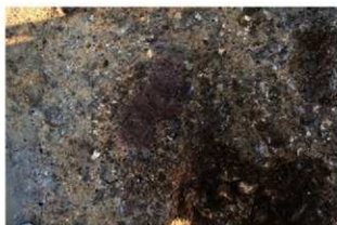
S1110 炉1検出状況(北から)