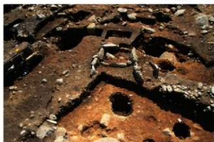
S15046 完掘状況 (北西から)