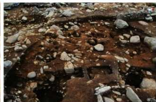
S15045 完掘状況 (北西から)