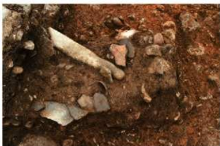
S11088 遺物出土状況(南東から)