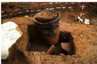
SR21 土器埋設状況(南から)