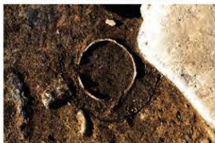
SR32 検出状況(南東から)