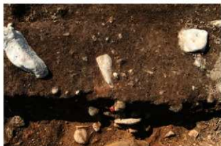
S15502 炉2検出状況(北から)