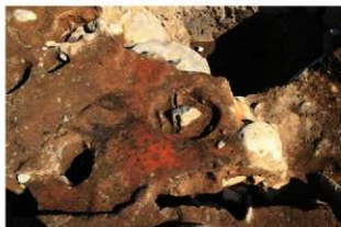
⑥S18 炉1・2検出状況(西から)