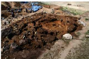
S173 完掘と周辺状況(南東から)