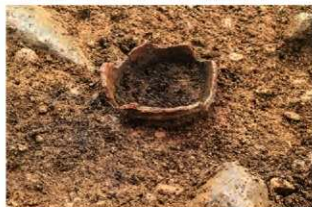
S14006 炉検出状況(北から)