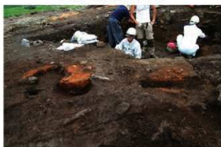
SN103(右)・104(左) 土層(南から)