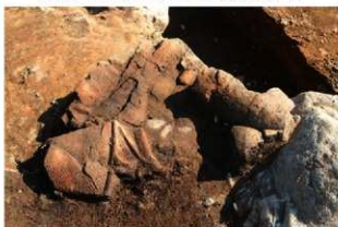
SI110 土器(2-図31-1)出土状況(北から)