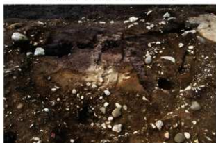
S110017 炉掘方・住居掘方完掘状況(北西から)