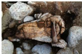
S15002 第1号埋設土器内部土層除去状況