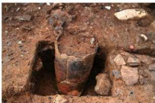
SR28 土器埋設状況(南から)