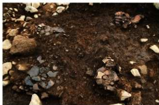
S11095 2層遺物出土状況(北から)