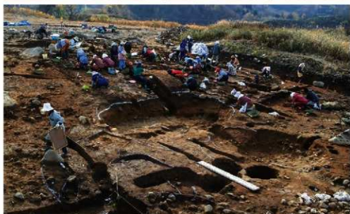
斜面部 (捨て場)調査状況 (S1102付近)