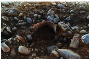
S13003 土器埋設炉土層(北から)