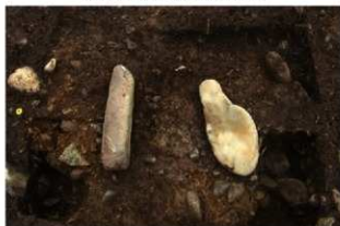
SN5501 検出状況(南西から)