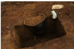
SR4052 土器埋設状況(南西から)