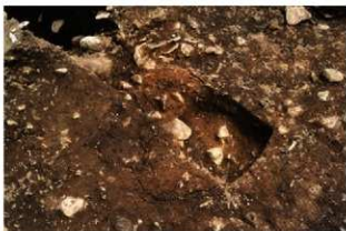
S11065 炉2検出状況(西から)