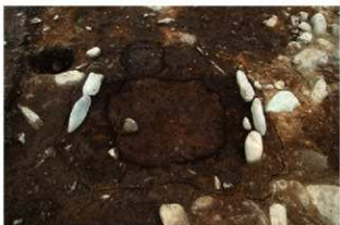
SI1111 炉検出状況(西から)