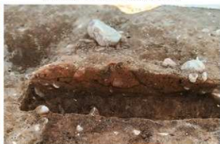
S166 炉南北土層(東から)