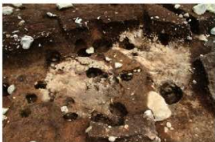
S11120 掘方完掘状況(西から)