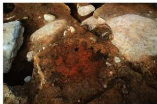
⑥S15 炉3検出状況(南東から)