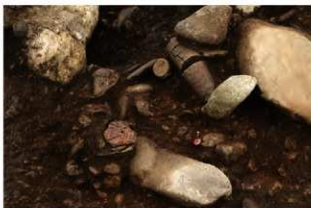
S11081 2層石棒(2-図149-1)出土状況(西から)