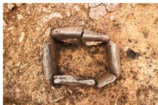
S14002 炉完掘状況(東から)