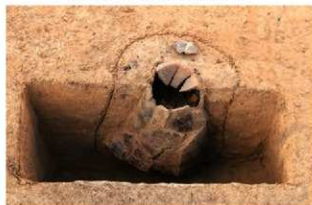
SR4057 土器埋設状況(北東から)