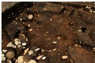
SI1105 完掘状況(南東から)