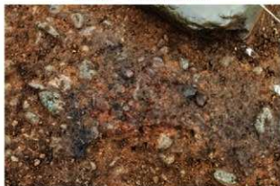
SN1026 検出状況(北西から)