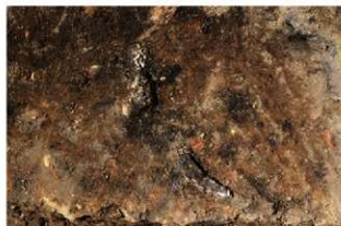
S15034 2層骨片出土状況(東から)