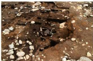
SI138(新) 完掘状況(西から)