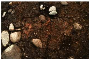
S11091 炉検出状況(北から)