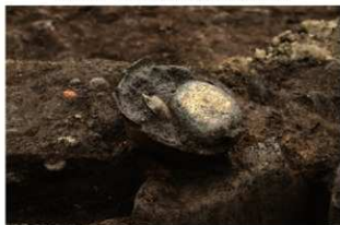
SR1023 検出状況(北西から)