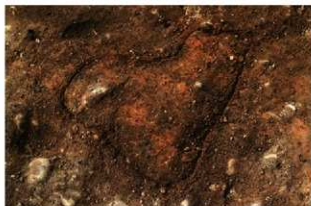
S11063 炉1検出状況(南から)