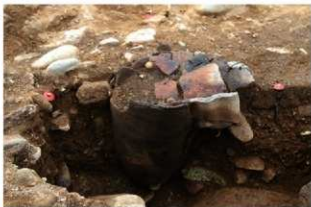
SR53 土器埋設状況(南東から)