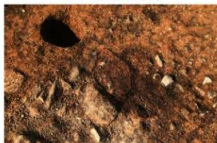
S16 炉6検出状況(南から)