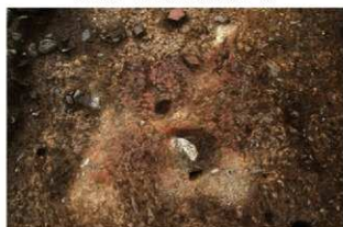
S110002 炉2検出状況(西から)