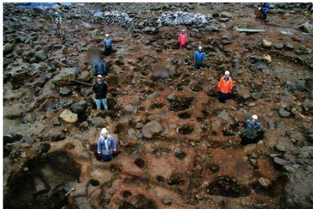
S15047 完掘状況(南西から)