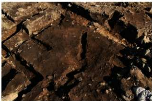
S11082 完掘状況(北西から)