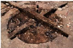
S11065 土器出土状況(南西から)