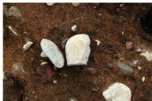
SR15・17 検出状況(東から)