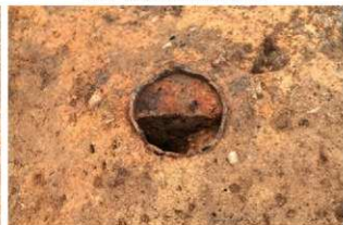
SN73 土器内土層(南から)