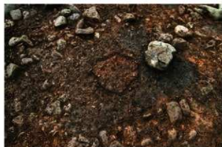
SN1027 検出状況(北西から)