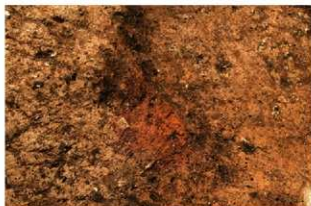
S171 炉1検出状況(東から)