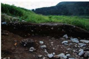
基本層序図⑤a (ⅧW-64ヶ'リット' 付近・東から)