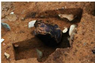
SR4050 土器埋設状況(南から)