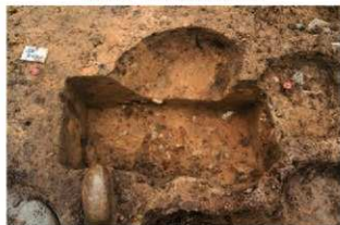
SR4043 掘方完掘状況(南から)