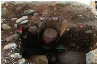
SR53の内部で確認した土器(P-2(3-図137-6))(南東から)