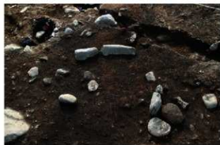
SN5011 検出状況(北東から)