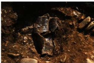
S11086 土器(2-図49-1)出土状況(南から)