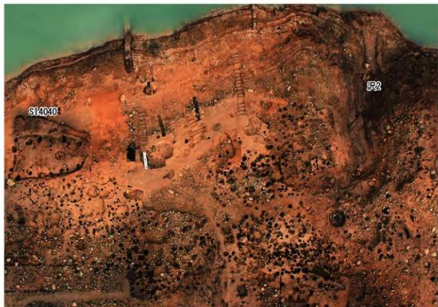
遺跡北側の段丘斜面