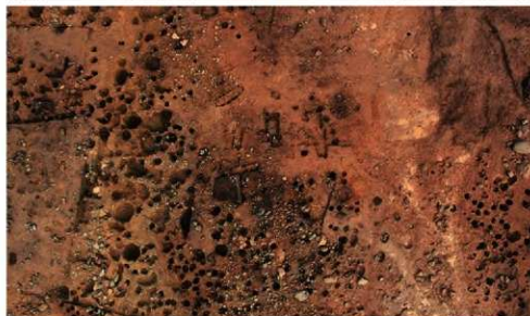
遺跡中央部 (石棺墓B群)