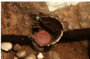
SR1022 土器内完掘状況(北西から)