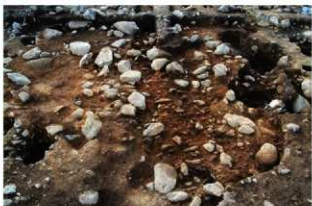
S15053 完掘状況 (東から)