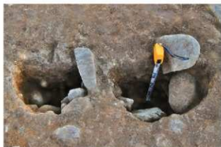
S15073a・b Pit1柱痕土層(南西から)