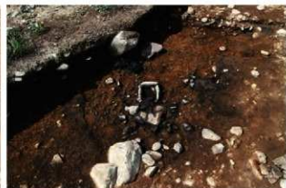
S11201 遺物出土状況(南東から)