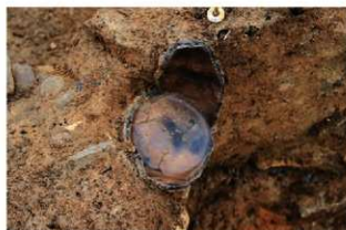
SR10 土器内完掘状況(北から)