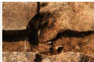
SI1118 埋設土器掘方完掘状況(南から)