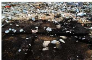
S15016 土層A-A' (南から)