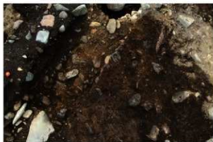
S15502 炉4検出状況(北東から)