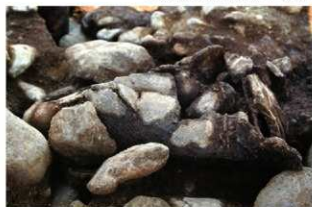
S15002 第1号埋設土器検出状況(北西から)