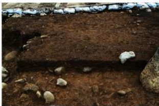
S15058 土層C-C' (西から)