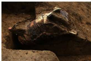
SR1021 土器埋設状況(北から)