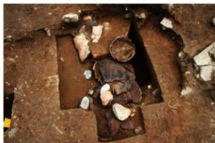
SR65と捨て場堆積層出土の個体土器429(奥)・430(手前)(北から)