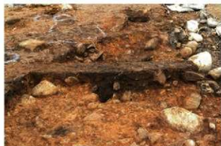
S15071 土層A-A' (西から)