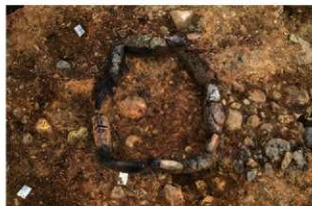
S14018 炉火床面検出状況(南から)