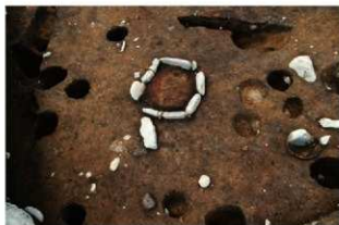
S1103 炉検出状況(南から)