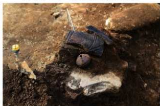
S14010 土製品(2-図142-19)出土状況(南から)