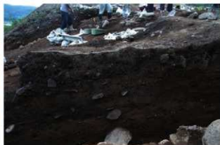
捨て場13ベルト中のS166(西から)