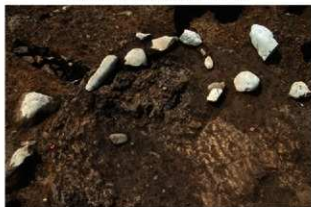
S11120 炉(旧段階)掘方完掘状況(東から)