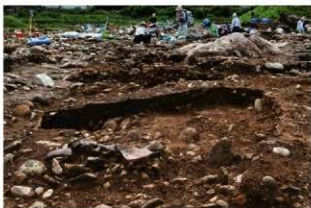
SI10011 土層・遺物出土状況(西から)