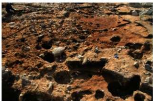
S15054・S15055・S15062・S15067 完掘状況 (東から)