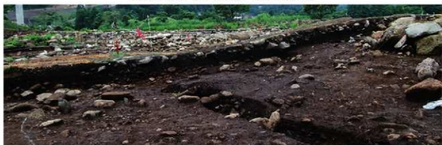
基本層序図② (VIII-O-86'リット'付近・北東から)