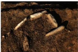
S14049 炉検出状況(南から)