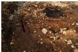
S13006・3008 完掘状況(南から)