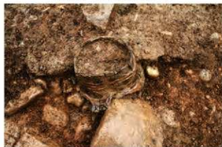
SR1020 検出状況(北西から)