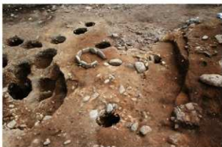
S110001 完掘状況(北西から)