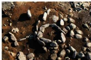
SN123・124 検出状況(北から)