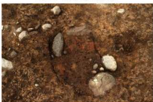
SI1124 炉検出状況(南から)