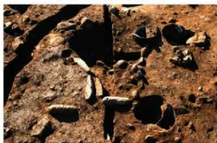
S157 炉検出状況(北から)