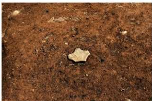
S177 岩偶(2-図146-7)出土状況(西から)