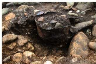
SR4502 土器埋設状況(東から)