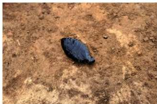
S14016 石匙(2-図118-5)出土状況(北から)