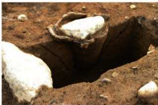
SR4022 土器埋設状況(西から)