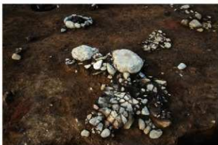
S14040 土器(2-図70-2)出土状況(西から)