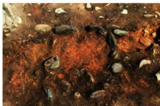
SN5009 検出状況(北西から)