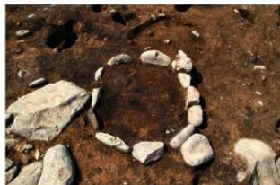
S140 炉検出状況(東から)