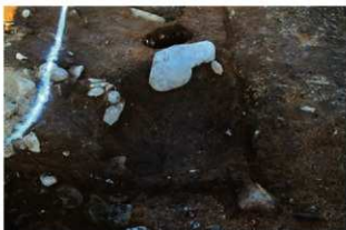
SI102 炉完掘状況(西から)