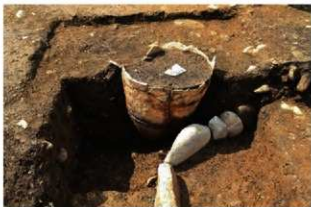
SR4024 土器埋設状況(東から)