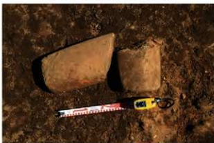
S15014 石棒(2-図152-4)出土状況(南から)