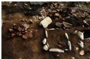
S11125 炉1確認状況(北から)