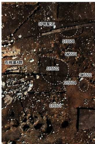
石棺墓A群東側の隣接遺構(写真上が北)