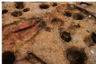
S14057・4058 完掘状況(南から)