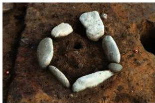
S14040 炉12検出状況(南から)