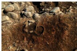
S110002 炉1検出状況(南から)