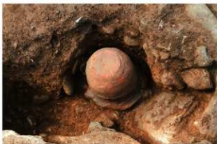
SR1015 土器埋設状況(南から)