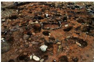
S15056・5072 完掘状況(北西から)