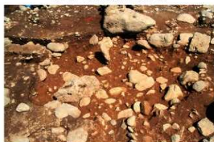
S15028 完掘状況(南西から)