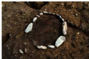
SI1112 炉検出状況(北から)