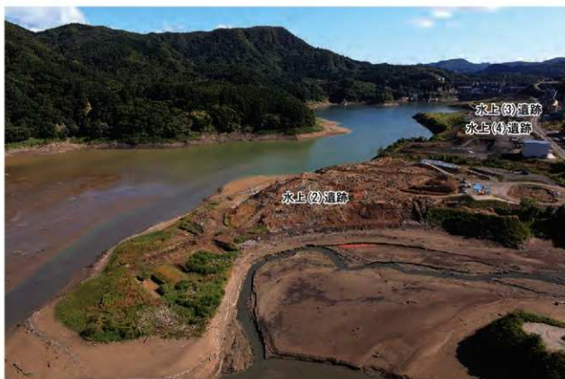
水上(2)遺跡と周辺環境(写真奥が岩木川下流)