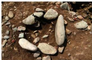
S15501 炉完掘状況(北から)