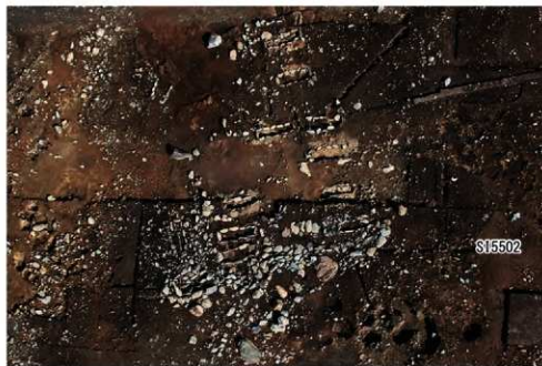
遺跡中央部 (石棺墓A群)