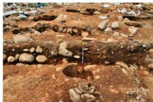
S15053 土層 (南から)