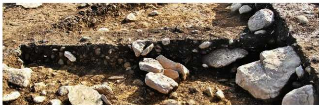
S15008 土層南側(北東から)