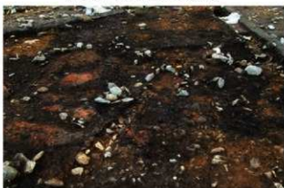
SN5009(中央) 検出状況(北から)