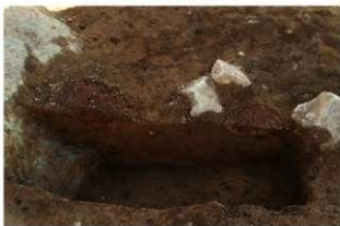
SN65(右)・66(左) 土層(北から)