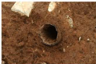
SR57 検出状況(南西から)