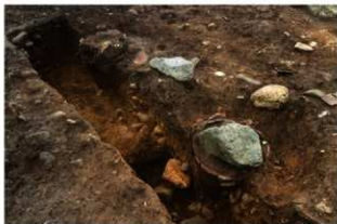
SR1010(左)・1011(右) 土器埋設状況(西から)