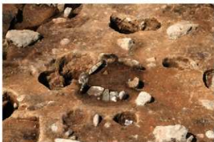
SN125 検出状況(南東から)