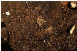
SI1105 炉検出状況(南から)