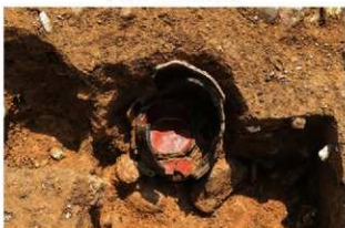
SR106の内部で確認したP-1(3-図146-4)の底部(北から)