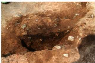
S110003 特殊施設土層(南から)