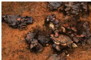
SI102 第5層遺物出土状況