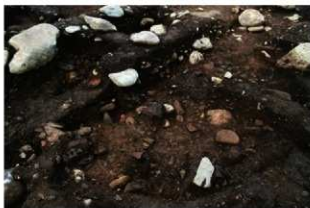
S11086 遺物出土状況(南西から)