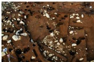
S1115・120 完掘状況(西から)