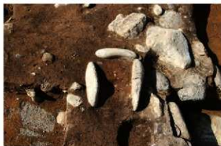
S169 炉完掘状況(東から)