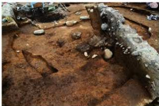
SI110 床面出土遺物出土状況(南から)