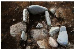
S1111 炉完掘状況(北から)