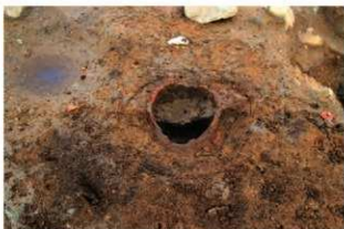
SI18 土器埋設炉土層(西から)