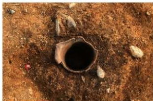
S174 埋設土器内部土層除去状態(北から)