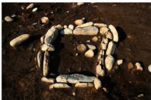
S11066 炉検出状況(南西から)