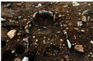
SN10006 検出状況(北東から)