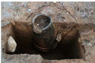
SR4060 土器埋設状況(西から)