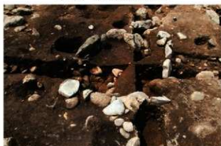
SI1109 炉南北土層(東から)