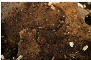
S14015 炉検出状況(南から)