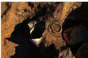
SR16 検出状況(南西から)