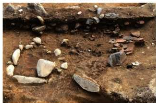
S163 遺物出土状況(北から)