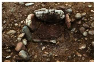
SN10006 検出状況(北東から)