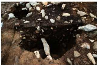
SR10001, SK10028 土層(南西から)