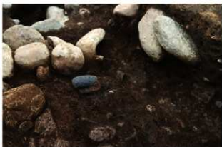
S11084 2層石冠(2-図149-5)出土状況(西から)