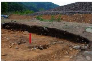
基本層序図③ (VIII-P-110'リット'付近・西から)