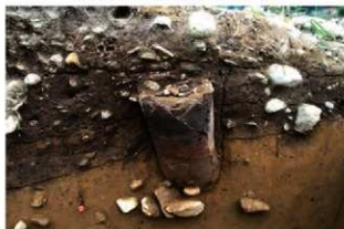
SR4036 土器埋設状況(西から)