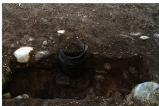
SR4003 土器埋設状況(北西から)