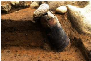
SR68 土器埋設状況(北から)