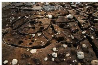
S157(左)・59(右) 完掘状況(北から)