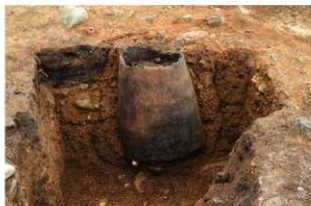
SR3 土器埋設状況(西から)