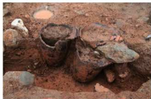
SR15・17 土器埋設状況(東から)