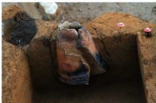
SR4049 土器埋設状況(北から)