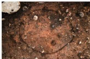
SI1068 炉検出状況(南東から)