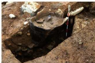
SR4010 土器埋設状況(北西から)