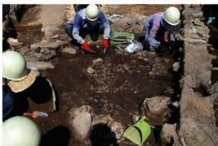
SI110 石冠(2-図147-6)出土状況(南から)