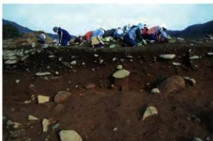
基本層序図④ (ⅧX-69ヶ'リット' 付近・西から)