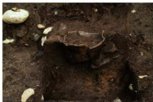
SR4 土器埋設状況(西から)