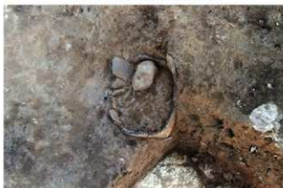
SR70 検出状況(南西から)