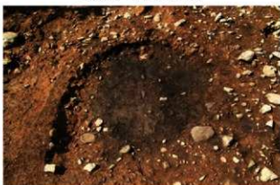
S13005 床面検出状況(東から)