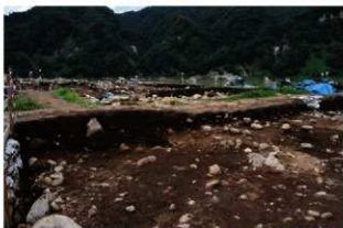
基本層序図① (VIII-91'リット'付近・東から)