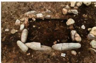
SN5008 検出状況(南東から)