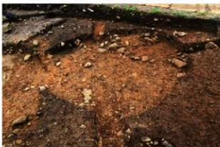
S15015 完掘状況(南西から)