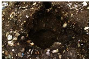
S15502 炉5掘方完掘状況(南西から)