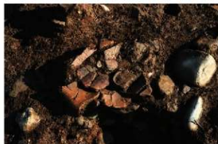
S11106付近 遺物出土状況(西から)