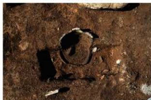
SR120 検出状況(北東から)