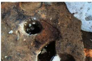
⑥S17+S18 炉3検出状況(南から)