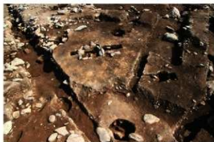
S11071 完掘状況(南西から)