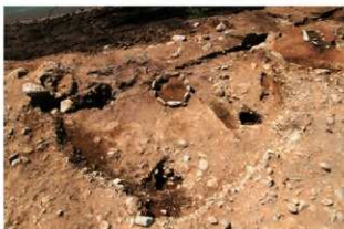
S110017 完掘状況(北西から)