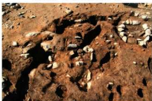
SI138(旧) 完掘状況(東から)