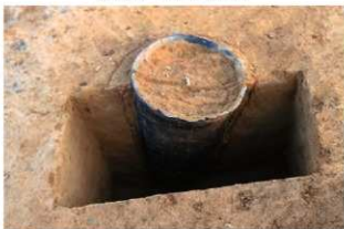
SR4044 土器埋設状況(西から)