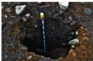
S15073a壁柱(SP9042) 土層(南東から)