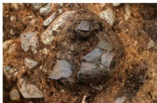
S14002 遺物出土状況(西から)