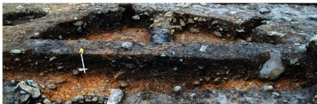
S15004 土層A-A' (西から)