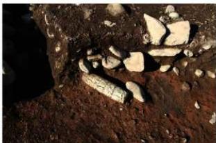
SI1114 石棒(2-図150-3)出土状況(南から)