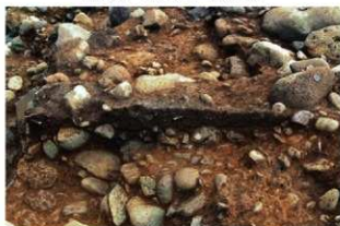
S15064 土層B-B' (西から)