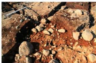
S15006 完掘状況(南西から)