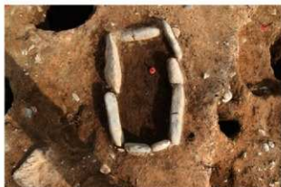
SI10008 炉検出状況(西から)