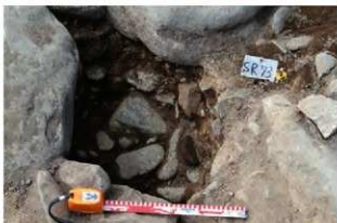
SR73 掘方完掘状況(東から)