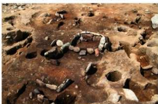
SN122 検出状況(南東から)