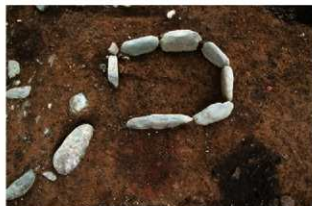
S110001 炉1・炉2検出状況(南から)