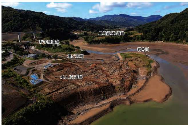
水上(2)遺跡と周辺環境(写真奥が岩木川上流)