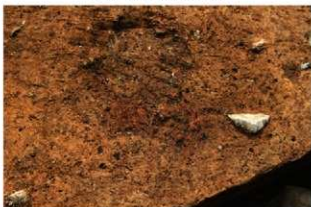
S171 炉3検出状況(東から)