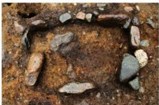
S14047 炉検出状況(西から)