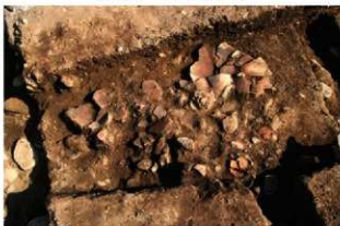
SI1064 遺物出土状況(北半)(北から)