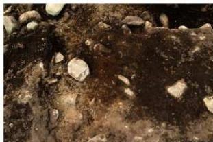
S15502 炉1検出状況(北から)