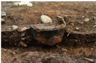
SR1013 土器埋設状況(南から)