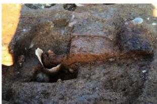
⑥S15 炉I(土器埋設炉)土層(東から)