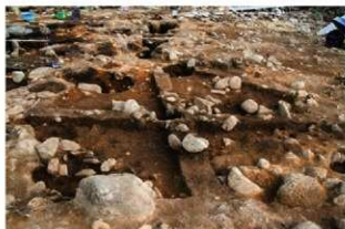
S15059 土層B-B' (北西から)