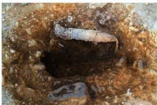
S15006 第2号埋設土器土層(南西から)