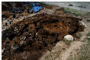
S162・63・73 重複状況(南東から)