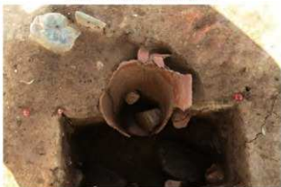
SR67 土器内部横出土状況(西から)