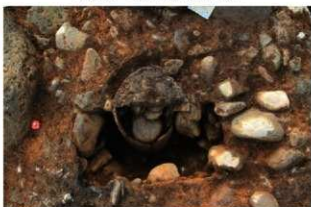
SR5009 土器埋設状況(東から)