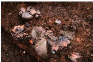
SI102 第3層土器出土状況(北東から)