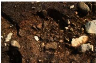
S11093 炉掘方完掘状況(北西から)