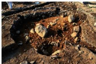
S15004 完掘状況(南西から)