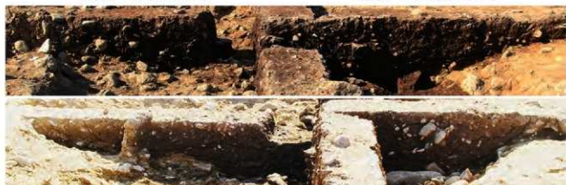
上段：S15002土層A-A' (東から) 下段：土層B-B' (東から)