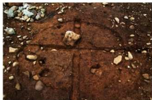
S13016 掘方完掘状況(東から)