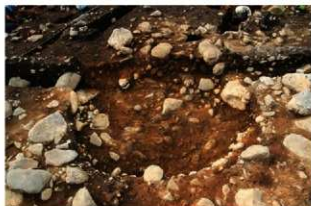
S15044 完掘状況 (南西から)