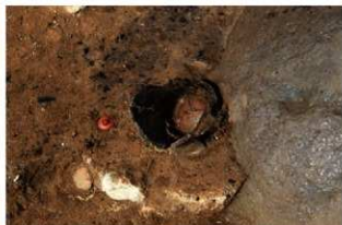
SR62 土器内完掘状況(南から)