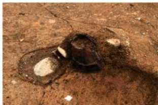
S171 土器出土状況(北から)