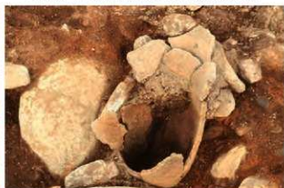
S15006 第1号埋設土器土層(西から)