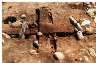
SI1111 炉南北土層(西から)