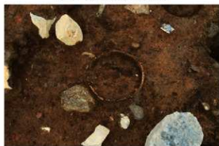
SR13 検出状況(南西から)