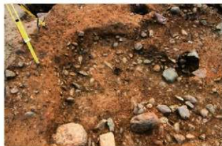
S14006 炉検出状況(北から)