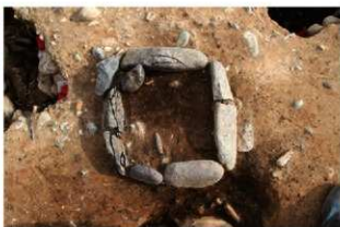
S110003 炉検出状況(北西から)