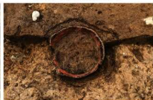
SI1118 埋設土器検出状況(北東から)