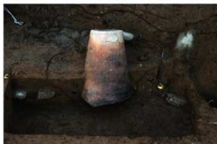
SR87 土器埋設状況(東から)