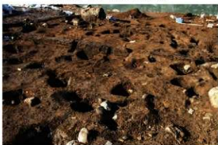
S14009 床面下土層(南東から)