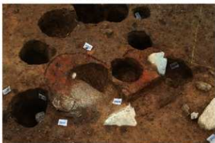
SN110(右)・111(左) 検出状況(北西から)