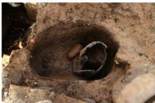
SR58 土器埋設状況及び礫石器出土状況(南東から)