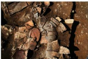
SI110 土器(2-図27-2)出土状況(南から)