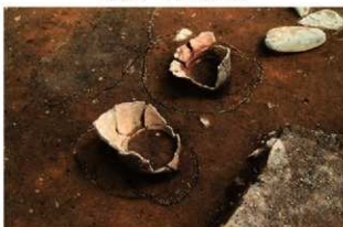
SR4006(上)・4007(下) 検出状況(南西から)