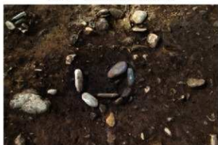
S13009 石囲炉検出状況(東から)