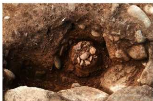
SR1015 土器内容物(南から)