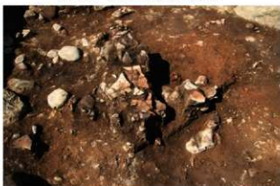
S11063 遺物出土状況(南から)