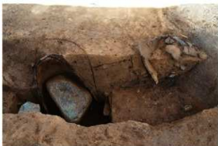
SR51 土器内部破出土状況・SR52 土層(南西から)