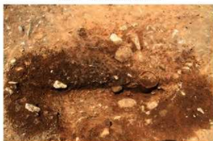
SR5012 土器埋設状況(南から)