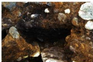
S15073b壁柱(SP9187)と上部貼床(東から)