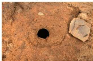
SR4053 礎取り上げ後状況(南から)