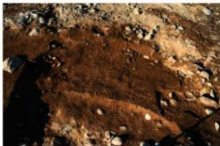
SI1127 完掘状況(南東から)