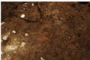
S164 炉検出状況(西から)