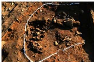
SI102 第5層遺物出土状況(西から)