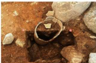
S15007 第2号埋設土器土層(南西から)