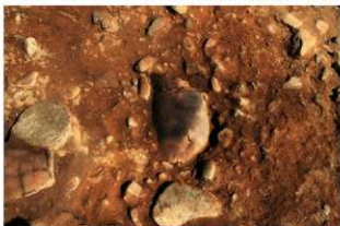
S15003 埋設土器検出状況(南西から)