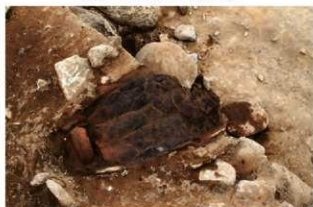
S167 土器出土状況(2-図11-1)(北から)