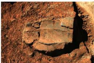
S15049 土器(2-図88-11)出土状況(北から)