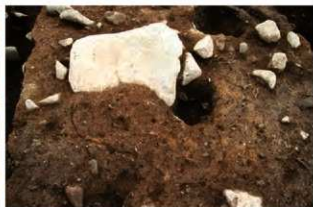
S155 炉検出状況(北から)