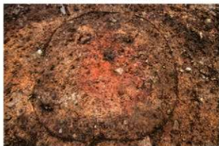
S14040 炉1検出状況(西から)