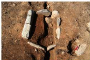
SI10009 炉検出状況(東から)