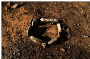
SN4023 検出状況(南西から)