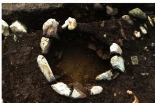
S15508 炉検出状況(北から)