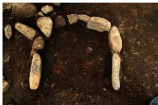
SN5018 検出状況(南東から)