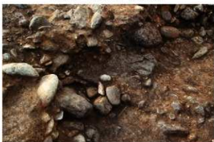
S13014 付属施設土層(東から)