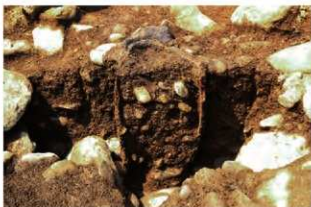
S15002 第2号埋設土器土層(南から)