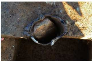
SR23 土器内部様出土状況(西から)