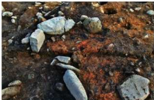
S15056 炉火床面下土層(北西から)