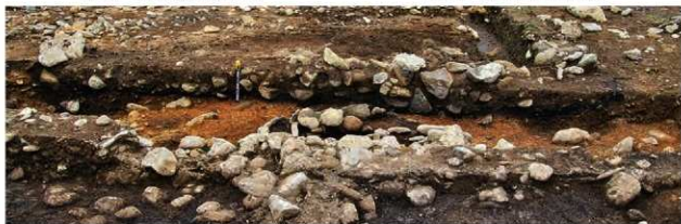
S15034 土層A-A' (東から)