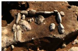
S162 炉検出状況(北から)