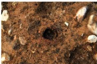
SI18 土器埋設炉(南から)