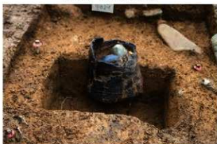
SR4051 土器埋設状況(北から)