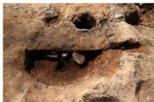
S110006 特殊施設土層(北から)