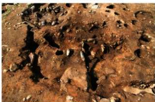
SI138(旧) 完掘状況(南から)