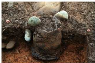
SR5004 土器埋設状況(北から)