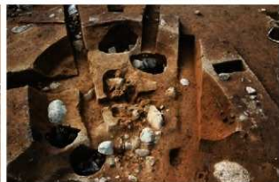
SI1118 掘方完掘状況(南から)