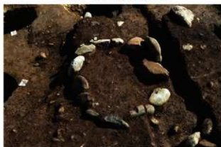
S15507 炉検出状況(西から)