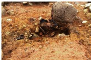
S15007 第1号埋設土器土層(南西から)