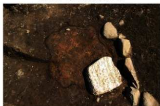
S11076 炉検出状況(西から)