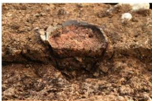
S11137 土器埋設炉土層(北から)