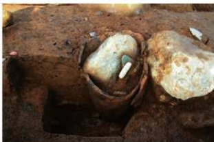
SR30 土器埋設状況(南から)