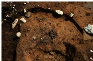
S14011 遺物出土状況(西から)