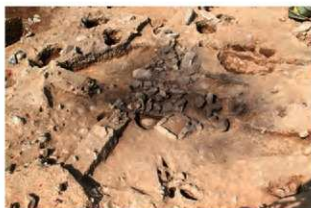
S110003 遺物出土状況(南から)