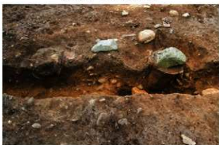
SR1010(左)・1011(右) 土器埋設状況(北西から)