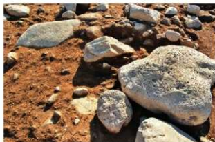
S15037 壁・床面検出状況(南西から)