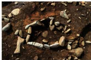
S15035 炉完掘状況(北から)