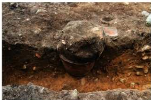
SR1010 土器埋設状況(北西から)