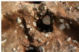
S110003 特殊施設完掘状況(北西から)