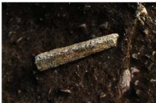
S11091 2層遺物(2-図149-9)出土状況(北から)