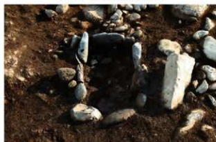
SI1123 炉完掘状況(北から)