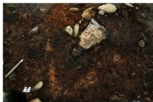
S15047 炉検出状況(東から)