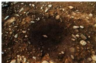
S13007 床面検出状況(東から)