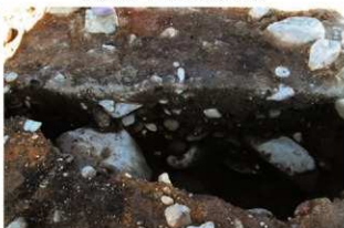
S15073a壁柱(右:SP5111) 土層(南から)