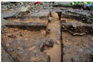
SI5018 土層A-A' (南から)