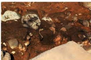
S13002 土器埋設炉土層(南から)