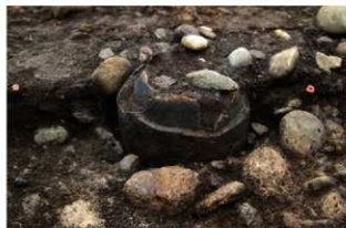
SR4501 土器埋設状況(東から)