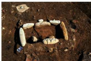
SN4025 検出状況(南西から)