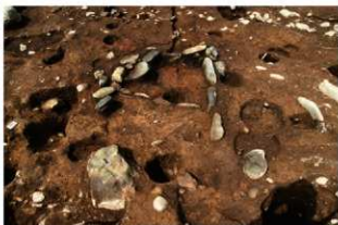
⑥S11 炉検出状況(南から)