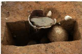
SR4019 土器埋設状況(西から)