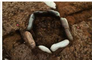
SI1115 炉完掘状況(北から)