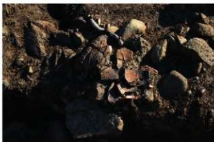
S11106付近 遺物出土状況(西から)