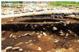
S15043 土層A-A' (西から)