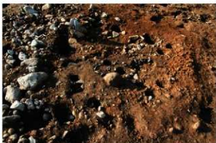
S11136 完掘状況(南東から)