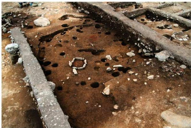
S1103 完掘状況(南東から)