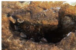
S15047 Pit8・9・11土層(南西から)