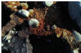
SN5016 検出状況(北西から)