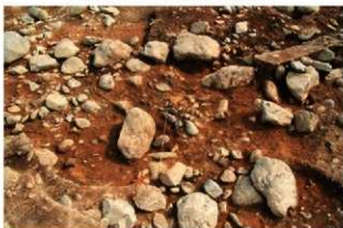
SI5019 完掘状況(南東から)