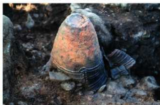
S15005 堆積土上位土器出土状況(南から)