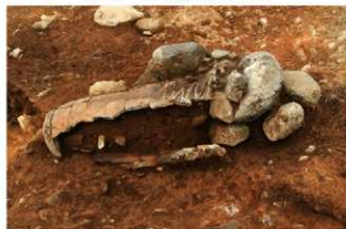
S15003 床面直上土器土層(北東から)