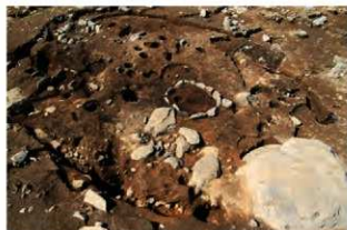
S140 完掘状況(南東から)