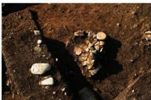
S11063 遺物出土状況(南から)