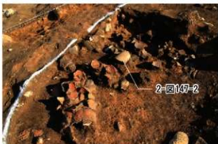
SI102 第5層土器・石棒・石製品出土状況(北西から)