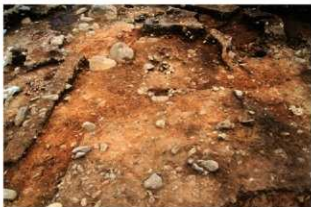
S15014 完掘状況(南西から)