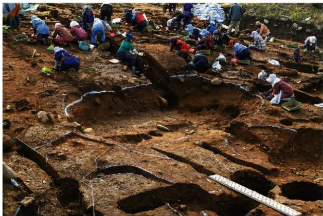
捨て場中のS1102調査状況(北東から)