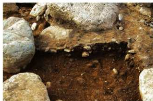
S15051 土層A-A' (南東から)