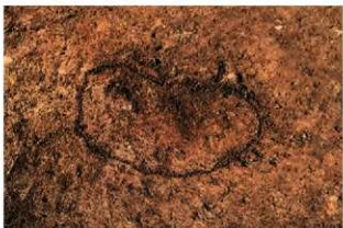
SN3 検出状況(南西から)