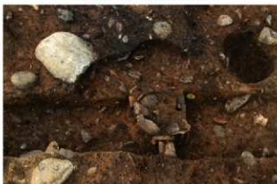
S11072 炉掘方完掘状況(南から)