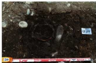
SR93 検出状況(南東から)