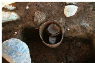
SR13の内部で確認した土器(3-図133-3)(南東から)