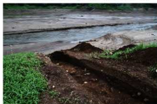
基本層序図⑤b (ⅨF-61ヶ'リット' 付近・南西から)