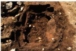
SI1066 炉掘方完掘状況(北東から)