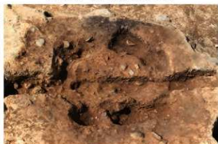
S110007 炉掘方完掘状況(北東から)