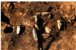
SI138(旧) 炉・配石検出状況(南から)