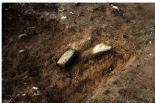
S14016 石冠(2-図151-2)出土状況(南から)