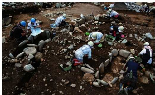
石棺墓群の調査 (3・4・13号墓他)