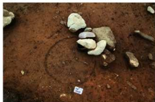
SR4009 検出状況(北東から)