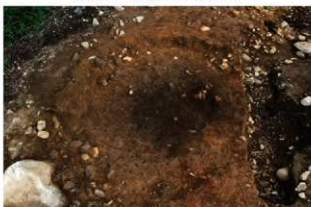
S13010 遺物出土状況(東から)