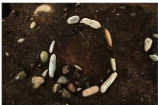
S11077 炉検出状況(北から)