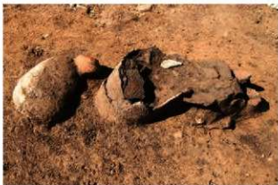
SR80 礫取り上げ後状況(東から)