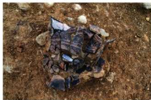
S14006 遺物(2-図65-1)出土状況(北西から)