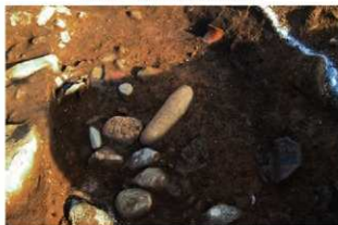
SI102 第5層遺物出土状況(西から)