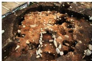
S15043 完掘状況(北西から)