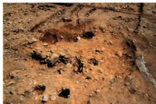
S15003 完掘状況(南西から)