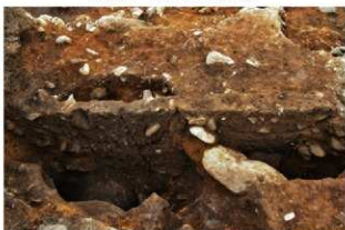
SK5034(左)・5035(右) 土層(東から)