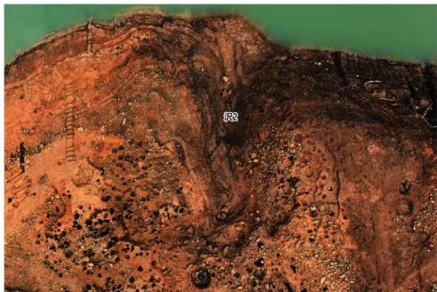
遺跡北側の段丘斜面