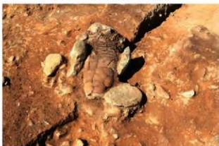
S15003 床面直上土器土層(2-図75-1)検出状況(北西から)