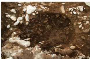
S1115内SK1 完掘状況(東から)