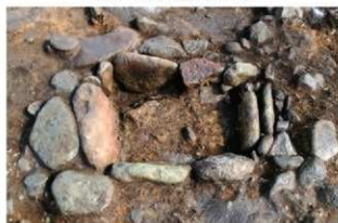
S152 炉完掘状況(西から)