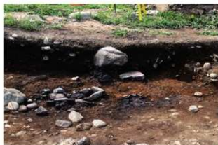
基本層序図① (S11201付近・東から)