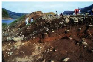
基本層序図④ (ⅧY-69ヶ'リット' 付近・西から)