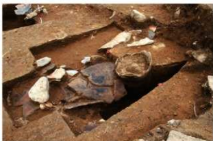
SR65と捨て場堆積層出土の個体土器430(西から)