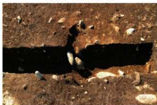
SN1016 掘方完掘状況(南東から)