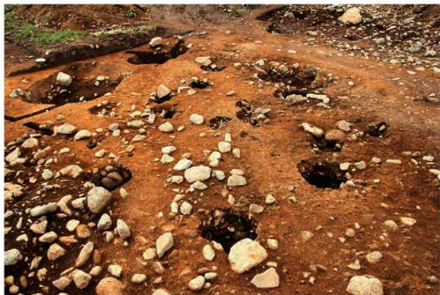
SB1002 完掘状況(南東から)