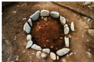
S14020 炉火床面検出状況(南から)