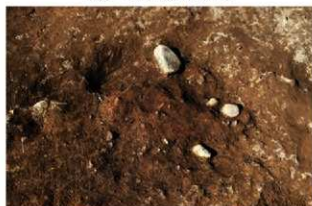
S166 炉検出状況(東から)