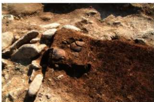
S101 炉1検出状況(東から)