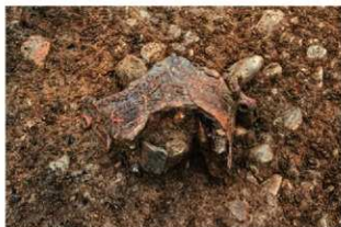
SI1108 床面土器出土状況(2-図55-3)(北から)