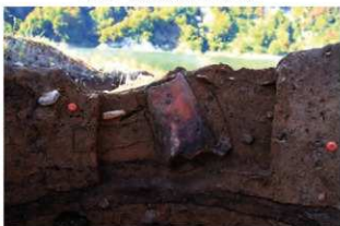
SR16 土器埋設状況(南東から)