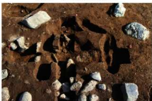
S11126 炉掘方完掘状況(北から)