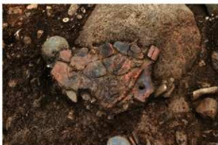
SI1108 床面土器出土状況(2-図55-2)(北から)