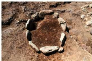
S110017 炉検出状況(北西から)