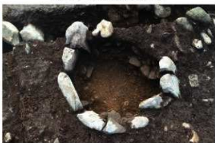
SN5505 内部掘方完掘状況(北から)