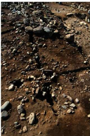
S15501と石棺墓A群(東から)