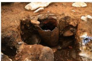
SR12 土器埋設状況(南東から)