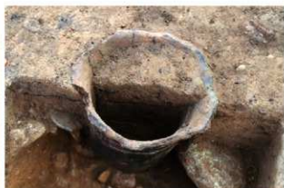
S165 埋設土器内部土層(北から)