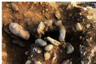
S15502 炉5検出状況(北から)