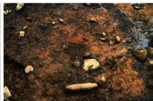
S15047内SN5004 検出状況(東から)