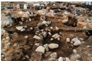
S15059 土層A-A' (南西から)