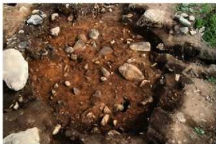
S11086 完掘状況(南西から)