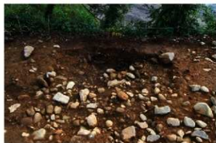
S13015 掘方完掘状況(北から)