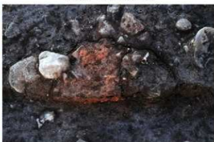
S11089 炉検出状況(東から)