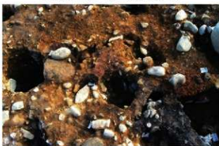
SN5009 掘方完掘状況(北から)