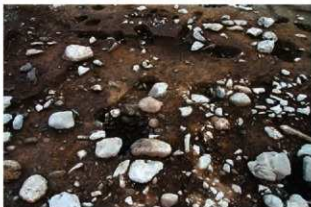
SI1129 掘方完掘状況(北から)