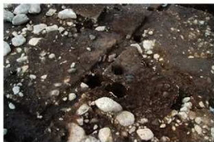
S11078 完掘状況(南西から)