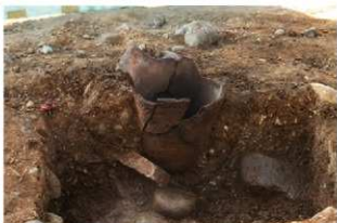
S174 埋設土器土層(北から)