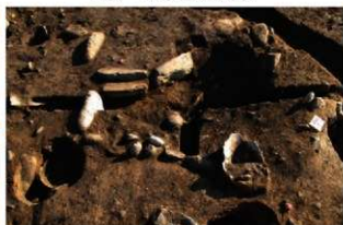
S157 炉検出状況(西から)