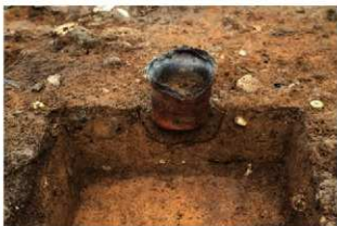
SR4013 土器埋設状況(西から)