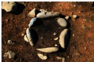
S14003 炉検出状況(南から)