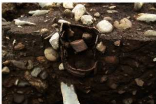
SR10001 土器内部検出土状況(南西から)