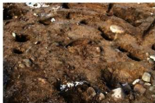
S14055 完掘状況(南東から)