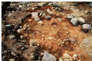
S15007 完掘状況(南西から)