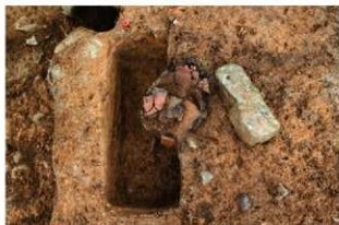
SR10004 検出状況(南東から)