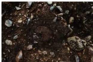
S15502 炉3検出状況(北東から)