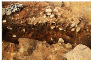
S15052 土層 (南西から)