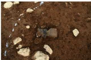
S164 土器出土状況(北西から)