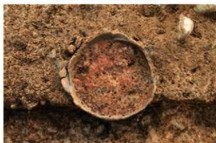
S11137 土器埋設炉検出状況(北から)