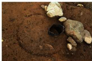
SR4009 礎取り上げ後状況(北東から)