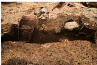
SR4039(右)・4040(左) 土層(南から)