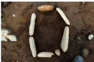
S14013 炉検出状況(南から)