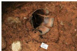
SR4008 検出状況(北東から)