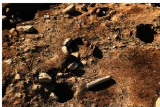
S14010 炉2検出状況(南から)