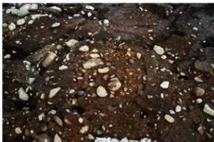
S11080 掘方完掘状況(西から)