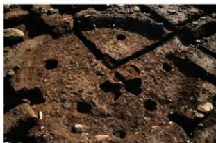
S11085 完掘状況(北西から)