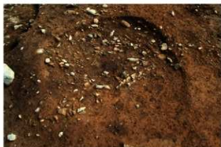
S14007 炉完掘状況(北から)