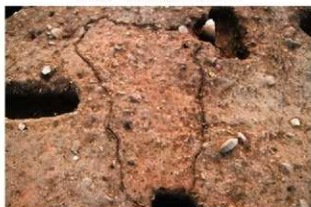
S11085 炉検出状況(東から)