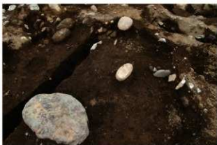
S15504 2層上面砥石(2-図138-4)出土状況(東から)