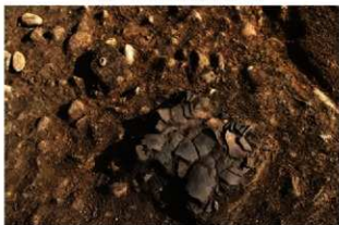
S11082 床面出土土器(2-図47-2)・石製品(西から)