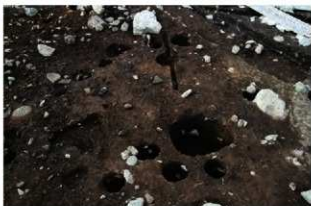
S11075 完掘状況(南西から)