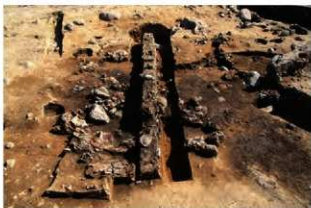
SI110 遺物出土状況(北から)