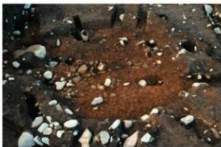
SI1105 堀方完掘状況(南から)