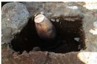
SR114 土器埋設状況(北から)