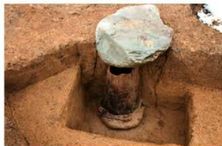
SR4056 土器埋設状況(東から)