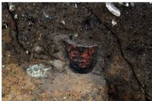
SR121 検出状況(ベルト内)(北東から)