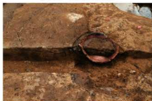
SI1118 埋設土器土層(南から)