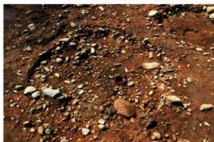
S13003 炉検出状況(東から)