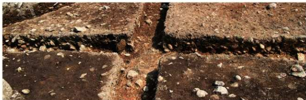
S15015 土層B-B' (北西から)