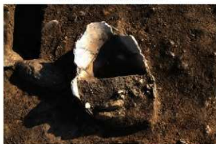
S157 土器出土状況(西から)