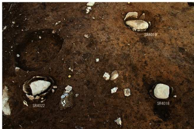
SR4018・4019・4022 検出状況(西から)