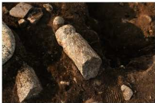
S11065 石棒(2-図147-10)出土状況(南西から)