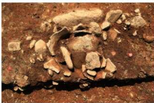
S15014 炉検出状況(北東から)