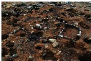
S15068a・b 完掘状況(北西から)