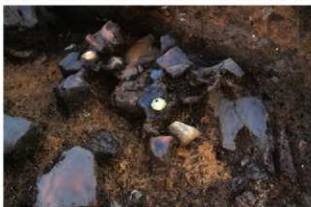
SI102 第5層石製品(2-図147-3)出土状況(北から)