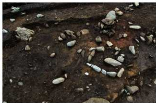
S15035 貼床・炉検出状況(北西から)