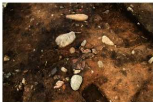
S11072 炉検出状況(西から)