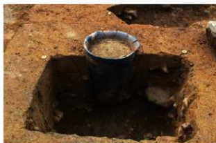
SR4012 土器埋設状況(東から)