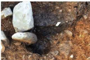
S15048 Pit6 土層(南東から)