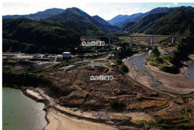
水上(2)遺跡と周辺環境(写真奥は湯ノ沢川上流方面)