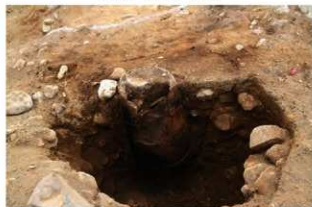
SR103 土器埋設状況(西から)