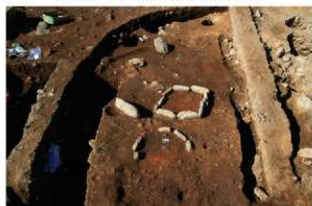
S14043・4044 検出状況(東から)