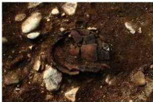
SR53の上部で確認した土器(P-1)(南東から)