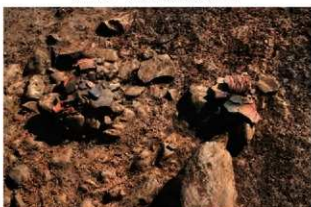
S11090 遺物出土状況(西から)