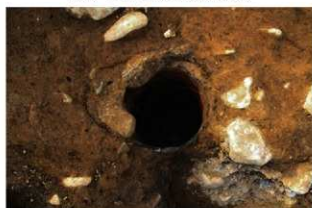
SR12 検出状況(南東から)