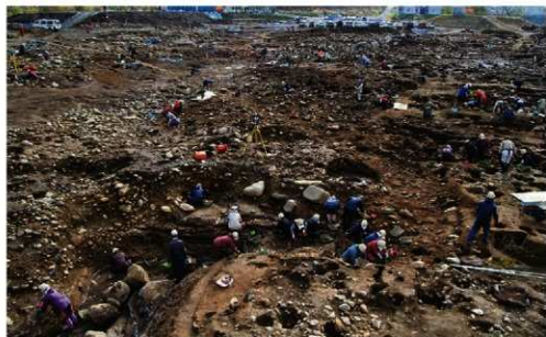
段丘平坦部の調査 (沢2付近)