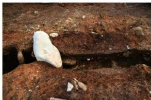
SI102 炉東西土層(北から)