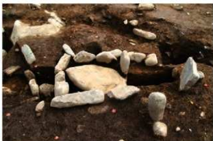
SI138(新) 炉検出状況(北から)