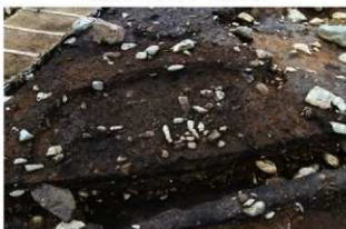
S15039 完掘状況(北西から)