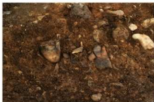
S13010 遺物(2-図62-10等)出土状況(東から)