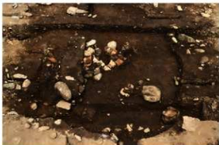
SI1067 遺物出土状況(南から)