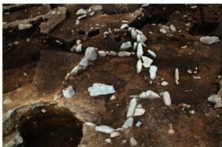
SN121 硬化面検出状況(南から)