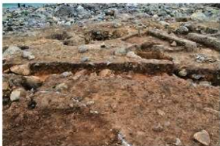
S15057 土層A-A' (南から)