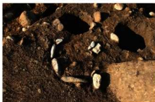
S11136 炉確認状況(南から)