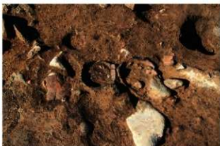
SR15・17 礎取り上げ後状況(東から)