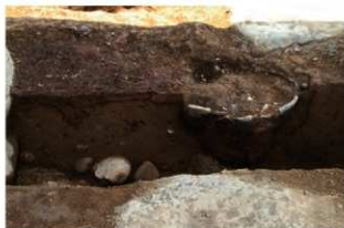
SR1022 土器埋設状況(北西から)