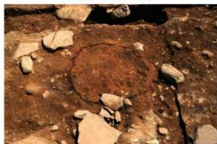
SI1070 炉検出状況(西から)