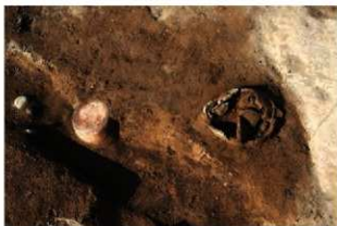
SR51・52 検出状況(南西から)