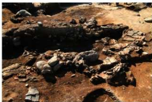
SI110 遺物出土状況(西から)