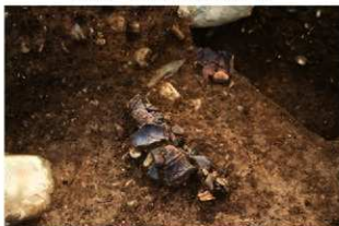
S11099 遺物出土状況(北西から)