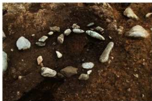
S11120 炉検出状況(南西から)