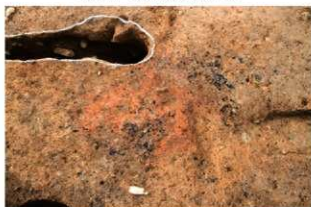
⑥S117 炉1検出状況(東から)