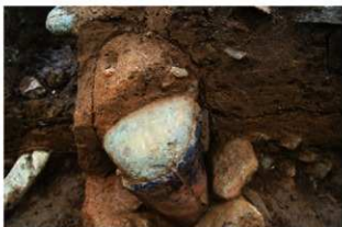
SR18 土器埋設状況(西から)