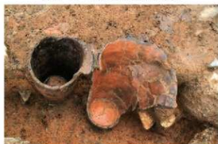
SR15・17 土器内完掘状況(東から)