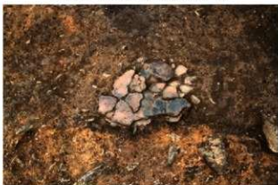
S11073 床面出土遺物(東から)