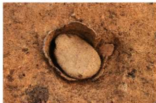
SR4019 検出状況(南西から)