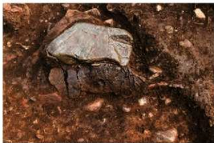
S11086 土器出土状況(北から)