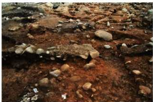
S15055・S15062 土層 (南西から)