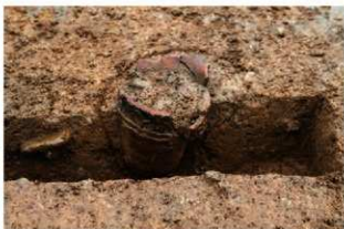
SR1024 土器埋設状況(北から)