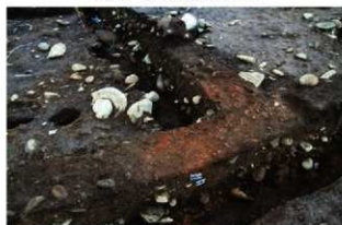
S15024 検出状況(北東から)