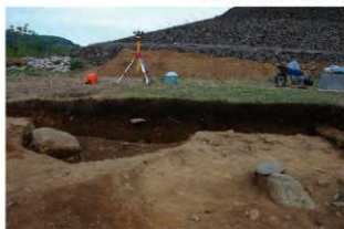
基本層序図③ (S1106付近・西から)