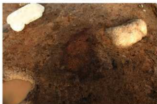
S177 炉検出状況(西から)