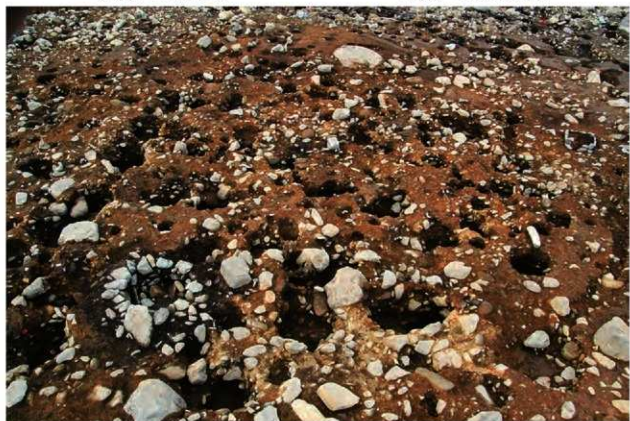
S15068・5073 完掘状況(南から)