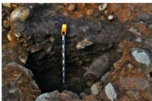
SP9224(左)・9331(右) 土層(南から)