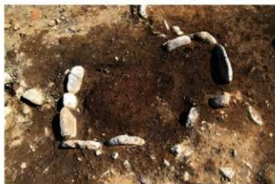
S14010 炉1A・1B検出状況(南から)