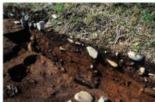
基本層序図⑤a (ⅧT-65ヶ'リット' 付近・北西から)