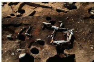
SN122 検出状況(北東から)