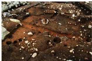
S15018 完掘状況(南西から)