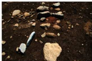
SN5001 検出状況(北西から)