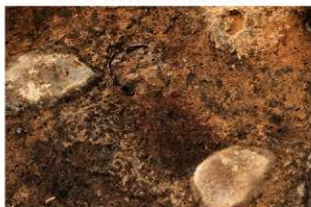
SI1116 炉検出状況(西から)