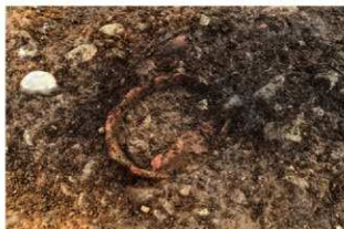
SR10003 検出状況(南東から)