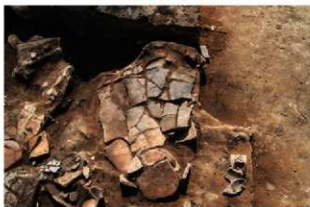
SI110 土器(2-図32-1)出土状況(東から)