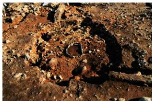
S15034 完掘状況(北西から)