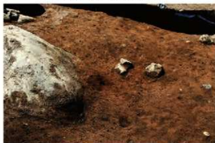
SN65(右)・66(左) 検出状況(北から)