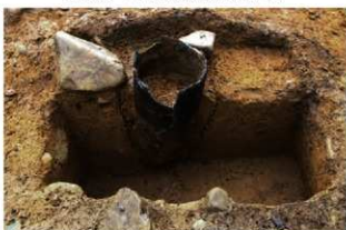
SR4054 土器埋設状況(北から)