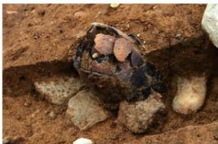
SR4011 土器埋設状況(西から)