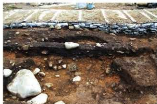
S15065 土層A-A' (西から)