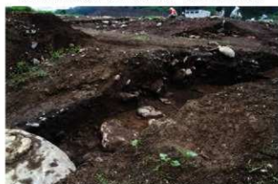
基本層序図⑤b (ⅧX-63ヶ'リット' 付近・北西から)