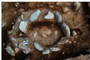
SN10002 検出状況(北西から)