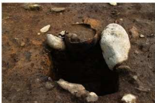
SR1 土器埋設状況(西から)