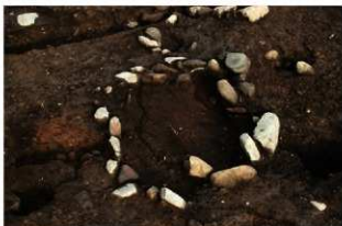
SI1109 炉検出状況(西から)