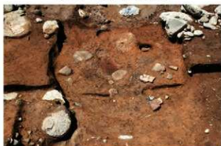
SI1116 完掘遺物出土状況(東から)