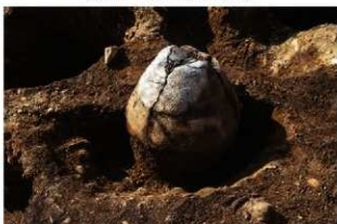
SR5502 土器埋設状況(東から)