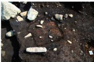
S11074 石棒(2-図148-9)出土状況(西から)