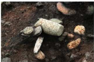
S11077 2層石棒(2-図148-10)出土状況