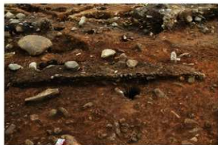
S15054 土層 (南西から)