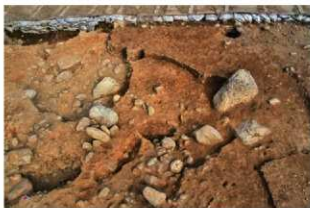
S15058・SK5054 完掘状況(西から)