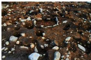
S15056 完掘状況(北西から)