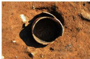
SR7 検出状況(北東から)