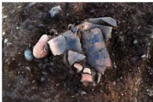
S11096 遺物出土状況(北から)