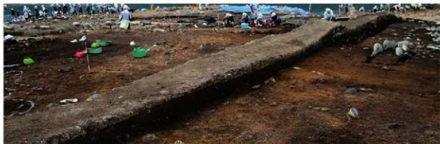
基本層序図① (VIII-P-91'リット'付近・南東から)