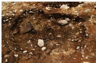
S13011・SK3007 完掘状況(東から)