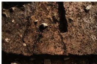
SN1023 検出状況(北西から)