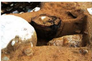
SR4048 土器埋設状況(西から)