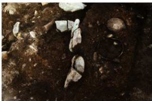
SR92(右), SN70(左) 検出状況(西から)