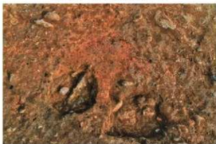
S15059 炉検出状況(北西から)