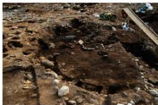
S11125 遺物出土状況(北から)