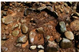
SN10007 検出状況(南西から)