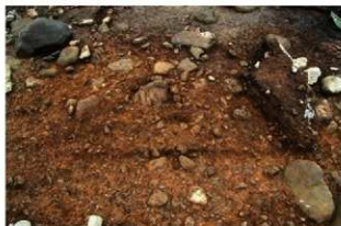
S15029 完掘状況(南東から)