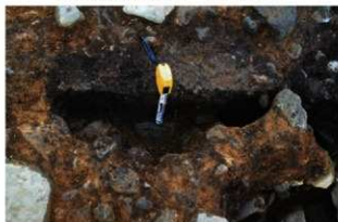
SP9190(右)・9187(左) 土層(北西から)