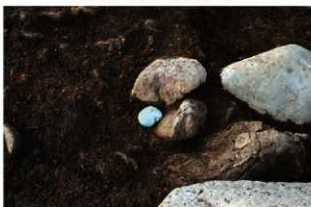
S11108 遺物出土状況(南から)