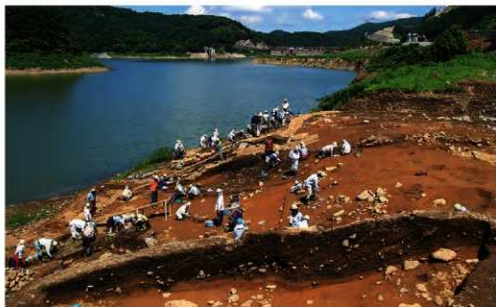
斜面部 (捨て場)調査状況