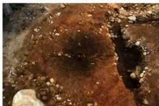
S13010 土器埋設炉検出状況(東から)