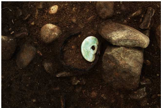
SR109 土器内ヒスイ大珠(3-図316-2)出土状況(北から)