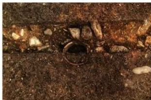
S13010 完掘・土器埋設炉検出状況(東から)