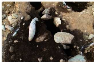
SN5503 検出状況(南西から)