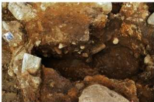
SK5042土層・S15047Pit1003完掘状況(東から)