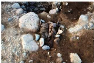
SI1129 Pit2遺物(2-図60-3)出土状況(南から)