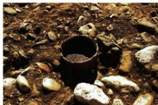
S13003 土器埋設炉検出状況(北から)