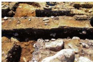
S15007・Ⅲ(廃棄層)1 土層A-A'(北西から)