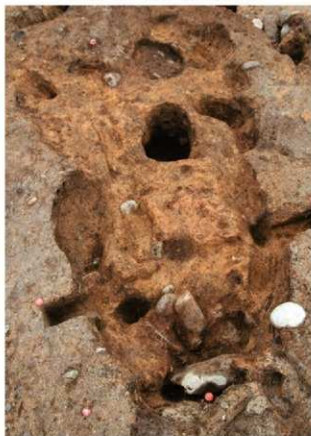
S14009 炉1掘方完掘状況(南から)