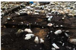
S15016 土層B-B' (西から)