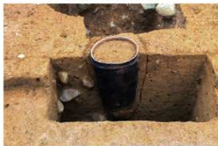
SR4016 土器埋設状況(南から)