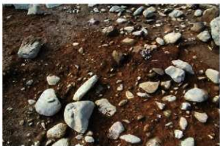
S15052 完掘状況 (東から)