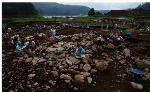
石棺墓群の調査 (石棺墓A群)