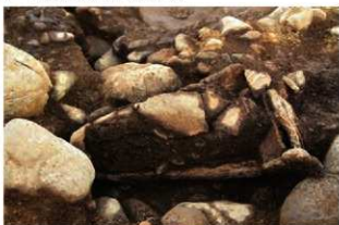
S15002 第1号埋設土器土層(北西から)