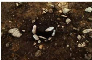
S13009 石囲炉土層(東から)