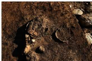
S165 床面付近土器出土状況(2-図9-8)(北から)