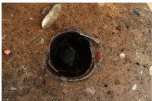
SR101 土器内完掘状況(北から)