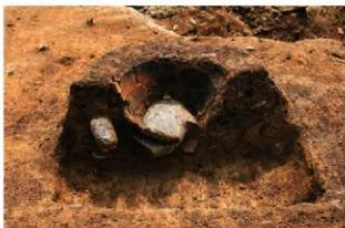
SR1006 土器内完掘(西から)