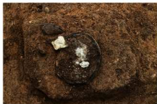
SR104 検出状況(北西から)