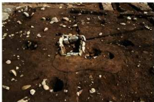
S11066 完掘状況(南西から)