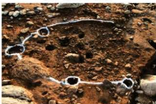
S153 掘方完掘状況(東から)