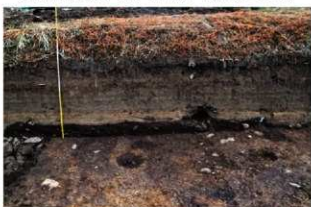
基本層序図⑥ (ⅧO-41ヶ'リット' 南から)