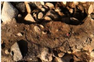
S11125 炉2検出状況(南から)