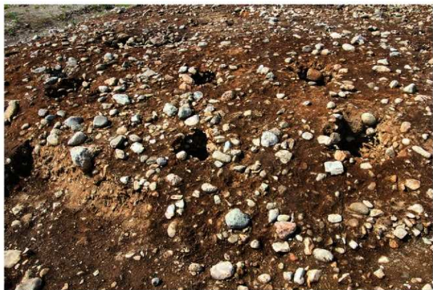
SB1001 完掘状況(南東から)