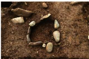
S11133 炉完掘状況(北から)