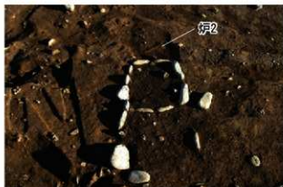
S14009 炉1・2検出状況(北から)