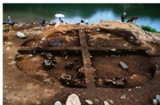
S14010 土層・遺物出土状況(南から)