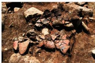
S11089 床面遺物出土状況(北から)