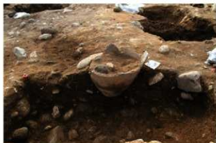
SR4035 土器埋設状況(東から)