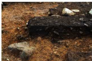
S15063 土層A-A' (西から)