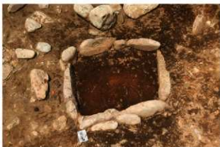
SN5007 検出状況(南東から)