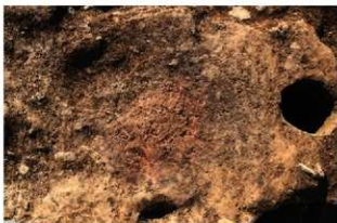
S112 炉1検出状況(北から)