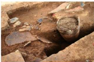
SR65 土器埋設状況(西から)