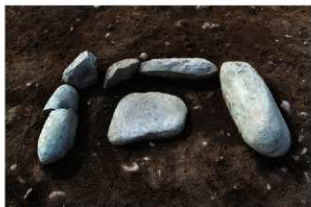
SN6002 検出状況(南東から)