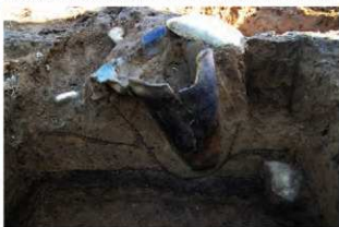
SR14 土器埋設状況(北西から)