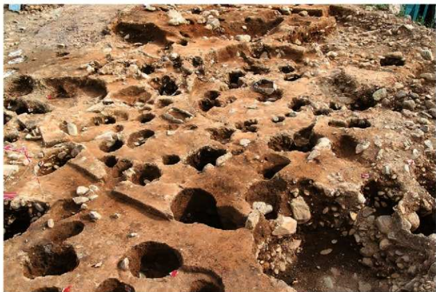
S110003(右)・10008(左) 完掘状況(西から)