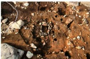
S152 炉完掘状況(南から)