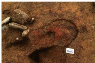
SN112 検出状況(北西から)