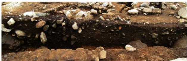
S15045 土層A-A' (西から)