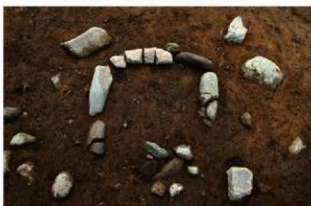
S11126 炉確認状況(北から)