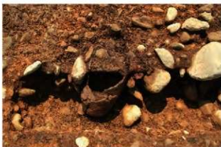
SR5002 土器埋設状況(北から)