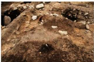
S15502 土偶出土状況(東から)