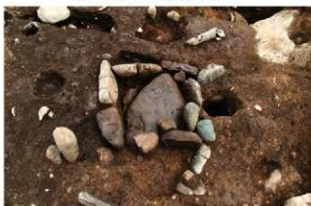
SI138(新) 炉検出状況(西から)