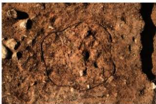
S11097 炉検出状況(南から)