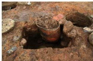
SR6 土器埋設状況(南西から)