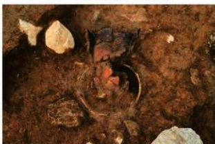
SR13の上部で確認した土器(3-図133-2)(南西から)