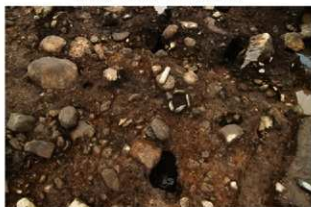
SI1110 完掘状況(南東から)