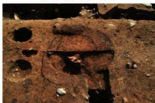
⑥S15 炉検出状況(東から)