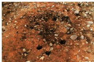
S13005 掘方完掘状況(東から)