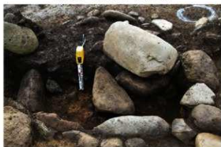
S15016(旧) 炉土層C-C' (北から)