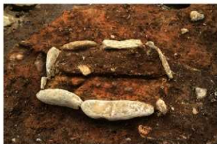
SI5018 炉土層H-H' (南東から)