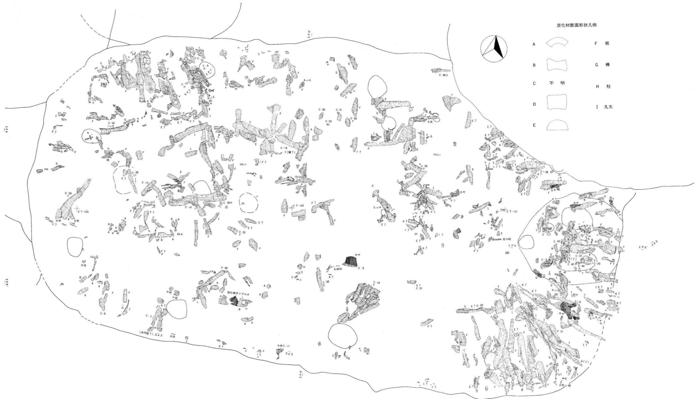
炭化材断面形状凡例