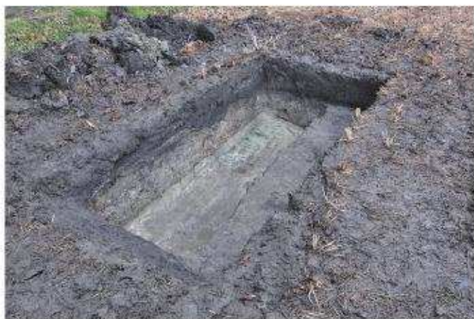
③ 1トレンチ全景（北から）