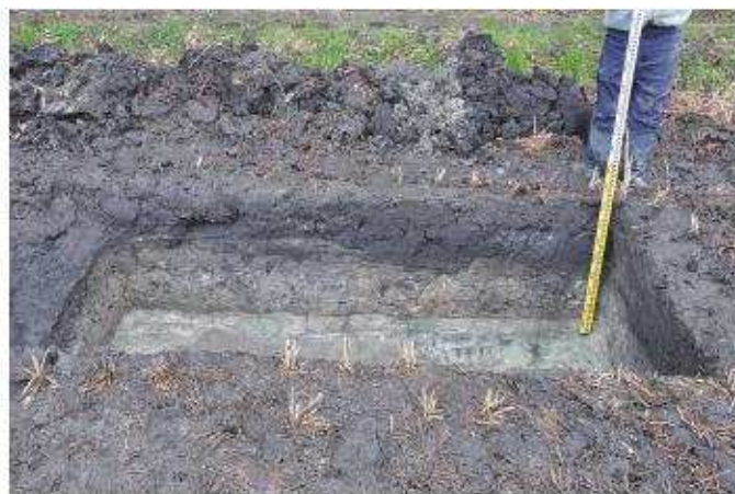
④ 1トレンチ南東壁断面状況（北西から）