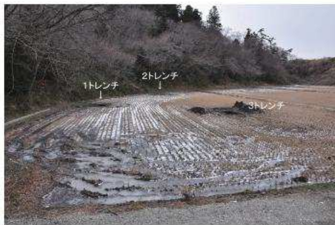
② 調査区全景2（南から）