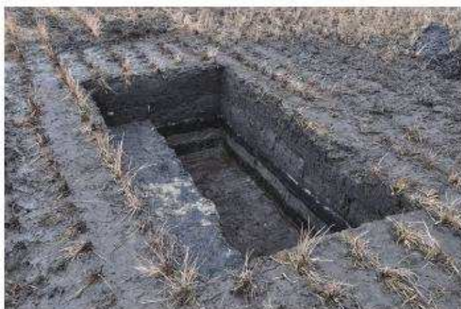
⑦ 3トレンチ全景（西から）