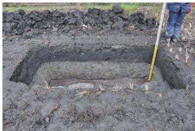
⑥ 2トレンチ南西壁断面状況（北東から）