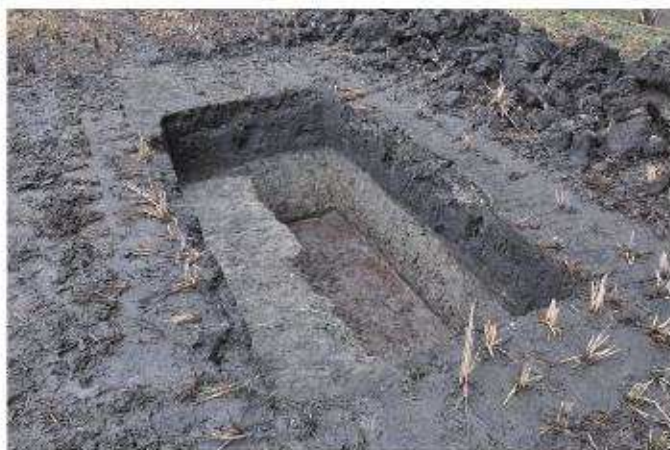
⑤ 2トレンチ全景（北西から）