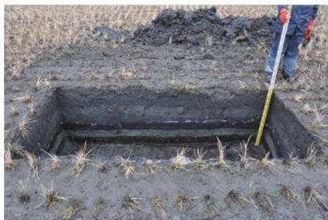
⑧ 3トレンチ南東壁断面状況（北西から）