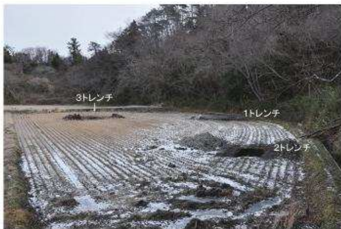
① 調査区全景1（西から）