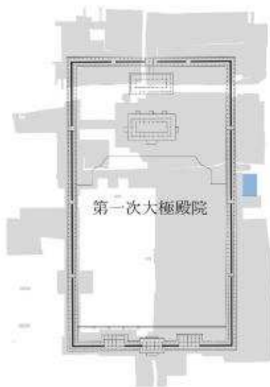
I-2期（奈良時代前半） 第一次大極殿院