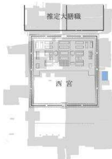
II期（奈良時代後半） 称徳天皇の西宮