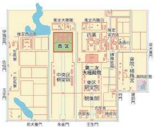
図1 平城宮（上：奈良時代前半、下：後半）