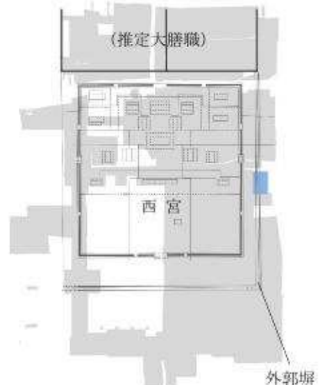
III期（平安時代初期） 平城太上天皇の西宮