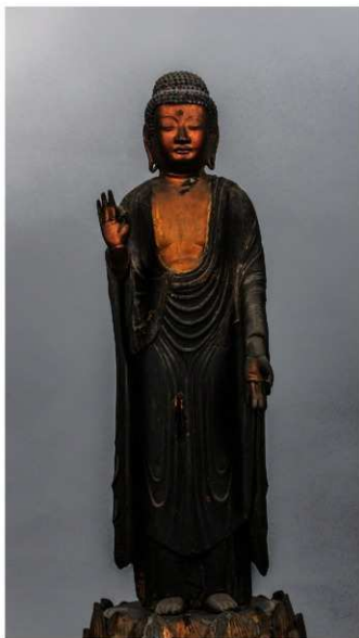
松原市指定有形文化財(美術工芸品 彫刻) 彫第3号

四角く面長のお顔に小さく目鼻を表し、撫で肩の体にヒダ(衣文)が緩やかに表された衣(袈裟と偏衫)をまとっています。下半身の衣のヒダが左から右に流れる表現はより古い時代の像に見られるもので、同じ時代に作られた仏像の多くは右の写真のようにヒダがY字状に表現されています。