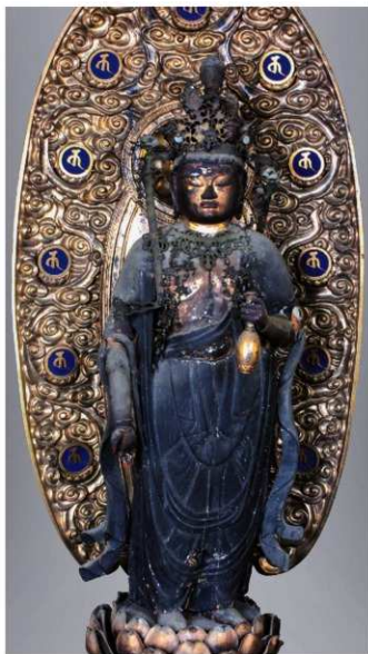
松原市指定有形文化財(美術工芸品 彫刻) 彫第4号

丸みのあるお顔に小さく目鼻を表したままとりのよい穏やかな表情です。肩幅はやや大きく、少し下半身に重心が置かれていますが、ゆったりとした体つきは同じ時代の如来像に共通したものです。衣のヒダがお腹の所だけ鎌倉時代の仏像を思わせる整った大きな起伏で表現されています。