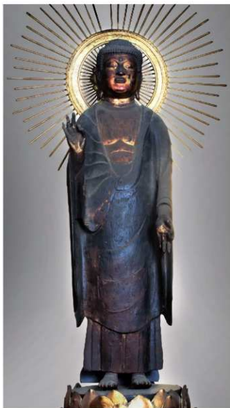
松原市指定有形文化財(美術工芸品 彫刻) 彫第2号

明治政府の神仏分離により梅松院が明治4年(1871)に無くなると、仏像など室物の一部が西方寺に移されました。