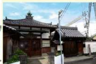
西方寺外観(右:山門、左:観音堂)

近鉄南大阪線河内松原駅下車。北方向へ1.9km。徒歩約24分。 ※駐車場はありません。 見学については、事前に文化財課にお問い合わせください(☎072-334-1550)。