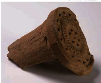
34 元興寺の東大寺式軒瓦 (6235O) 側面にみられる 範端痕・櫛型(木枠)痕