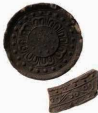
27 平城薬師寺の装階用軒瓦（6276E-6641I）