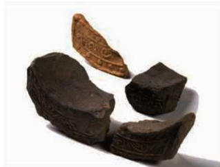
60 横井廃寺の8世紀の瓦