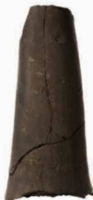
32 元興寺創建軒丸瓦 (6201A)の丸瓦部