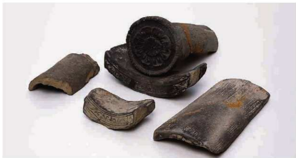
67 菅原遺跡の小型瓦（右京三条三坊八坪出土）

平成4年（1992）に実施した平城京右京三条三坊八坪の調査では、室町時代の瓦積み井戸を検出したが、その構築部材として、菅原遺跡の小型瓦が転用されていた。西へ1.3km離れた菅原遺跡から運ばれたものとみられる。