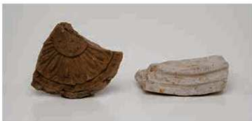
52 禅院寺の軒瓦 (右京三条一坊十四坪出土)

このようなことから、飛鳥寺東南部で発見された礎石建物が東南禅院で、右京三条一坊十四坪の瓦類は、飛鳥の東南禅院から運んできたもので、史料のとおり、調査地の南側の右京四条一坊に禅院寺が存在する可能性が高まった。