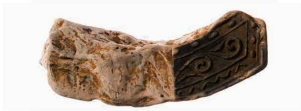
66 紀伊・淡路国分僧寺創建瓦と同范の軒平瓦（6671M）

古市廃寺では興福寺式軒平瓦の紋様構成であるが、興福寺では出土しない軒平瓦（6671M）が出土している。実物照合による観察から、この瓦は紀伊国分僧寺（和歌山県紀の川市）創建瓦および、淡路国分僧寺（兵庫県南あわじ市）創建瓦と同范であることが判明した。また瓦当面の范傷の進行具合や、范の彫り直しの状況の観察と製作技法の検討から、古市廃寺、紀伊国分僧寺、淡路国分僧寺の順に范が移動し、それぞれの国で生産されものと判明した。このように范が、3つの国を移動するのは珍しく、その背景には国を超えた、中央の意思が働いているのかもしれない。