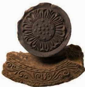
31 元興寺の創建瓦 (6201A-6661D)