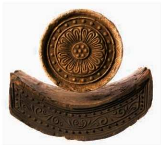
64 創建瓦の組み合わせ（6304G-6668B）