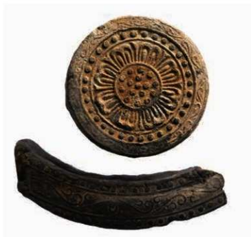
54 平松麿寺出土軒瓦（6345A—6642D）

平松麿寺は、平城京の西端に近い右京四条四坊十二坪に想定される寺院である。戦前から古瓦が採集されており、採集された瓦には7世紀後半の外縁に重圓紋を巡らせた単弁蓮華紋軒丸瓦や重弧紋軒平瓦、8世紀初め頃の外縁に唐草紋を巡らす軒丸瓦（6345A）と偏行唐草紋軒平瓦（6642D）がある。これらの瓦は、橿原市田中町の田中麿寺と同范関係にあることから、平城遷都に際し、藤原京から移ってきたのが、平松麿寺との指摘がある。平成28年（2016）の初めての寺院地内での調査では明確に寺院と判断できる基壇等の遺構はみつからなかったが、多量の瓦を包含する溝がみつき、その瓦の量から、寺院の存在が確実視できるようになった。また出土瓦の中から、新たに薬師寺と同范の軒丸瓦（6236E）がみつかったことは、平松麿寺の性格を考えるうえで貴重である。