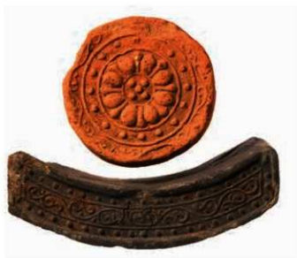
17 大安寺式軒瓦 (6091A-6717A)