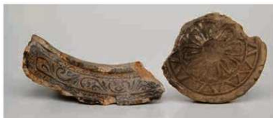
47 姫寺麿寺の8世紀の軒瓦(東市跡推定地出土)