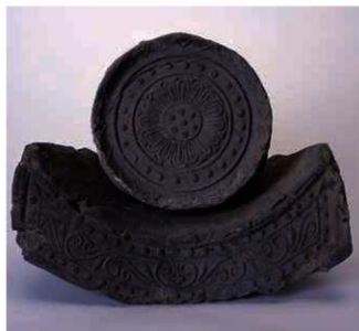
12 平城宮系軒瓦 (6304D-6664A)