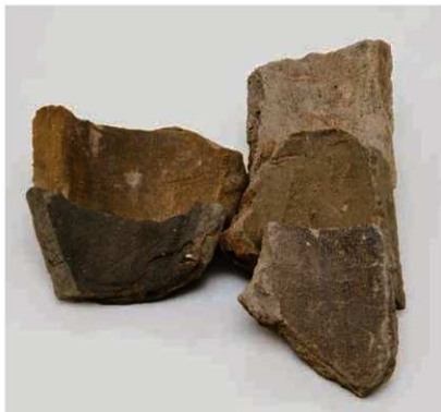
53 竹状横骨丸瓦（右京三条一坊十四坪出土）