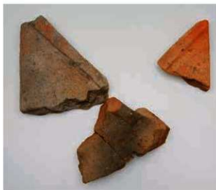
48 葛木寺の隅木蓋瓦(左京五条五坊十三坪出土)

また7世紀後半の軒丸瓦と軒平瓦が出土しており、これらは実物照合の結果、軒平瓦は藤原京の和田庵寺(橿原市和田町)と同范(和田庵寺Ⅲ型式軒平瓦)で、軒丸瓦も同范の可能性が高い(和田庵寺XXⅠ型式軒丸瓦)ことが判明した。なお、8世紀後半の3回反転均整唐草紋軒平瓦(6702F)も両遺跡で出土している。和田庵寺は史料にみえる葛木尼寺の有力候補であることから、平城京左京五条五坊十三坪出土の瓦類は、移建された葛木寺の瓦と考えられ、史料どおり、その遺構が調査地東側に想定される。