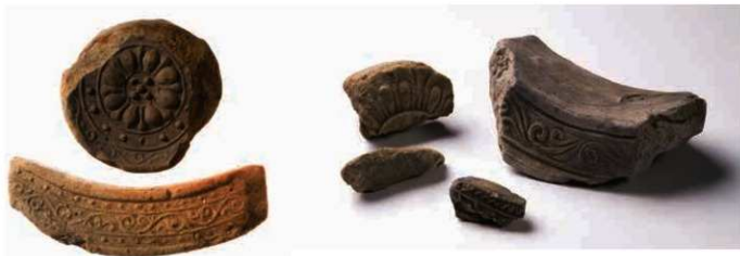
49 葛木寺の軒瓦 (6091A-6717B) (左京五条五坊十三坪出土)