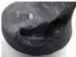
13 大官大寺式軒丸瓦 (6231A) の「歯車接合」