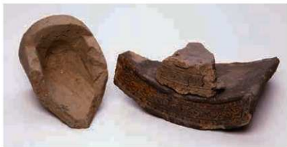
22 刻印のある軒丸瓦 (6091A) と軒平瓦 (6717A)

両者ともに焼成前に押されており、瓦工または瓦工の労務管理者による可能性が考えられる。また、6138E—6690A、6138C a—6712A、6091A—6717Aという組み合わせで葺くことを想定して製作されたものとみることができる。