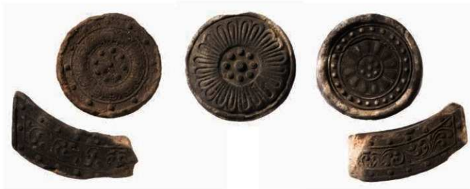
40 西大寺の軒瓦(左: 6236A-6732K・中央: 6200A・右: 6139A-6732Q)

西大寺では三彩垂木先瓦や、花形隅木蓋瓦、火焰形とみられる瓦製品が出土している。『西大寺資財流記帳』の記述から、西大寺の堂塔の意匠はすこぶる華美で、かつ、奇抜、特異なものにするよう計画されたことが強く感じられるとの評があり、これらの瓦からも創建当時の華美な西大寺の伽藍を偲ぶことができる。