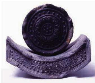
15 大安寺式軒瓦 (6138E-6690A)

大安寺式軒瓦は大安寺で最も多く出土する軒瓦である。軒丸瓦は単弁蓮華紋を飾り、軒平瓦は連続した唐草紋を飾る点が特徴である。平城宮系軒瓦(6304D-6664A)を模倣して、製作されたものが最初の大安寺式軒瓦(6138E-6690A)とみられ、他に数組の大安寺式軒瓦が確認できるが、圧倒的に多く出土するものは、天平19年(747)以降製作の12弁の単弁蓮華紋を飾り、間弁が三角形を呈する軒丸瓦(6138Ca)と牛頭形の中心飾りが特徴的な軒平瓦(6712A)の一組で、主に僧房の屋根に葺かれた。これら大安寺式軒平瓦は段頸であること、凸面側は縄叩きの痕跡を残さないように調整することが製作技法上の特徴として挙げられ、8世紀後半の大安寺造瓦所の特徴とみることができる。