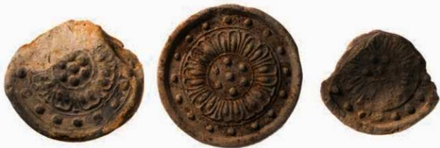
35 東大寺式軒丸瓦 (左から 6235 E・6235 F・6235 D)

東大寺大仏は天平 17 年 (745) に春日山西麓に造られ始め、天平勝宝元年 (749) に大仏の鑄造が終了した頃から、大仏殿の造営が開始されたとみられる。天平勝宝 4 年 (752) に大仏開眼供養が行われており、この時大仏殿も完成したとされる。この大仏殿造営時の瓦は、弁と間弁が立体的な複弁 8 弁蓮華紋を飾り、外区には珠紋を飾る軒丸瓦 (6235 型式) と、内区に三葉形を中心葉で囲み、その上に対葉花文を配した宝相華紋の中心飾りをもつ 3 回反転均整唐草紋を飾る軒平瓦 (6732 型式) で、東大寺式軒瓦と呼ばれるものである。製作技法にも特徴があり、軒丸瓦は丸瓦先端の凹面側を切り落とし、片刃状にして瓦当と接合する。軒平瓦は基本的に凹面に糸切痕が無く、凹面側から狭端面、さらには凸面側に連続する布目を残すことから、布が敷かれた台の上に、粘土塊を置いてのぼし、台に敷いた布を凸面側に折り返し、その上から掌で加圧・成形した凸面押圧技法によるものである。