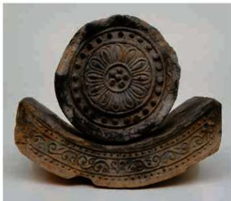
16 大安寺式軒瓦 (6138Ca-6712A)