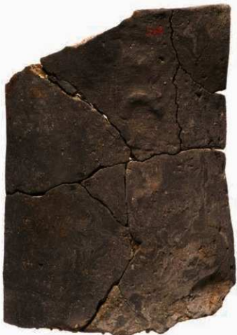
43 西大寺系東大寺式軒平瓦凸面の布目と押任痕 (凸面押任技法、下が瓦当面)