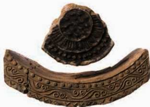
26 平城薬師寺の軒瓦（6276A-6641H）

平城薬師寺と本薬師寺には同范の瓦が多数あり、両寺院の造瓦体制が同一であったとみられる。そのため平城薬師寺創建軒瓦は7世紀末頃の紋様構成の瓦が大半を占め、6276A-6641Hもその一組である。内区に偏行唐草紋を飾る軒平瓦は藤原宮期の流行である。小型の軒瓦一組（6276E-6641I）は装階用である。