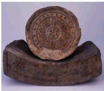
18 大安寺式軒瓦 (6137A-6716C)