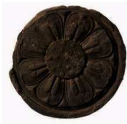
5 7世紀後半の軒丸瓦 (法隆寺 35B)

8世紀の軒瓦のうち、東大寺式軒丸瓦(6235G)は東大寺での修理の際に下ろされた瓦であろうか。