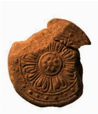
44 新薬師寺伽藍補修期の軒丸瓦 (SYM01)

SYM01 と型式設定される軒丸瓦は、新薬師寺以外ではみつからない。8 弁の蓮華紋は複弁であるが、子葉が 3 つあるようにみえる表現は珍しい。伽藍補修期の瓦とされる。