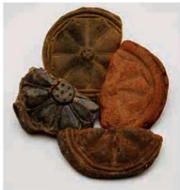
58 横井廃寺の7世紀前半の瓦

最も古い軒瓦は弁が角張り弁端に珠点をおく、無子葉単弁8弁蓮華紋で、7世紀前半の瓦である。天理市石上廃寺採集品に同范瓦がある。その改范資料も姫寺廃寺で出土している。同じ頃の鴟尾も採集されており、おそらく飛鳥時代には金堂が完成していたとみられる。7世紀後半の瓦には単弁16弁蓮華紋軒丸瓦や、蕨手状の唐草を背中合わせにした中心飾りをもつ唐草紋を飾った軒平瓦がある。8世紀の軒瓦は平城京内各所で出土するものと同范で、官が維持管理に関わったものとみられる。推定金堂付近で採集された側面に幾何学紋様を飾る紋様埴は珍しい。金堂内部の須弥壇（仏像を置く壇）など、建物内部の装飾に使用された可能性が考えられる。