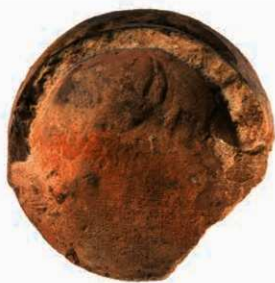
29 軒丸瓦 6301Aの瓦当裏面