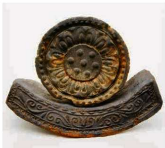
11 大官大寺式軒瓦 (6231A-6661B)

平城京左京六条四坊・七条四坊にかけて 15 町の寺地を占めた大安寺は、百済大寺（桜井市吉備の吉備池廃寺）・高市大寺・大官大寺（明日香村小山・橿原市南浦町）を前身とする奈良時代の肇頭官寺である。創建瓦は大官大寺創建瓦である大官大寺式（6231A・B・C-6661A・B・C）と平城宮系（6304D-6664A）の2グループの軒瓦が用いられた。平城宮系軒瓦は平城遷都後に新造された瓦で、軒平瓦は宮内で使用された軒瓦と同范、軒丸瓦はよく似た瓦であることから、大安寺創建時には、宮を造営する役所（造宮省）からの范（紋様木型）の援助が想定される。ただし、軒丸瓦に接合する丸瓦の先端を歯車状に加工した後、接合する「歯車技法」は、大官大寺式・平城宮系軒丸瓦双方に確認でき、両者同系統の造瓦工人による製作とみられる。平城宮系軒瓦は、京都府綴喜郡井手町の石橋瓦窯で生産されたことが判明している。