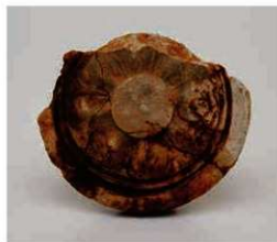
62 山村廃寺の軒丸瓦

創建瓦は有子葉単弁8弁蓮華紋軒丸瓦と均整バルメット唐草紋軒平瓦で7世紀末から8世紀初め頃とみられている。軒平瓦は平瓦の広端部側に刻みを入れた後、これを瓦当部用粘土で平瓦の側面まで包み込んだ、いわゆる包み込み式の製作技法で造られている。包み込み式は統一新羅の軒平瓦にみられる製作法で、山村廃寺の建立氏族や造瓦工人との関係が目目される。