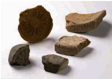
59 横井廃寺の7世紀後半の瓦