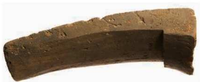
19 大安寺式軒平瓦 (6712A) の 形態と平瓦部の調整