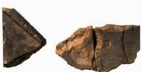
25 大安寺講堂の隅木蓋瓦

大安寺では緑釉と透明釉を施した円形のもの、緑釉と褐釉を施した方形の2種が出土しており、軒を支える垂木が上下二段からなる二軒（ふたのき）とよばれる建築構造の建物があったことがうかがえる。