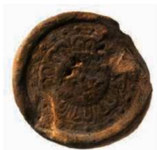
55 平松麿寺出土薬師寺同范瓦（6236E）