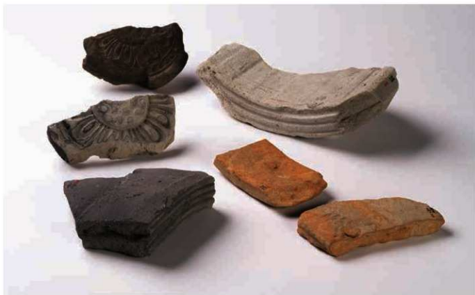
45 海龍王寺前身寺院の瓦(左京一条三坊四・五坪出土)

7世紀前半とみられる無子葉単弁10弁蓮華紋軒丸瓦、7世紀後半の複弁6弁蓮華紋軒丸瓦は姫寺廃寺と同範瓦がある。また、7世紀後半の重弧紋軒平瓦については、平瓦の広端部凸面側に、顎部用粘土を貼り付けて製作するが、接合時に顎下面数箇所にも円形貫通孔を設け、そこに粘土釘を差し込んで接合する。その効果の程は不明だが、顎部粘土を強固に接合することを意図したものであろう。この特異な製作法をもつ重弧紋軒平瓦も姫寺廃寺で出土している。このように瓦をみる限り、両寺院には強い関係性が想定される。