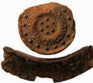
33 元興寺の東大寺式軒瓦 (6235P-6732U)