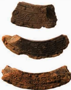
36 東大寺式軒平瓦 (上から 6732 G・6732 H・6732 D)