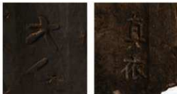
39 東大寺出土恭仁宮式文字瓦(部分)

東大寺法華堂に葺かれていた瓦や、食堂の北側の大炊殿出土瓦には、人名印を押捺した恭仁宮式文字瓦と呼ばれる瓦がある。恭仁宮式文字瓦は天平12年(740)頃に恭仁宮(京都府木津川市)造営を契機に生産された瓦とみられ、大仏殿造営以前となる。史料から東大寺の地には、その創建以前から古代寺院が成立していたと指摘されており、これらの瓦がその事を示すものともみられる。