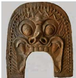
23 大安寺西塔出土鬼瓦