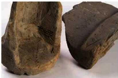
21 ヘラ描き「×」のある軒丸瓦 (6138E) と軒平瓦 (6690A)

軒平瓦 6712Cは軒平瓦 6712Aの小型型というべき瓦で、尾張国分僧寺（愛知県稲沢市）創建瓦と同范関係にあることが判明している。瓦当面に残る范型の傷み具合等から、大安寺の造瓦所から、尾張国分僧寺の造瓦所へ范が移動したとみられる。また尾張国分僧寺の軒平瓦には大安寺式軒平瓦と同様の製作技法の特徴がみられ、大安寺造瓦所の瓦工が、范を持参して尾張で技術指導にあたり、尾張の瓦工が製作したか、あるいは尾張の瓦工が大安寺造瓦所で造瓦技術を学んだ後、范を持ち帰り製作したと想定される。