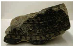
38 東大寺出土大安寺式軒平瓦(6712A)

史料によれば、天平勝宝8歳(756)に造東大寺司が興福寺に対して、3万枚の瓦の製作を依頼している。また、翌年には造東大寺司が摂津職を通じて、四天王寺(大阪市天王寺区)・梶原寺(大阪府高槻市)に瓦の製作を依頼している。これらは天平勝宝8歳に崩ぜられた聖武上天皇の一周忌までに、大仏殿回廊の完成を急いだためと解されている。大仏殿北面回廊付近の調査では、大安寺以外であまり出土例が無い大安寺式軒瓦が出土している。このことから、史料にはみえないが、大安寺への瓦の発注もあったことがうかがえる。