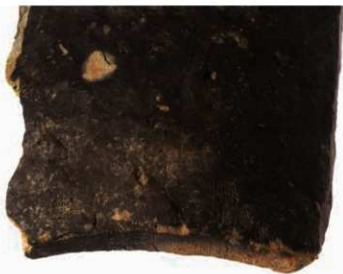
37 東大寺式軒平瓦の平瓦部狭端面と凸面に残る布目痕と凸面に残る押圧痕 (凸面押圧技法)