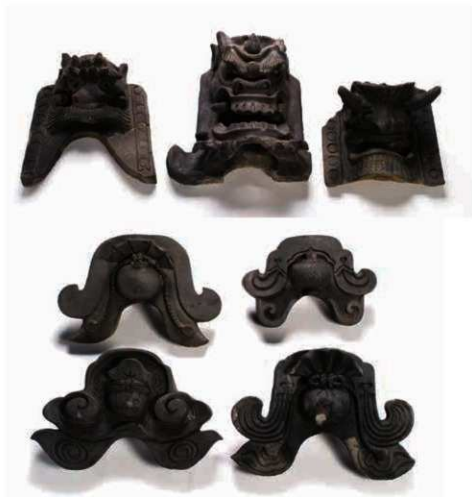
9 近世から近代にかけての鬼瓦

井上組旧所蔵鬼瓦は26点あるが、いずれも近世から近代の製作とみられる。鬼面紋鬼瓦は寺院に葺かれていたものだろう。