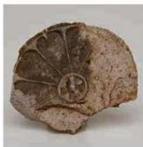
30 元興寺出土飛鳥寺創建瓦 (飛鳥寺I型式軒丸瓦)

8世紀後半には、東大寺式軒瓦(6235O・P-6732U)が使用される。ただし元興寺以外で同范品の出土は聞かない。軒丸瓦はキザミ目を付けた丸瓦を瓦当部に接合し、軒平瓦は粘土板を素材とし、凸面に縄叩き目を残す。製作技法も東大寺で出土する東大寺式(東大寺系東大寺式)とは異なり、元興寺系東大寺式と呼ぶべきものである。