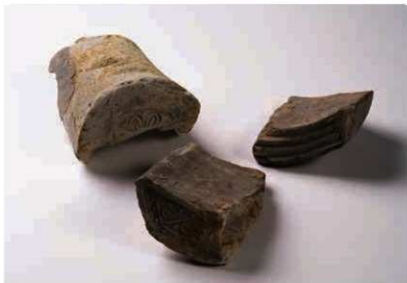
56 済恩院の瓦 軒丸瓦(6143A)、軒平瓦(前:6691A、後6572J)