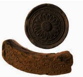
65 8世紀後半の組み合わせ（6141B-6768A）