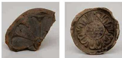
46 姫寺麿寺の7世紀代の軒丸瓦(東市跡推定地出土) 左:7世紀前半 右:7世紀後半

8世紀の出土軒瓦のうち、外区の線鋸歯紋が特徴的な軒瓦一組(6127A-6659A)は、横井庵寺・平松庵寺・七条庵寺など平城遷都時に移建された寺院も含む7世紀代創建寺院と同范瓦がある。