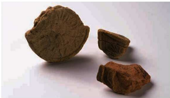
57 七条麿寺の瓦(右京八条三坊十六坪出土、軒丸瓦6127A・軒平瓦6659A)

七条一丁目に所在する天武神社の周辺では、戦前から古瓦の散布が知られ、七条麿寺と呼称される。平城京の右京七条三坊十三坪付近が寺院地と想定されている。採集された瓦のなかには、藤原京の醍醐麿寺(橿原市醍醐町)と同范とみられる7世紀後半の均整バルメット唐草紋軒平瓦があり、平城遷都前の寺院あるいは、藤原京から移建された寺院の可能性が考えられる。寺院地内での発掘調査は行なわれていないが、南の隣接地で平成5年(1993)と平成12年(2000)に行った試掘調査では、7世紀から8世紀にかけての土器とともに、8世紀の外区線鋸歯紋が特徴的な軒丸瓦(6127A)1点、軒平瓦(6659A)2点が出土している。これらの軒瓦は、七条麿寺採集品にも確認できるもので、七条麿寺からの流入品とみられる。横井麿寺や平松麿寺等、7世紀創建の寺院で同范瓦がみられる。