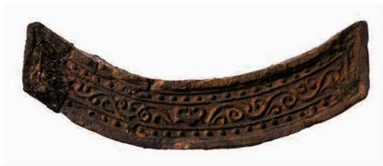
20 尾張国分僧寺創建瓦と同范の大安寺式軒平瓦 (6712C)