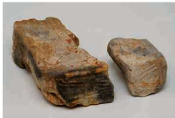
61 横井廃寺の紋様埴