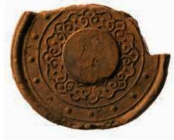
63 古市廃寺の宝相華紋軒丸瓦

出土点数から8世紀前半の創建瓦の組み合わせ（6304G-6668B）と、後半の組み合わせ（6141B・宝相華紋軒丸瓦-6768A）の二組が想定される。創建瓦の組み合わせは、同范瓦ではないが、同型式の瓦の組み合わせが平城宮・大安寺・薬師寺にあることから、造宮氏族と造宮省との関係の深さが指摘されている。宝相華紋軒丸瓦は中国で考案された想像上の植物紋様である宝相華紋を輪のように配置した軒丸瓦で、我が国で他に例が無い珍しい瓦である。