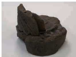
14 平城宮系軒丸瓦 (6304D) の「歯車接合」