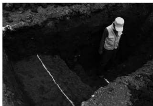
ハケ遺跡第 20 地点トレンチ 5 掘跡完掘