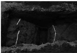
ハケ遺跡第 20 地点トレンチ 4 掘跡完掘