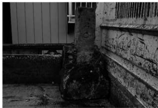
ハケ遺跡第 20 地点境界杭出土状況