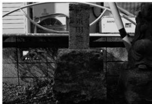
ハケ遺跡第 20 地点境界杭