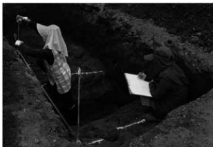
ハケ遺跡第 20 地点調査風景