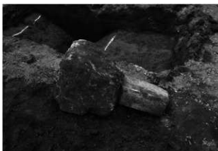
ハケ遺跡第 20 地点境界杭出土状況