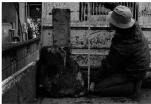
ハケ遺跡第 20 地点境界杭出土状況