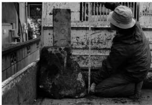
ハケ遺跡第 20 地点境界杭出土状況