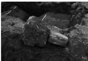
ハケ遺跡第 20 地点境界杭出土状況