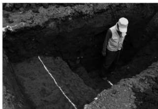
ハケ遺跡第 20 地点トレンチ 5 掘跡完掘