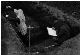
ハケ遺跡第 20 地点調査風景