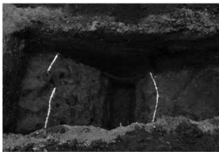
ハケ遺跡第 20 地点トレンチ 4 掘跡完掘