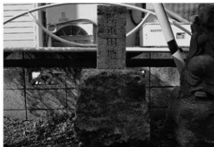
ハケ遺跡第 20 地点境界杭