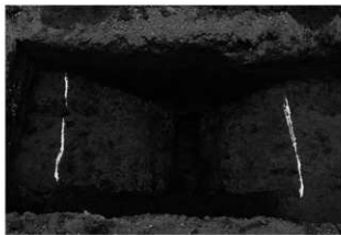
ハケ遺跡第 20 地点トレンチ 3 掘跡完掘