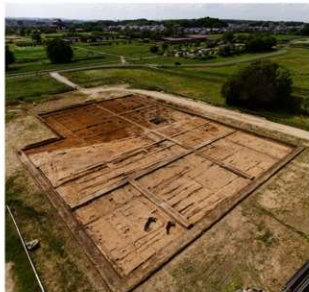
調査区全景(南東から)

去る6月17日には現地説明会を開催しました。梅雨の最中で天気心配されましたが、幸い晴天に恵まれ、813名の方にお越しいただきました。東院地区の調査はこれからも続きますので、今後の調査にご期待ください。(都城発掘調査部 海野 聡)