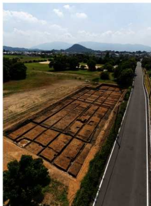
調査区全景（北東から）