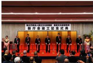
230名を超える出席者に見守られてのテープカット

奈良文化財研究所は創設以降、過去の庁舎はいずれも既設の建物を改修しての利用であり、今回はじめて新設の建物となりましたが、発掘調査時に遺構が確認されたことから大きな設計変更をおこない、当初予定から2年遅れでの竣工となりました。移転は9月におこなわれ、10月から本格的に運用を開始する予定です。（研究支援推進部 津壽 憲治）