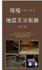
リーフレット表紙