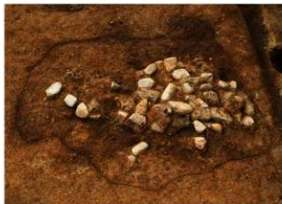
回廊礎石据付痕跡（東から）

また、第20次調査では、藤原宮造営時に人工的に掘られた幅6m、深さ2mの大規模な南北溝を検出しています。この南北溝は、藤原宮の中心部分を南北に貫流しており、最下層の堆積土からは藤原宮