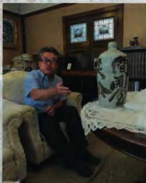
間瀬商店 現社長に話をうかがう 間瀬屋は間瀬商店と名称を変えながらも着町に現存しています。現社長からはお店の歴史をうかがいました。