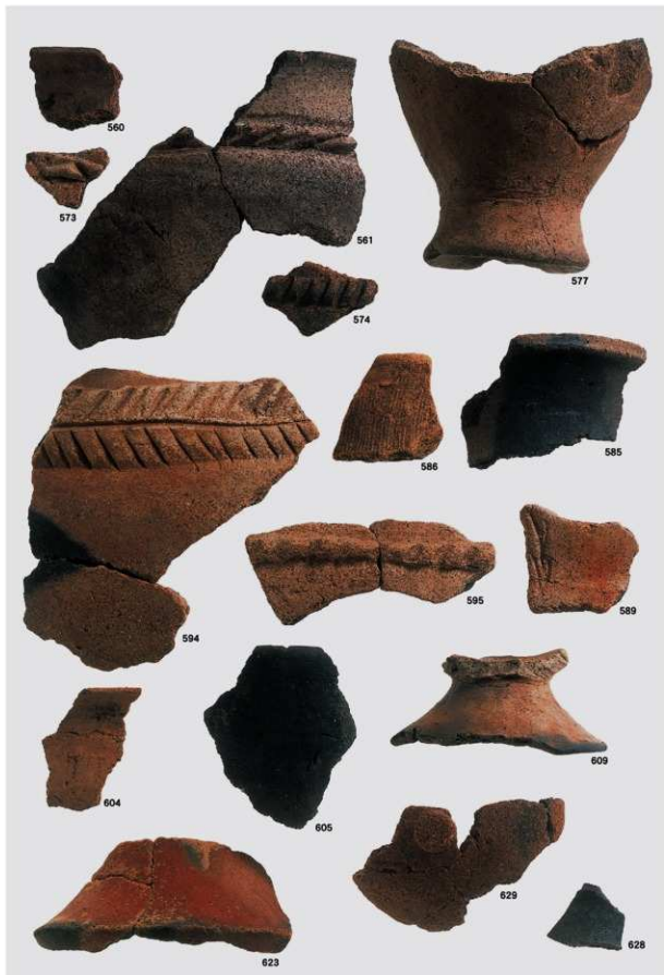
第2地点 古墳時代 包含層遺物