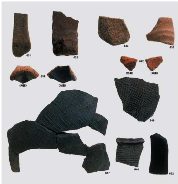
第2地点 古墳時代及び古代の遺物