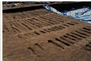
畝状遺構19 (完掘状況)