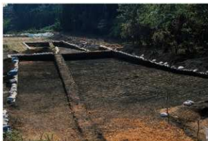
畝状遺構16（検出状況）