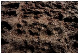
畝状遺構16（完掘状況）