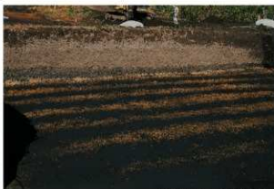
畝状遺構17（検出状況）