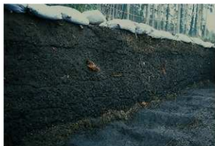
畝状遺構15 (完掘状況)