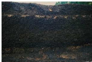
畝状遺構15 (南側断面)