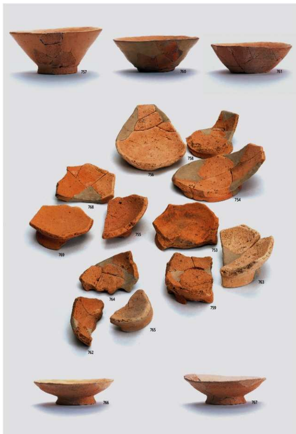
図版94 南部の土器 3 (土師器③)