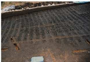
畝状遺構17（完掘状況）