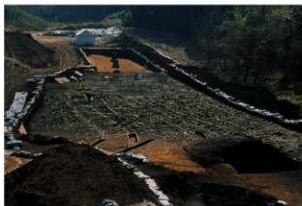
畝状遺構16（完掘状況）