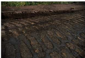
畝状遺構16（検出状況）