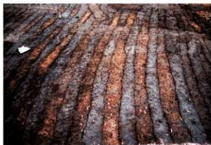
畝状遺構17（検出状況）