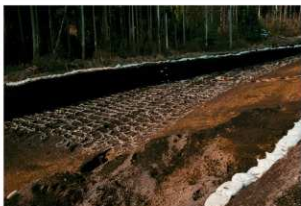
畝状遺構15 (完掘状況)