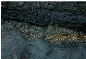
畝状遺構15 (西側断面)