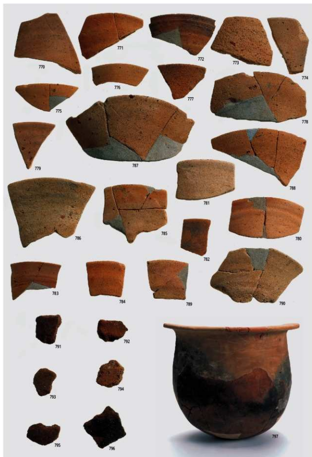
図版95 南部の土器 4 (土師器④)