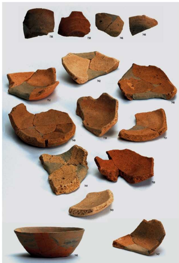
図版93 南部の土器 2 (土師器②)