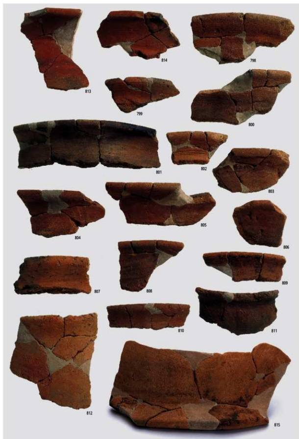
図版96 南部の土器 5 (土師器⑤)