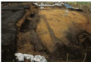
古道9, 10号 (完掘状況)