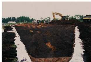
畝状遺構 4 (検出状況)