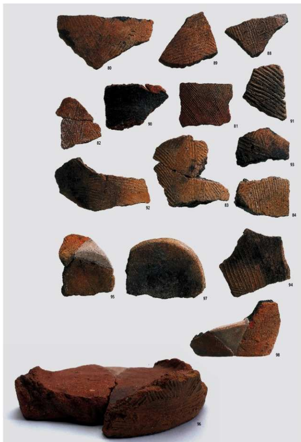
図版28 北部の土器 3 (縄文早期③)