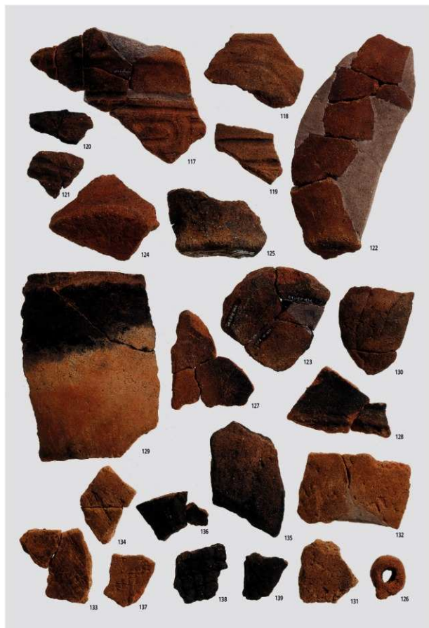
図版30 北部の土器5（縄文後期，縄文晩期）