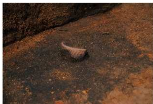
縄文土器出土状況 (Ⅶ層)