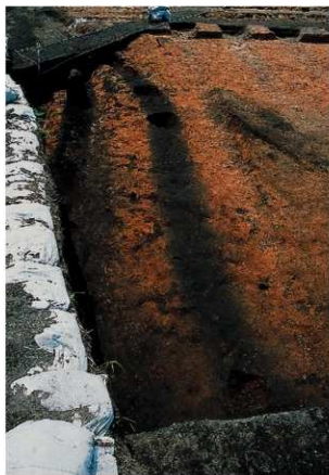
古道 2, 4, 6