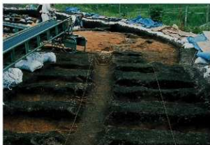
溝状遺構12 (完掘状況)