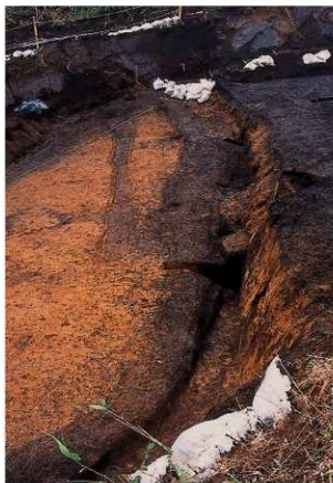
古道9, 10号 溝状遺構11