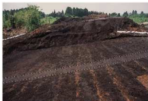
畝状遺構 3 (検出状況)