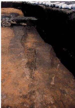
古道 3, 4