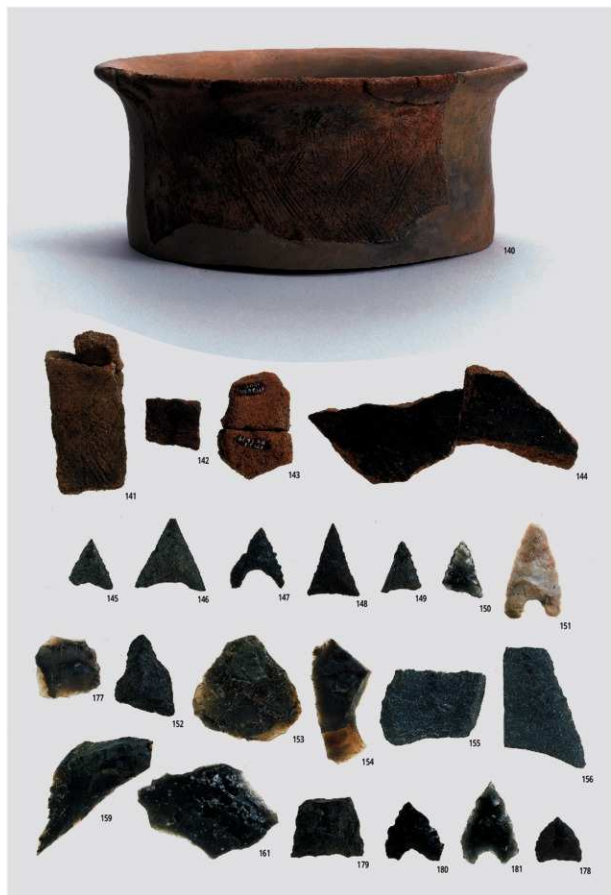
図版31 北部の土器6 (古代) 北部の石器1 (石鏃)