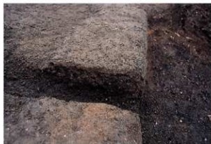
古道 4 (断面)