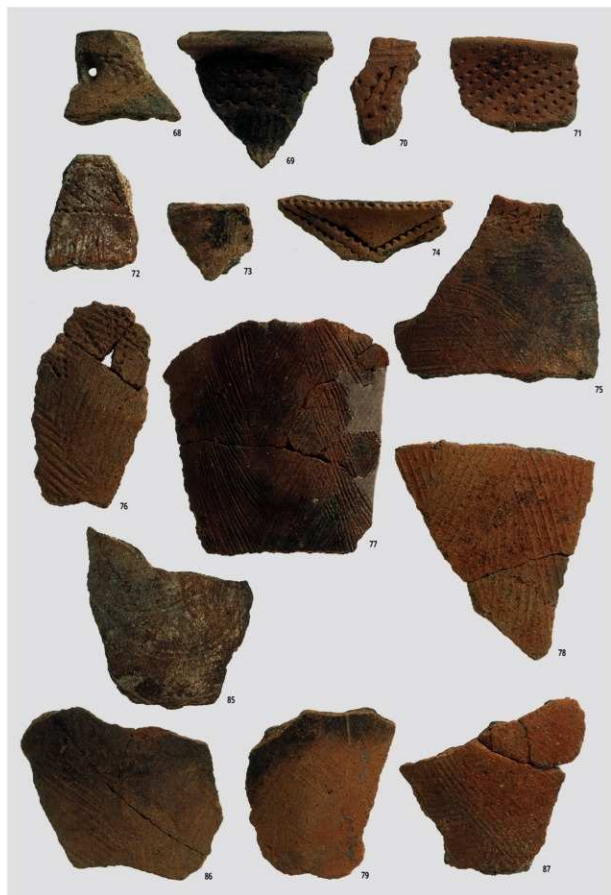
図版27 北部の土器 2 (縄文早期②)