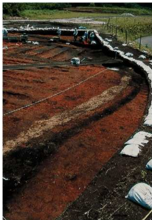
溝状遺構10, 12 (検出状況)