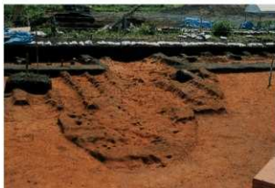
溝状遺構13 (完掘状況)