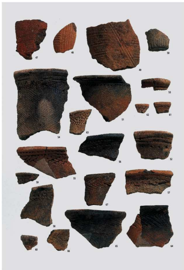
図版26 北部の土器 1 (縄文早期①)