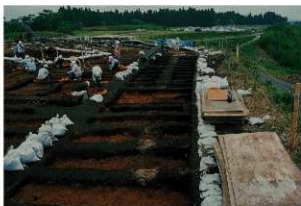
溝状遺構12 (検出状況)