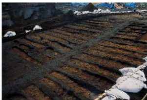
畝状遺構 3 (完掘状況)