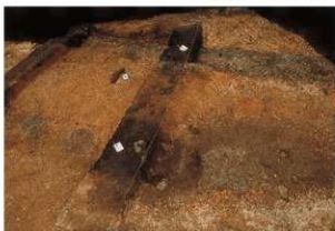
溝状遺構12 (硬化面断面)