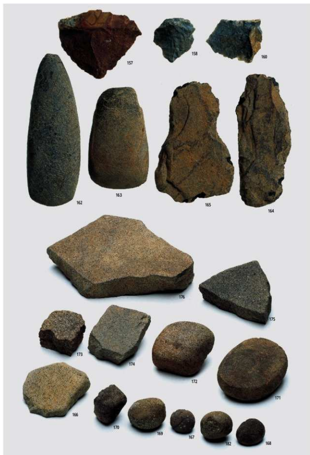
図版32 北部の石器2 (石斧, 磨石, 石皿ほか)