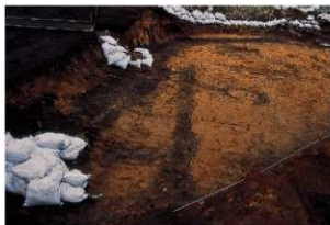
古道9, 10号 (検出状況)