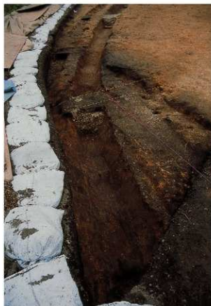
溝状遺構12 (硬化面検出)