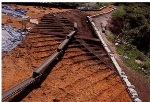
畝状遺構 4 (完掘状況)