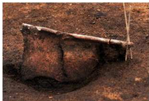
土師器出土状況 (Ⅲ b層)