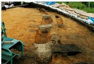
溝状遺構10, 12 (検出状況)