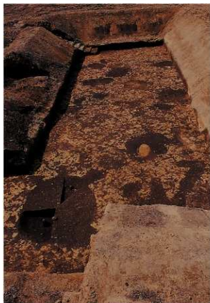
23トレンチ遺構検出状況