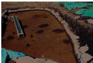
遺構検出状況（谷部北）