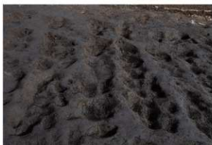
畝状遺構 2 (完掘状況)