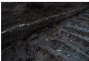
畝状遺構 2 (断面)