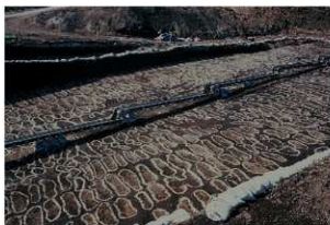
畝状遺構 2 (検出状況)