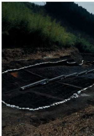
畝状遺構 2 (全景)