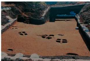
遺構検出状況（谷部北）