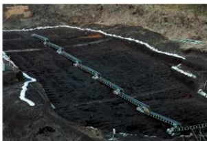
畝状遺構 2 (完掘状況)