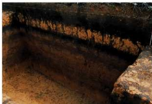
土層断面（下層確認）