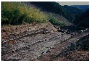
畝状遺構 2 (検出状況)