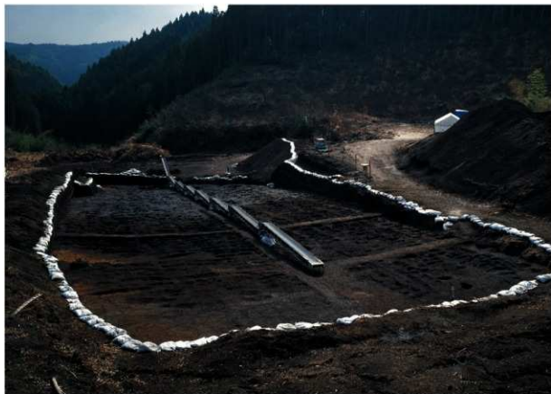
畝状遺構 2 (全景)