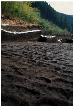
畝状遺構 2 (完掘状況)