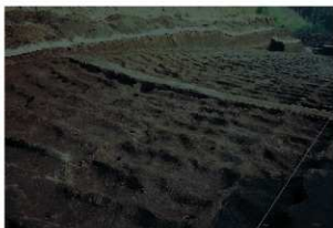
畝状遺構 2 (完掘状況)