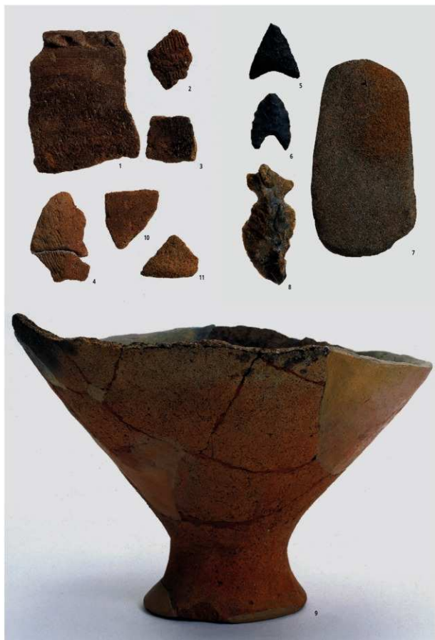
図版17 谷部の遺物1（縄文時代，古墳時代，石器）