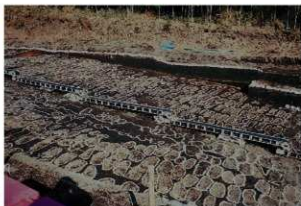
畝状遺構 2 (検出状況)