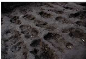
畝状遺構 2 (完掘状況)