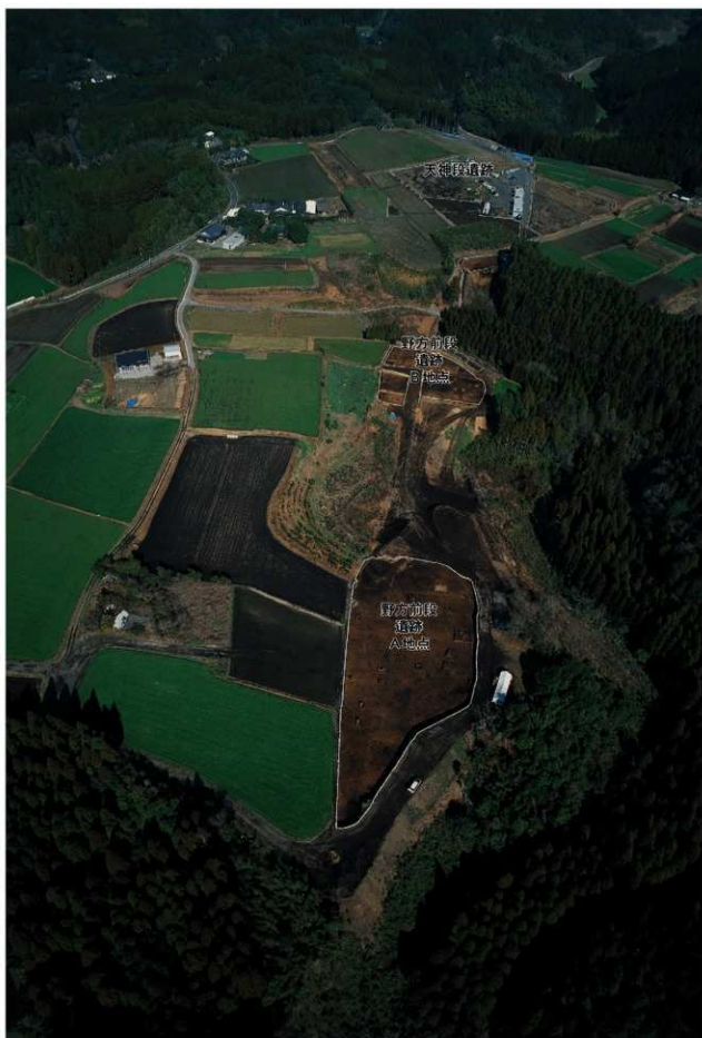
野方前段遺跡 遠景（南から）