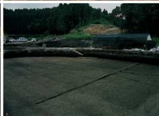
① D～F-3～5区 溝状遺構、道跡 ② 道跡（道36・37・40・41・42）北側から ③ A～C-11～14区溝状遺構、道跡検出状況南側から