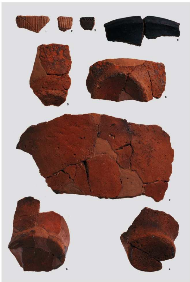
縄文時代前期・後期土器