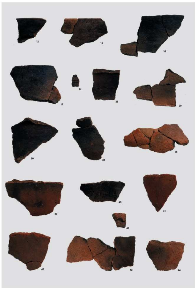
縄文時代晩期 土器 1