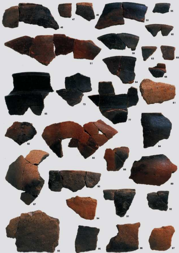
縄文時代晩期 土器 2