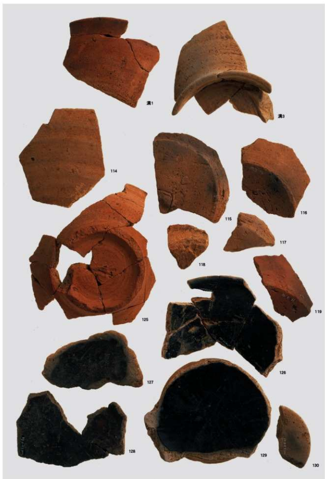
古代土師器（坏・埴・紡鐘車），内黒土師器