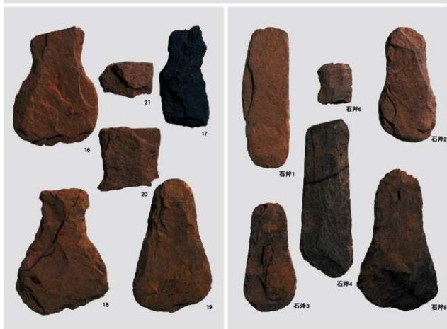
縄文時代晩期 石器