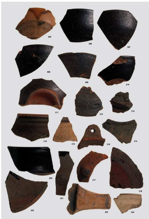
近世出土遺物（薩摩焼・土師器・肥前系陶器）