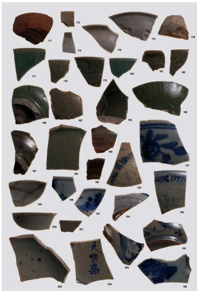
中世・近世出土遺物