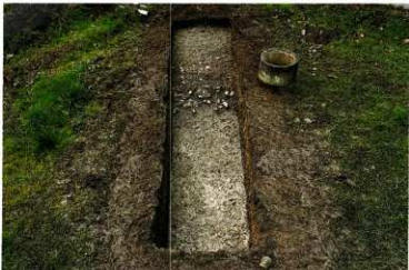
第15図 8-5調査区全景(北東から)

当調査区では、北西-南東方向に肩を持つ北東方向への落ち込みを検出した(第15図)。傾斜面には、段丘礫と考えられる青灰色系の礫層上に拳大の礫が散見できた。このような状況は、4次調査4-1調査区南端の周壕南端部検出状況に酷似する。今回検出した周壕南西隅の落ち込み状況と、4-1調査区の成果との比較から、周壕の南西隅が緩やかな弧を描いていた可能