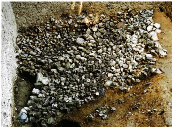
第11図 くびれ部から前方部にかけての葺石(南から)