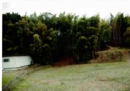
第3図 8-1調査区調査前風景（西から）

まず、最初に実施した4箇所の調査区についてみる。8-1調査区から8-3調査区の調査前は、孟宗竹に覆われているため、竹の伐採作業から取り掛かり、調査区を設定した（第3～5図）。8-4調査区は、当古墳の東に設けられた狭小な公園内にある（第6図）。先年度までの調査区との位置関係は、以下ようになる（第8図）。8-1調査区は、平成17年度実施の第6次（長岡京跡右京第859次）調査6-1調査区の北東に取り付け位置である。6-1調査区では、くびれ部裾の葺石が検出されており、その上部がどのような構造になっていたのかという手掛かりを求める