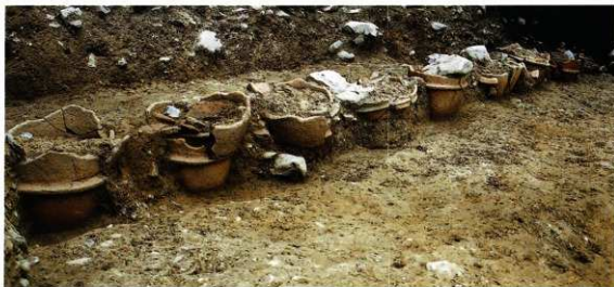
第13図 8-3調査区検出埴輪列（東から）

埴輪列は、全て第1段突帯からやや上までの残存状況であった。埴輪樹立に際し、幅約50cm、深さ約16cmの溝を掘り、各埴輪樹立に適した掘り足しや埋め戻しを行い、第1段突帯の深さまで埋め込んで、ほぼ等間隔に整然と立て並べられていた。この埴輪樹立溝内の埋土には、遺物は全く含まれていなかった。埴輪内の土層は、底から約10cm前後埋め戻して安定させていた。この層には、埴輪片などの遺物は全く含まれていなかった。これより上の堆積は、各埴輪の上部が壊れていく過程で自然に堆積したものと考えられる。この堆積層には基本的に各埴輪の上部破片が落ち込んでいるものが多かったが、中には、別個体埴輪の底部片が入り込んでいるものもあった。また、拳大以上の礫が落ち込み、その石が内側から強い力で押したため、部分的に割れて外に押し出されているものや、上から礫が被さり、上部を破壊しているものなどもあった。樹立埴輪の外周調整には、タテハケ調整で仕上げたものが1個体あるほか、他は全てタテハケ後にヨコハケ調整する手法のものであった。今回検出した埴輪列の範囲内では、樹立に際して、透かし孔の方向に配置法則は認められなかった。また、調査区西半部に残存する古墳盛土内からは、弥生時代後期の土器の小片が僅かながら出土した。