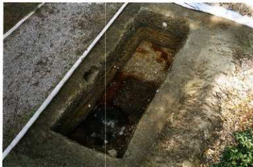
第14図 8-4調査区全景(東から)

当調査区では、他に、落ち込みの肩付近から傾斜部にかけての位置で、直径約1.7mの円形土坑S K 12を検出した。埋土は上層の薄い砂礫と、下層の厚い黒色粘土に分けられ、下層から弥生時代後期の土器が出土した。