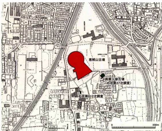
第2図 惠解山古墳の位置 (1/5000)

当古墳は、昭和55(1980)年に鉄製品埋納施設が見つかり、昭和56(1981)年に、国の史跡に登録された。