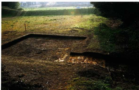
第16図 8-6調査区全景(北西から)

当調査区は、第7次調査7-5調査区同様に、広い範囲にわたって平安時代の砂礫層堆積を再確認した(第16図)。この砂礫堆積は、洪水時などの流水堆積と考えられ、周壕西辺のあたりに固有な土層堆積である。また、周壕西辺のあり方も、大阪層群と考えられる黄色から白色系粘土層が基盤層になっており、7-5調査区の基盤層と変わらない。西から緩やかに傾斜して周壕となる傾斜面には、葺石崩落石のような礫群は見られなかった。このあり方も、前方向側の周壕南辺に見られる状況と、甚だしく異なる。この調査区での新たな課題として、7-5調査区や5-1調査区より西の状況把握を試みた。しかし、当調査区西端部には、現代の池による掘削深度が深く、大きく削平されていた。池の東辺には杭と矢板による護岸用土留めが構築されていた。このように、周壕の西肩検出位置より西側の状況は捉えきれなかった。前方向側の周壕南辺に見られた礫の散乱状況がここで見られないのは、長岡京期や平安時代の砂礫堆積に起因する流水により、完全に損失してしまったのか、あるいは、本来の周壕西肩がさらに西にまで広がるのか、または南辺で見られる礫の散乱状況が人工的なものでなく、段丘礫からの崩落であるのか、今回の調査でも結論付けることができなかった。当調査区出土遺物には、平安時代前後の土器以外に、砂礫層を掘り込む土層に鎌倉時代の土器類が包含されていたほか、各層から埴輪の細片が出土した。