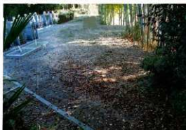
第4図 8-2調査区調査前風景（北から）