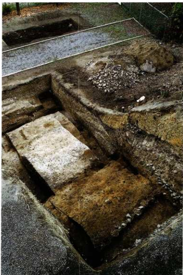
第12図 8-3調査区全景(西から)

埴輪列を検出した第2段テラス面より東は、近世以後の削平が周壕底の推定標高まで及んでおり、段丘礫と考えられる青灰色系の礫層を、耕作土と考えられる黄褐色系のシルト層が覆っていた。この層からは、鞍形埴輪などが出土した。その上には、古墳盛土起源と考えられる硬く