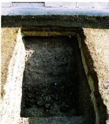
第17図 8-7調査区全景(西から)