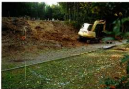
第6図 8-4調査区調査前風景（東から）