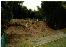
第5図 8-3調査区調査前風景（東から）