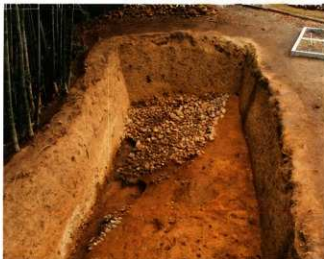
第10図 8-2調査区全景(南から)

今回、第3傾斜面葺石基底石の位置を検出できたことは、第5次調査検出の第2段テラス面に樹立していた埴輪列とともに、前方部西側の中間段復元に、大いに寄与する貴重な成果といえる。