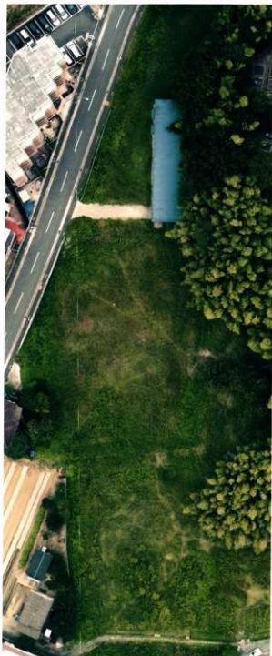
第7図 8-5・6・7調査区調査前風景（垂直）

このように、今回の調査は、8-1～7調査区の7箇所に調査区を設け、それぞれの調査区毎に重要な目的を持って実施した。