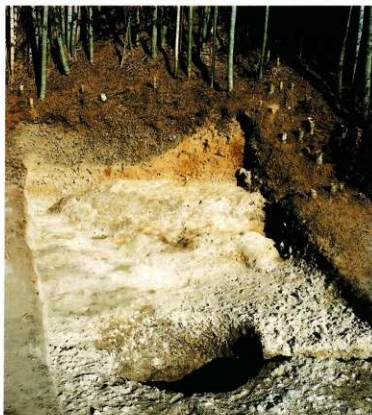
第9図 8-1調査区全景(西から)

古墳に関係する遺物には、埴輪片と竪穴式石室に用いられたと考えられる結晶片岩破片がある。埴輪の破片は各層から出土したが、大きな破片は、主に調査区北西の窪みに埋め立てられた礫層と、調査区南東部の竹藪客土からの出土が多い。埴輪には、円筒の他、蓋形などの形象埴輪も含まれている。また、窪みを埋め尽くした礫や竹藪客土から出土した礫は、本来当古墳の葺石に用いられていたものも多いと思われる。