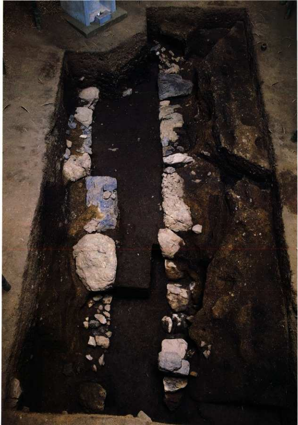
図11 横穴式石室全景(南西から)