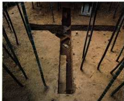
図9 後円部墳頂トレンチ(第2次調査、南から)

石室の裏込めには主に粘質土を使用する。しまりが良く、粘性があり、大きな礫を含まない黄褐色系と茶褐色系の土を細かい単位で交互に積んでいる。