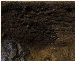
図10 攪乱坑のライン(後円部墳頂トレンチ東区)