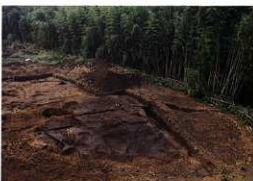
図4 小西1号墳(稲荷塚古墳北側、南東から)