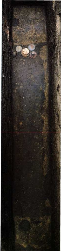
図13 木棺直葬全景(上が東側)

この主体部は上述の段階で掘り下げを中止し埋め戻した。これが墳頂中央部からかなり東に偏在することから他にも複数の主体部が存在する可能性が高く、その確認作業も今後に残された課題である。