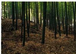
図3 墳丘の現状(前方部東コーナー側から)

第2次調査の成果をふまえ、後円部に存在する横穴式石室の残存状況および規模、構造、構築時期を明らかにすること、さらに他の埋葬施設の有無を確認することを目的として第3次調査を実施した。調査主体は長岡京市教育委員会、期間は1995年7月21日から8月18日までの