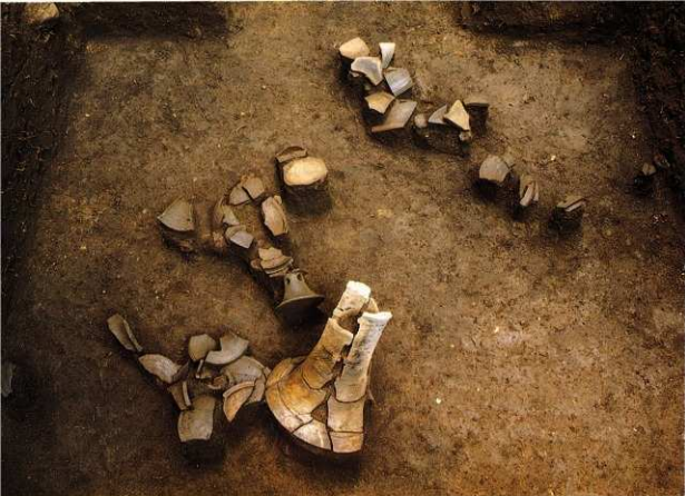
図14 クビレ部墳頂トレンチ須恵器出土状況(北から)