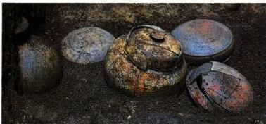
図15 前方部木棺に 副葬された須恵器