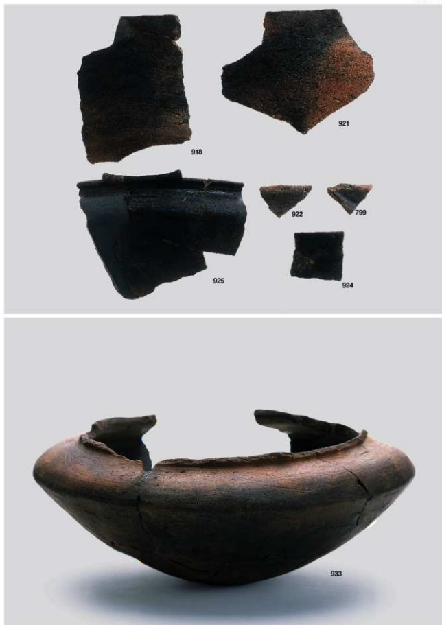
縄文時代晩期土坑内出土遺物 5 (799 のみ落とし穴内出土遺物)