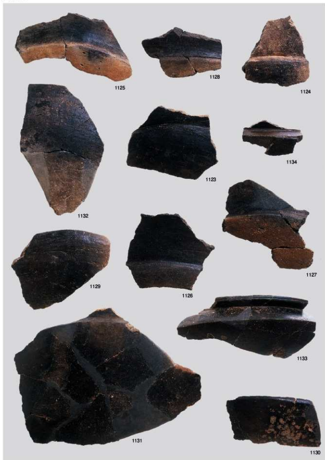
縄文時代晩期土器 13 (浅鉢 2b 類③, 3 類)