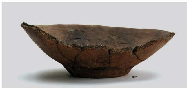
縄文時代晩期土器 2 (深鉢 2a 類 2)