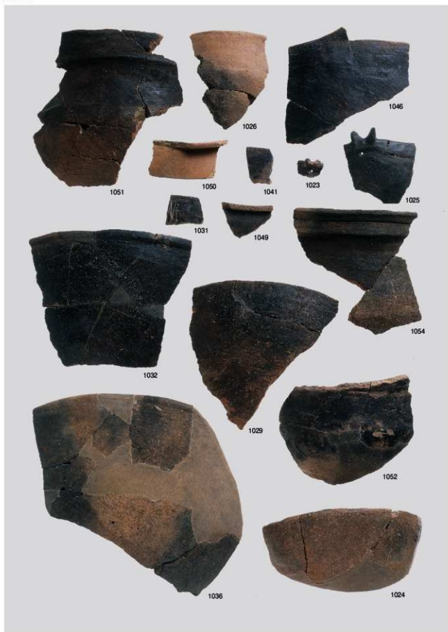
縄文時代晩期土器 7 (鉢形①)