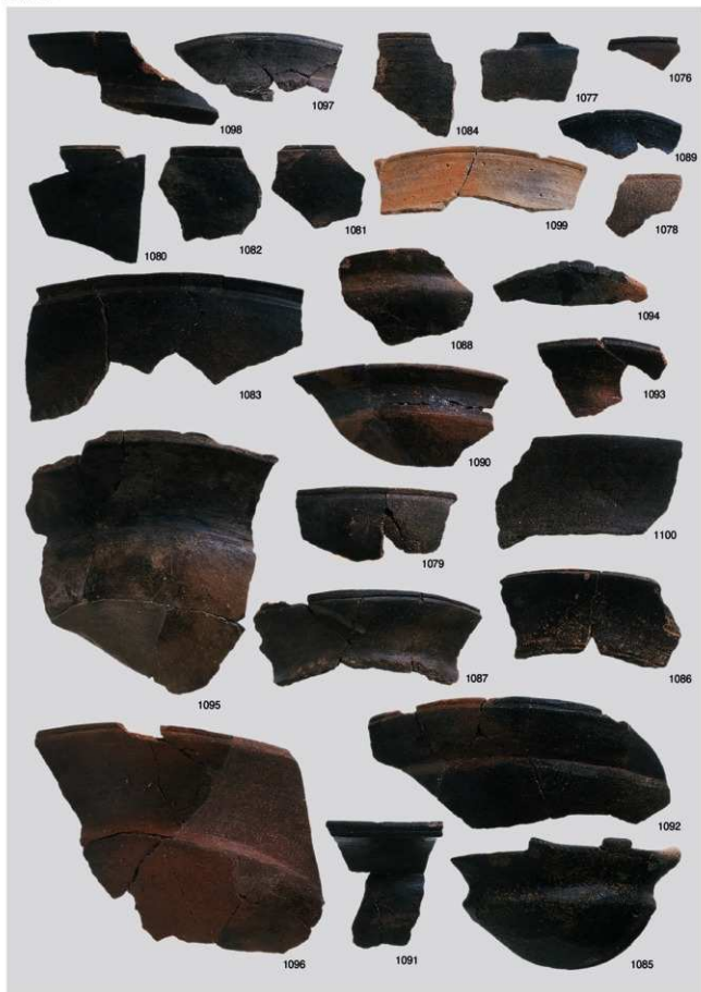
縄文時代晩期土器 11 (浅鉢 2a 類, 2b 類①)