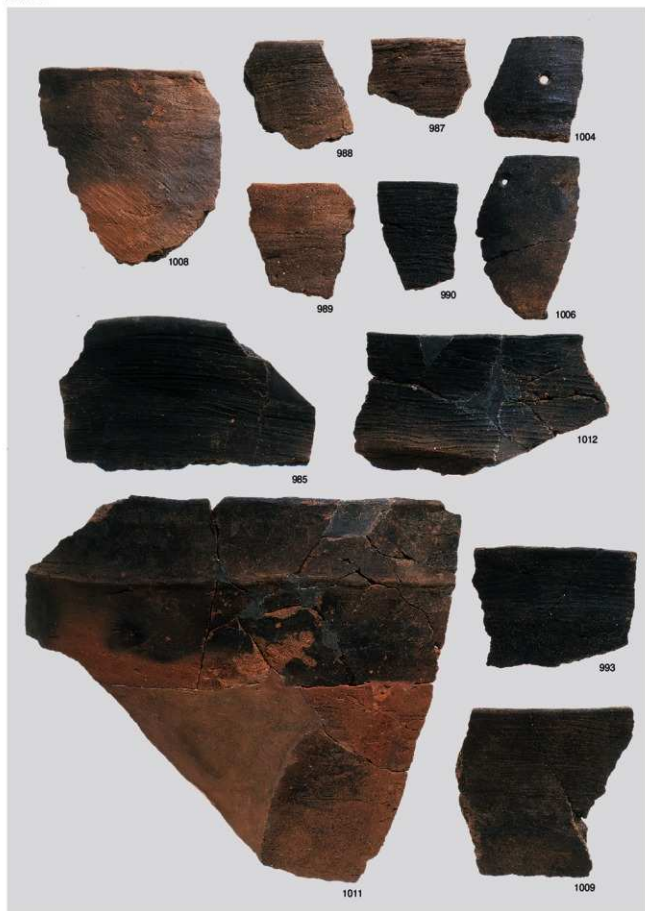
縄文時代晩期土器 5 (深鉢 3a 類③, 3b 類①)