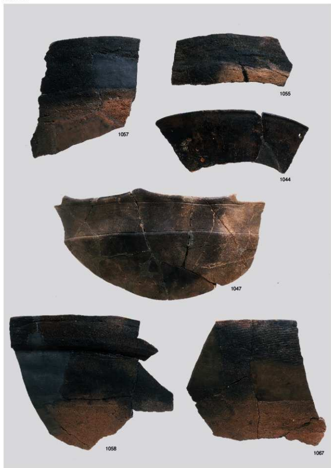
縄文時代晚期土器9 (鉢形③, 粗製浅鉢①)