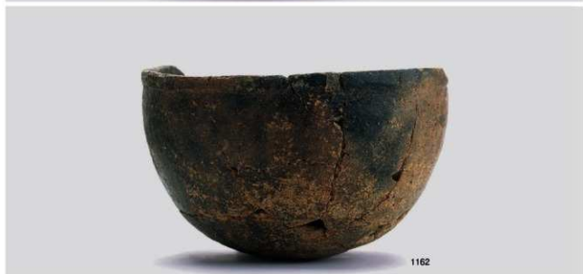
縄文時代晩期土器 8 (鉢形②, 浅鉢 3b 類①, マリ形①)