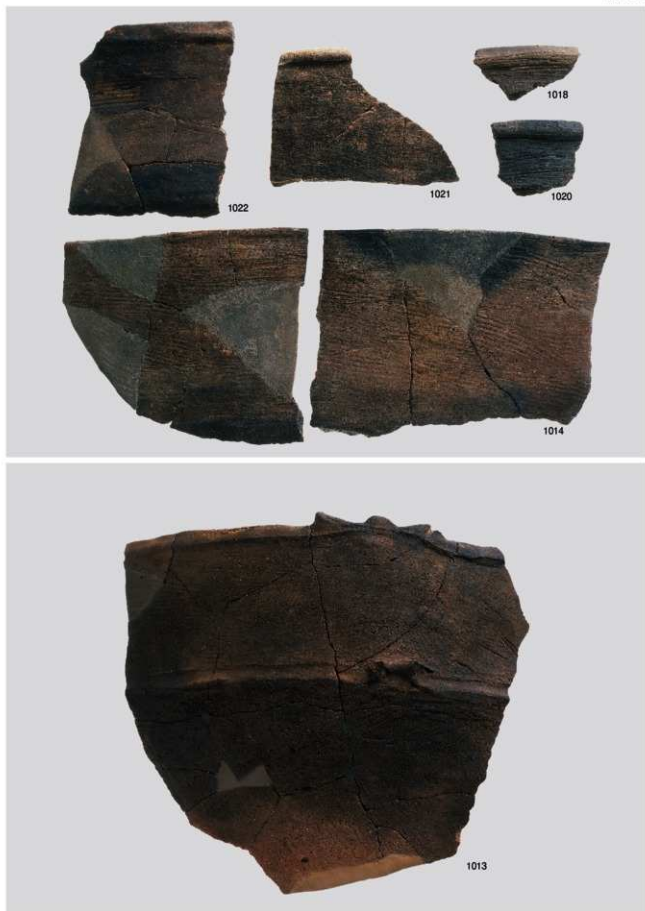
縄文時代晩期土器 6 (深鉢 3b 類②, 3c 類)