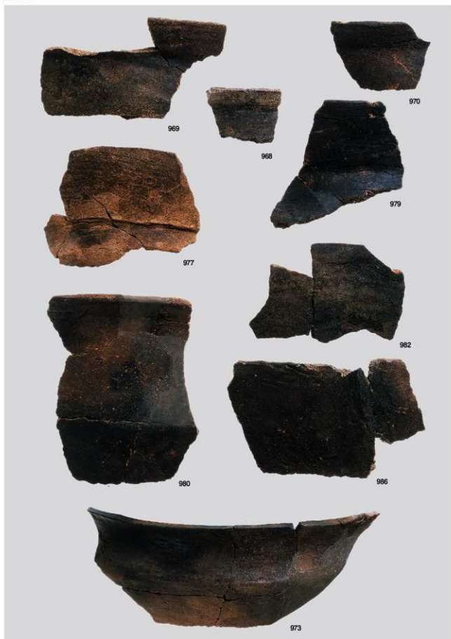
縄文時代晩期土器 3 (深鉢 2a 類③, 2b 類, 3a 類①)