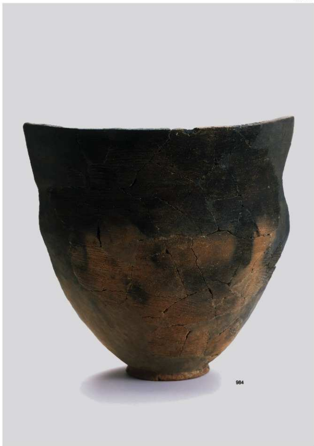
縄文時代晩期土器 4 (深鉢 3 a 類 ②)