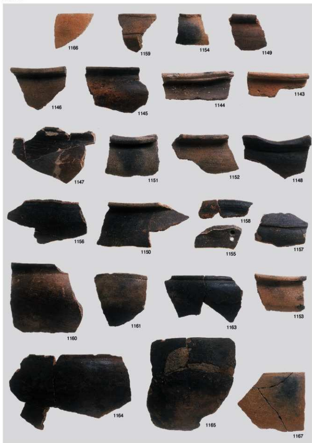
縄文時代晩期土器 14 (浅鉢 3b 類③, マリ形②)