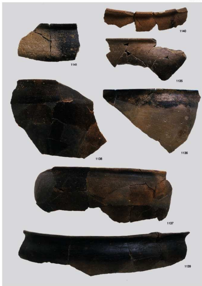
縄文時代晩期土器 14 (浅鉢3b類②)