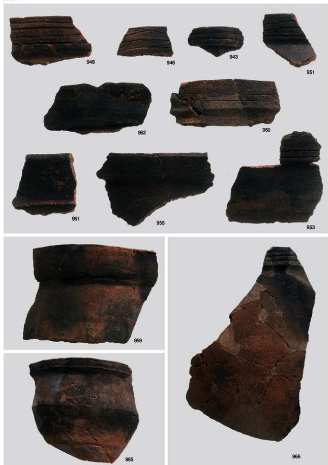
縄文時代晩期土器 1 (深鉢 2a 類①)