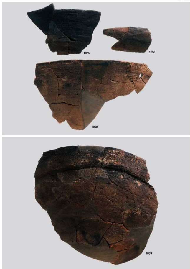
縄文時代晚期土器 10 (粗製浅鉢②)