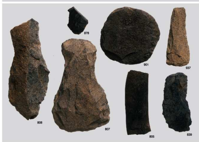
縄文時代晚期土坑内出土遺物 7