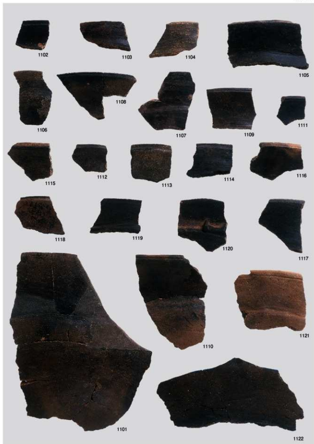
縄文時代晩期土器 12 (浅鉢2b類②)