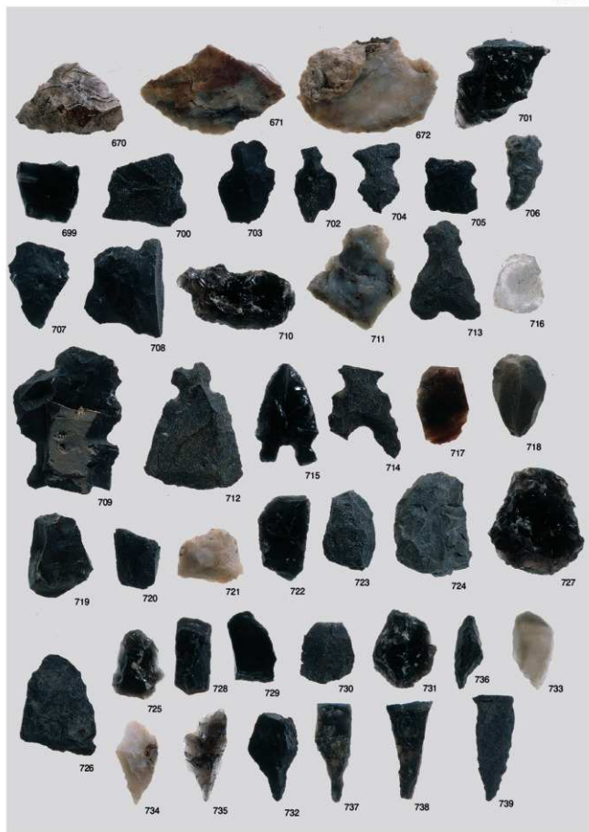
V層出土石器 7 (削器②、抉入石器、楔形石器、石錐)