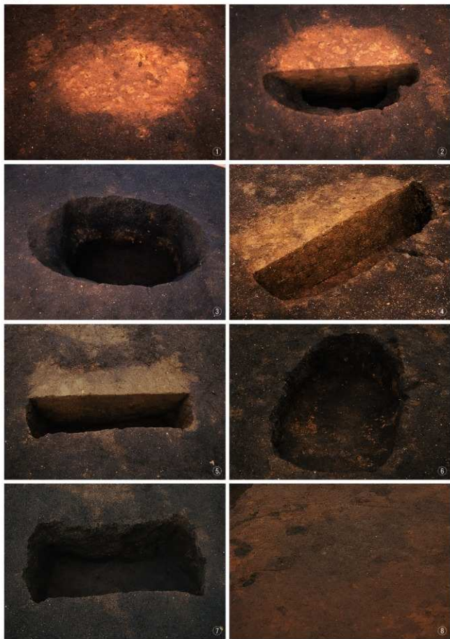
①～③晩期5号落とし穴（検出・半掘・完掘） ⑤・⑦晩期8号落とし穴（半掘・完掘）