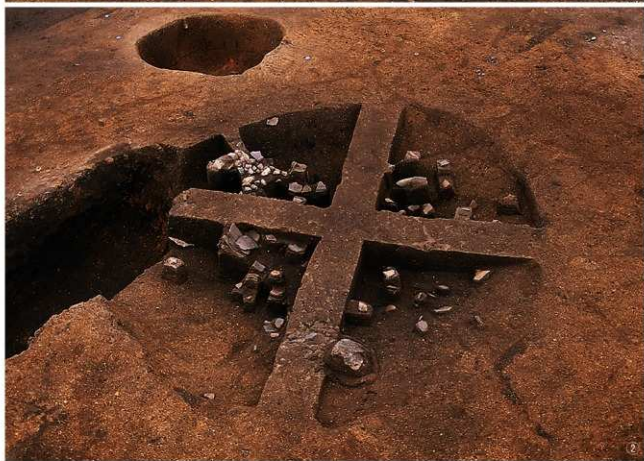
①・②晩期竪穴住居跡（検出・遺物出土状況）