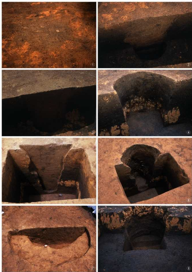
①・②晩期 12号落とし穴 (検出・半掘) ③・④晩期 13号落とし穴 (半掘・完掘) ⑤・⑥晩期 14号落とし穴 (半掘・完掘) ⑦・⑧晩期 16号落とし穴 (半掘・完掘)