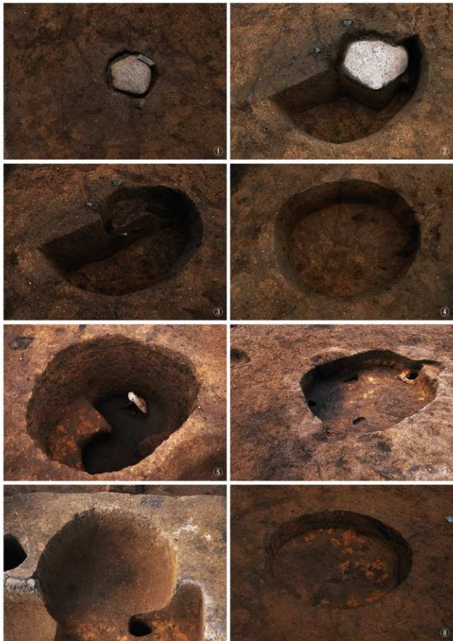
①~④晚期3号土坑 (檢出・半掘 (石皿有)・半掘 (石皿無)・完掘) ⑤晚期4号土坑完掘 ⑥晚期5号土坑完掘 ⑦晚期13号土坑完掘 ⑧晚期14号土坑完掘