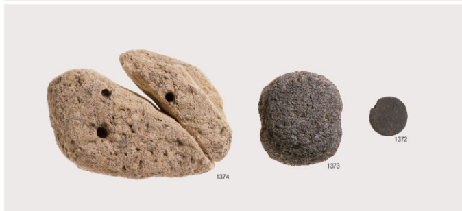
石槍・石匙・削器・搔器・楔形石器・異形石器・その他