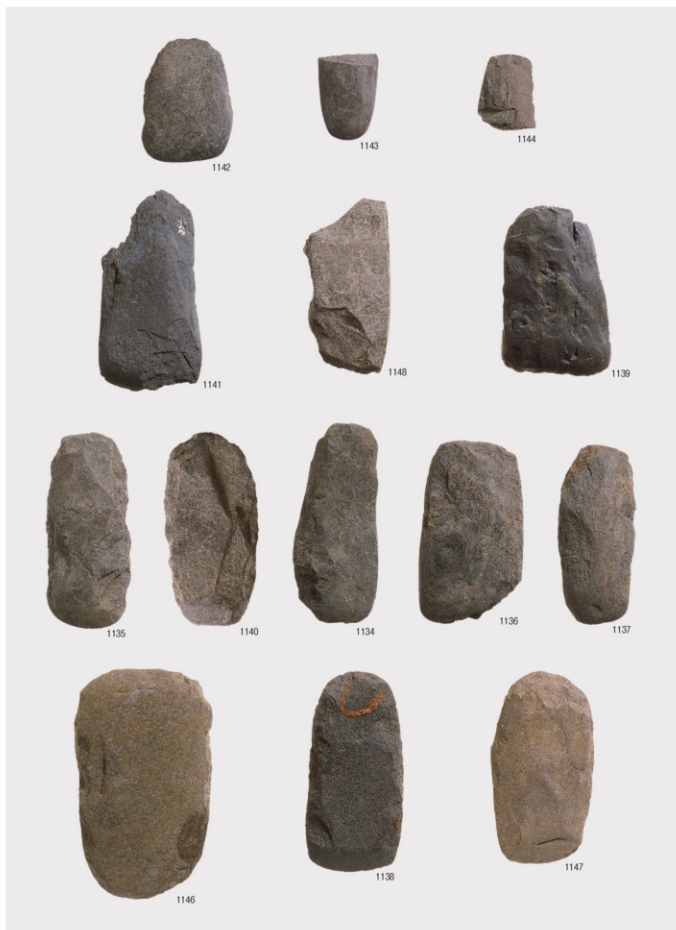
磨製石斧・局部磨製石斧・石斧未製品