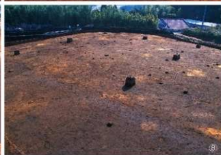
① 磨製石斧出土状況 (484) ② 集石 64 号周辺の遺物出土状況 ③ 磨石・石皿出土状況 (419・445) ④ 集石 61・62 号周辺の遺物出土状況 ⑤ G-44～46 区 V 層遺物出土状況 ⑥ 集石 65・66 号周辺の遺物出土 状況 ⑦ G～I-36～40 区 V 層遺物出土状況 ⑧ G～J-40～43 区 V 層遺物出土状況