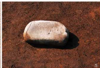
① H・I-23～26区 V層遺物出土状況と地割れの様子（東から） ② H-28～30区 VI層上面完掘状況（西から） ③ D・E-20～22区 V層遺物出土状況（東から） ④ 石鏃出土状況（504） ⑤ 石皿出土状況（518）