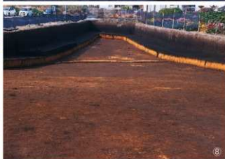
① H-41区 VI層土器出土状況 (102) ② G・H-36～38区 V層遺物出土状況 ③ H・I-36～38区 集石70・71号周辺の遺物出土状況 ④ J～L-39・40区 VI層上面完掘状況 ⑤ K・L-39区 VI～X層の土層断面 (西から) ⑥ I-34区 VI層遺物出土状況 ⑦ K・L-33・34区 集石73号周辺の遺物出土状況 ⑧ D・E-30～34区 VI層上面完掘状況