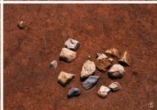
① 土器埋設遺構 ② 集石1号 ③ 集石2号 ④ 集石3号 ⑤ 集石4号