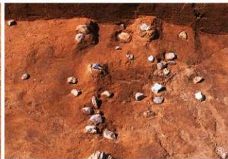
① 集石5号 ② 集石6号 ③ 集石7号 ④ 集石8号 ⑤ 集石9号 ⑥ 集石10号 ⑦ 集石11号 ⑧ 集石12号