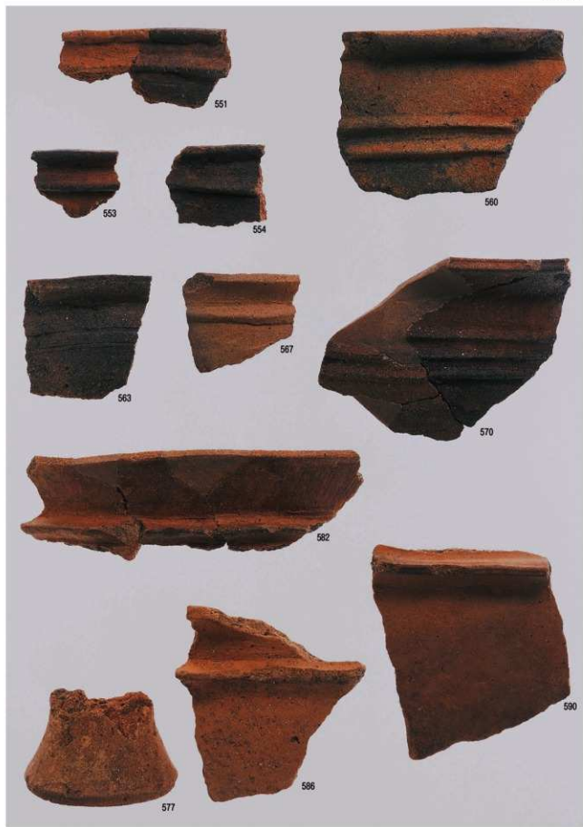
弥生時代の遺物3（包含層）