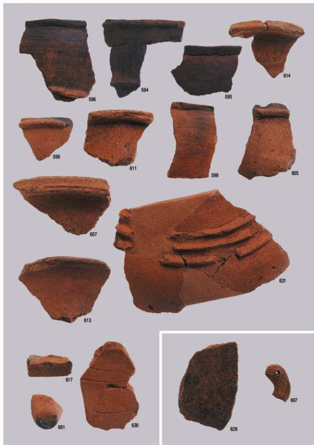
弥生時代の遺物4 (包含層)