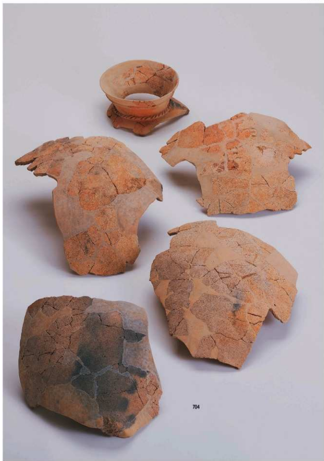
古墳時代の遺物 1 (遺構)