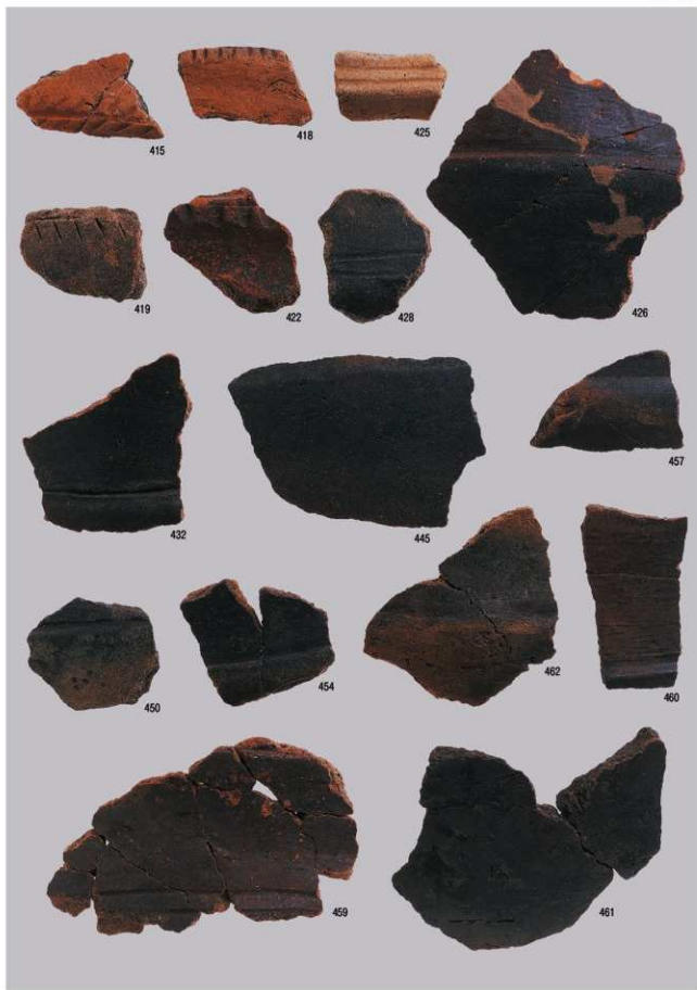
縄文時代の遺物 13 (後期・包含層)