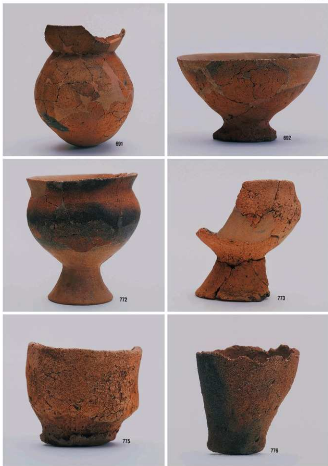
古墳時代の遺物3 (遺構・包含層)