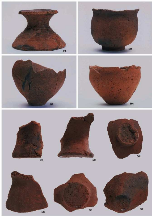
弥生時代の遺物2 (遺構)