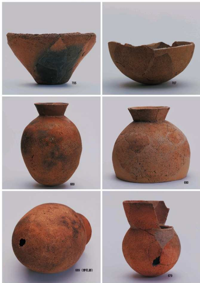
古墳時代の遺物2 (遺構)