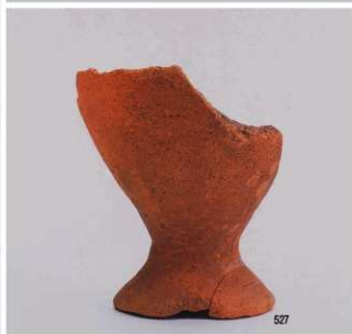
弥生時代の遺物 1 (遺構)