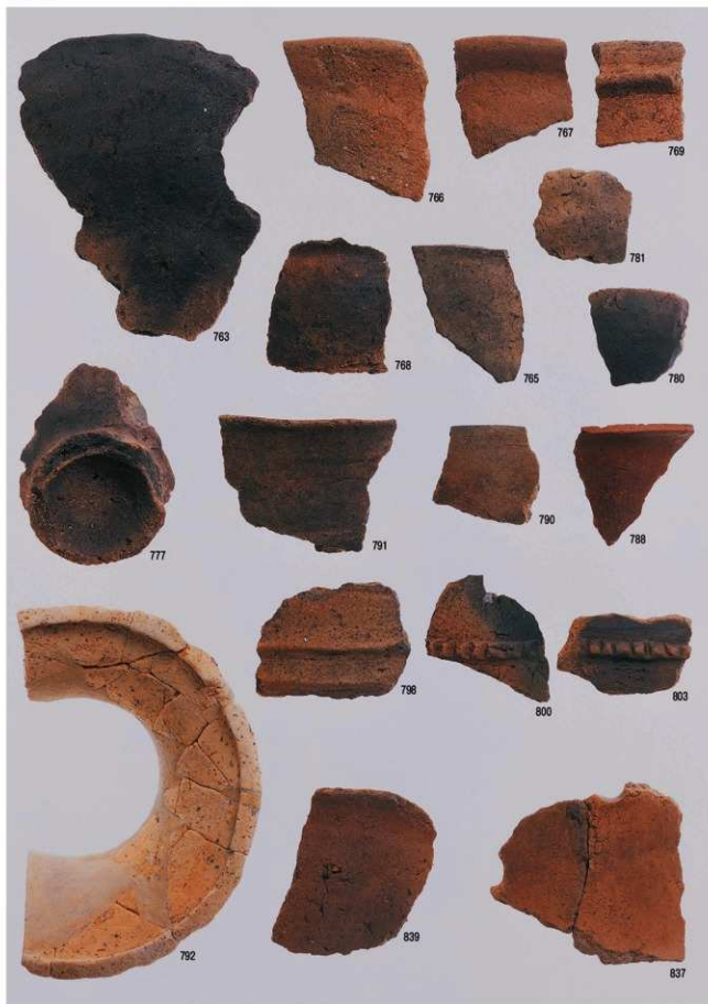
古墳時代の遺物6 (包含層)