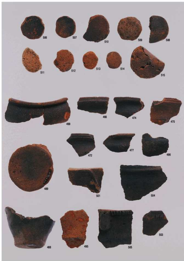
縄文時代の遺物 14 (後・晩期・包含層)