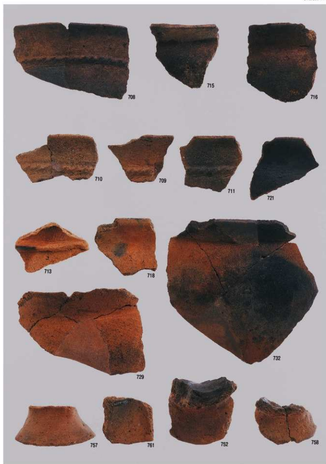
古墳時代の遺物 5 (包含層)