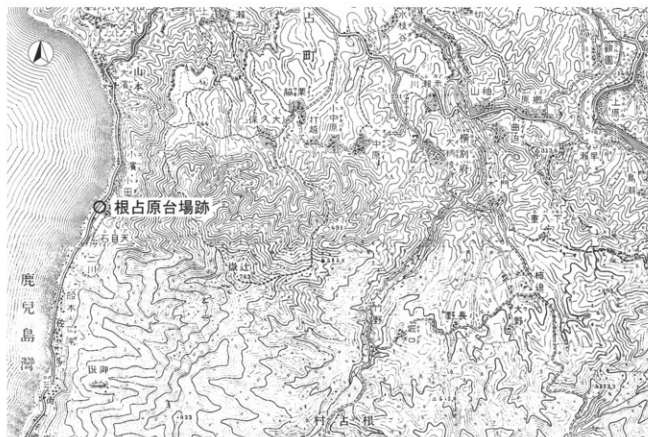
第48図 明治35年根占原台場跡周辺地形図(1:50,000)(地理調査所1:50,000地形図『大根占』『邊塚』改変)