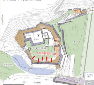
天守曲輪周辺図（安政元年浜松城修築図）