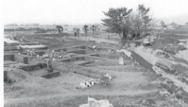
発掘のようす(小無田鶴田遺跡・は場整備)

さまざまな開発の増加に伴い、開発と文化財保護との関係は国民的課題の一つとなっていますが、文化財を大切にするため、開発する人たちの理解と協力を得ながら、その保存に努めています。しかし、やむを得ず開発によって文化財が破壊される場合は、事前に記録を残すための発掘調査をおこなうようにしています。