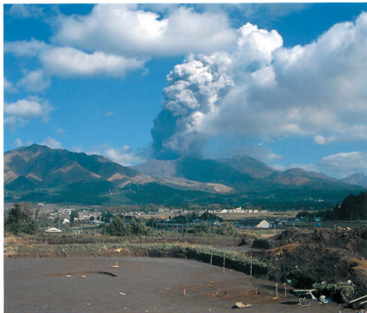
小無田鶴Ⅱ遺跡より阿蘇山を望む