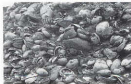
すてられた貝のようす(黒橋貝塚・河川改修)