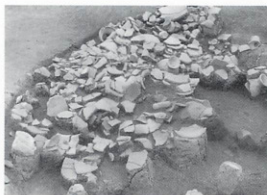
弥生時代のすてられた土器のようす(夏女遺跡)

遺跡は同じ時代のものでそれぞれ異なっていて個性をもっています。発掘調査をして初めてその性格がわかるものです。開発事業の際に発掘調査するのはそのためで、調査すれば何か新しい事実が見つかるのも埋蔵文化財の特色です。