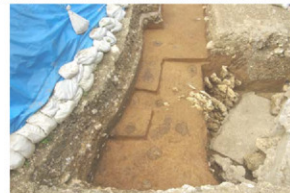
ビット群検出状況（南から）

今年度調査区の南側は、かつて継世門に続く平場や通路などがあったとされる場所です。しかし発掘調査の結果、戦後の大学建設に伴う工事で地山まで削平されており、一部にはコンクリート建物の基礎も残っていました。一帯の地山面を精査すると、グスク時代と考えられるビットが約30基検出されました。中には柱を建てたような跡がみられるものも複数確認されていることから、この場所が首里城として整備される以前に、何らかの建物があったと想定されます。