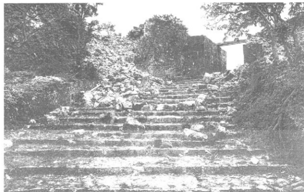
沖縄戦で崩れた美福門の城壁と階段（1945年6月18日撮影）