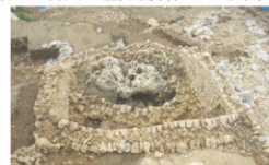
拝所遺構検出状況（北から）

直径3～4m、高さ約2mの巨岩を石積みで囲んだ遺構で、城内十楯のひとつ「赤田御門の御楯」と考えられます。この巨岩上面にある2ヶ所のくぼみから、県内でも類例の少ない金製の厭勝銭（えんしょうせん）が人為的に埋められた状態で合計12枚出土しました。巨岩は御楯の「イビ（神が降臨する際の標識）」に相当する可能性が高いことから、今回の発見は首里城内にある御楯の「イビ」から呪術的な遺物が出土した初めての事例であり、琉球王国時代の首里城内における祭祀の様相を窺う上でも非常に重要な資料といえます。