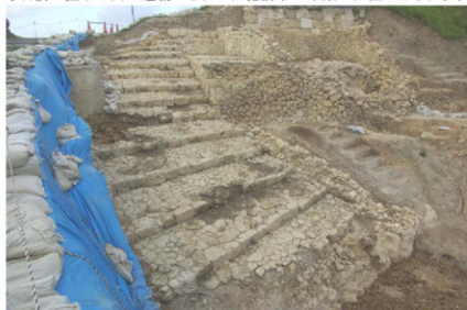
美福門前礎道検出状況（南西から）

美福門から南に延びるスロープ状の石階段で、幅が広く緩やかに傾斜する路面と、低い蹴上げという独特の形態を持っています。美福門の基壇から数えて14段確認されましたが、15段以降は戦後の造成により破壊されているため、残念ながら全体の様相は不明です。今回検出したのは礎道の東側部分で、西側部分は道路の下に埋まっている可能性が高いと考えられます。年代は隣接する石積み直下の出土遺物から、15世紀前半～中葉に位置づけられます。