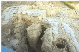
土留め石積み検出状況（西から）

美福門城壁及び礎道（とうどう）の下層から検出された遺構で、粗く加工された大型の石材を用いています。調査区一帯が北から南へ傾斜する場所にあるため、この石積みは美福門城壁を構築する前の基礎工事で積み上げられたものと考えられます。年代は出土遺物から15世紀前半～中葉に位置づけられます。