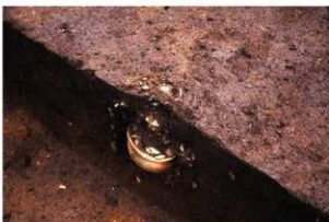
同左 (内外に砂礫充填)