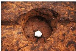
底面に礫を入られた土坑 (RD49)