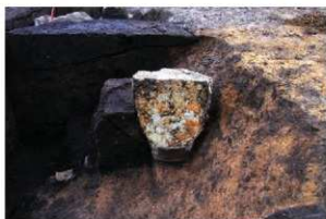
粘土を充填された埋設土器 (RZ07)