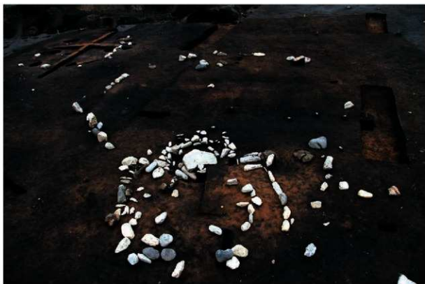
配石・敷土を伴う柄鏡形住居状遺構 (RA13)