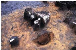
RZ03 埋設土器に添え置かれた大形礫