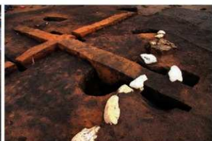
同上 (柱設置→柱撤去→配石・敷土→焼土生成)