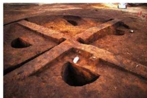
敷土を伴う方形柱穴列 (RB03)