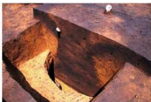
開口部付近を黄褐色土で埋められた土坑 (RD12)