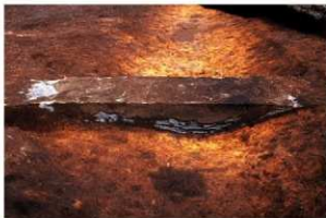
RG04 溝跡に堆積した刈壁スコリア