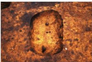
同左 (石皿・異形石器を副葬)