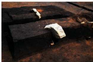
RA13 長軸北端に埋納された小形土器 (RZ12)