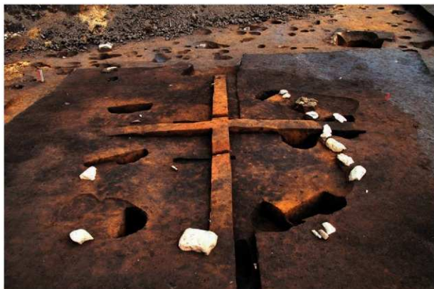
配石・敷土を伴う方形柱穴列 (RB01)