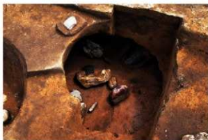
底面に礫と深鉢が入られた土坑 (RD66)