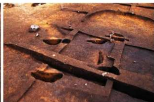
敷土を伴う方形柱穴列 (RB04)