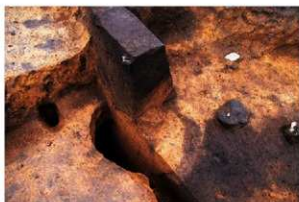
内部の大半を黄褐色土で埋められた土坑 (RD21)