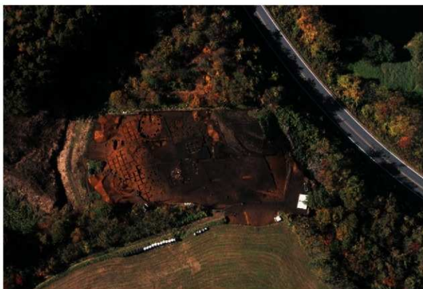
空中写真（平成21年度）