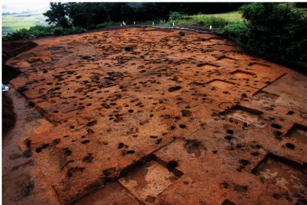
平成 23 年度調査終了全景（南西→）