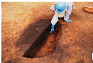
RA13 張出部下位の墓壇 (RD68)