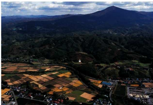
調査区透景（西から）