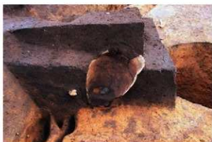
内部に礫を入られた埋設土器 (RZ04)