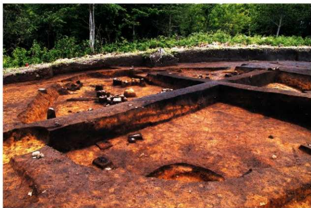
断面にみる人為的黃褐色土層 (RA12)