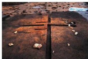
同上 (検出時の状況)