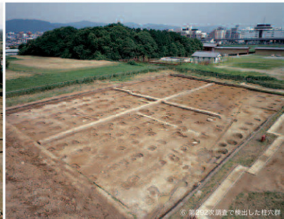
⑥ 第992次調査で検出した柱穴