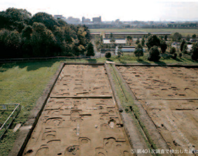
⑤ 第401次調査で検出した柱穴