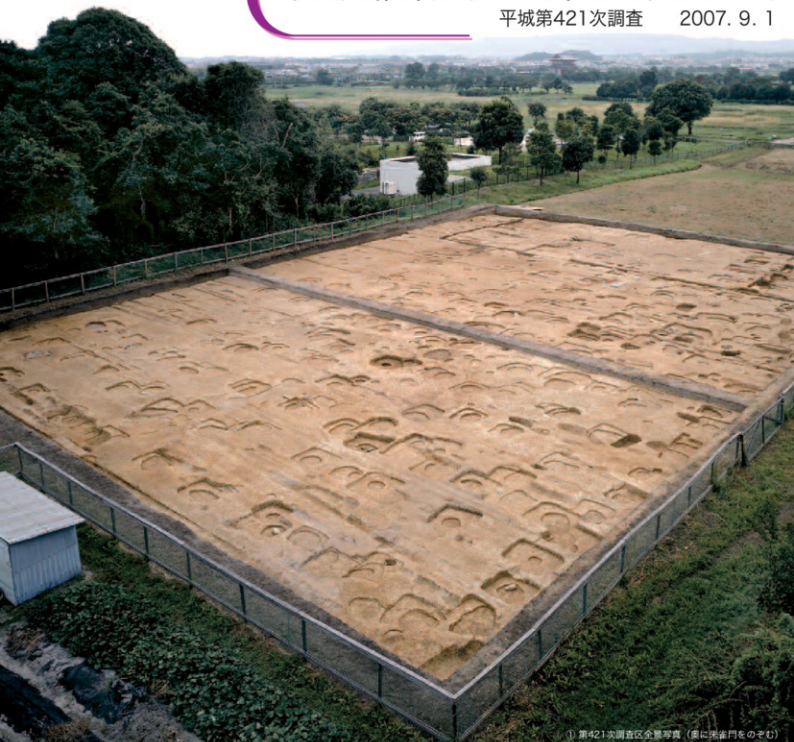
① 第421次調査区全景写真（奥に朱雀門をのぞむ）