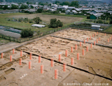
② 東院内部各回廊区調査施設（柱は推定位置）