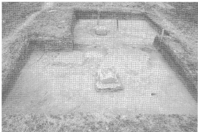
2 発掘調査完掘状況（西から）