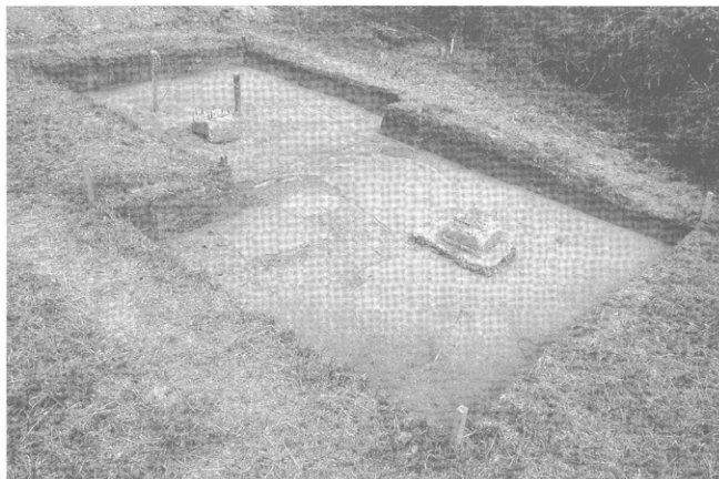
1 発掘調査完掘状況（北西から）