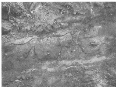
写真2 試掘坑 No. 5