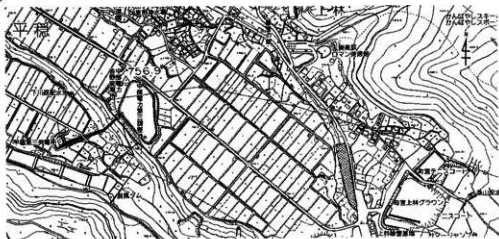
第1図 調査地の位置 (1:10,000)

また沓野の台地面には、火山灰に覆われ生成されたローム層は存在せず、砂礫の多い地山層を形成している。しかし今回の試掘地の内、道路にそった傾斜地にはローム層の存在する可能性がある。