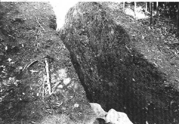
土器断面 (東側より)