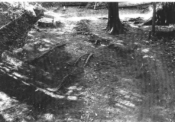
2トレンチ全景 (東側より)