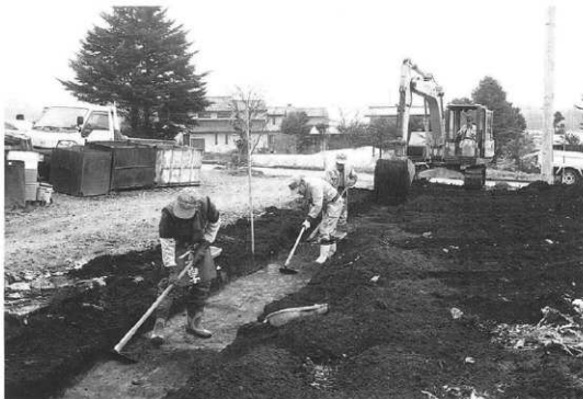
写真2 調査風景（駐車場予定地）

この辺りには、当地方特有の東西に細長く伸びる大小様々の尾根がみられ、それらの尾根上から南斜面に表1と第2図に示したように、縄文時代中期を中心とした遺跡が密集する地帯である。その一つである本遺跡は、八ヶ岳から流下する阿久川と大早川によって南と北を浸蝕された東西に細長い尾根上から南斜面に立地している。尾根上の平坦面は80mほどで、南の阿久川側はなだらかであるが、北の大早川側は急激な斜面となる。地目は地下水が低いこともあり普通畑と墓地で、近年は前述のように宅地化が進んでいる。調査地点は普通畑と工場用地（駐車場）で、標高は965m前後を測る。