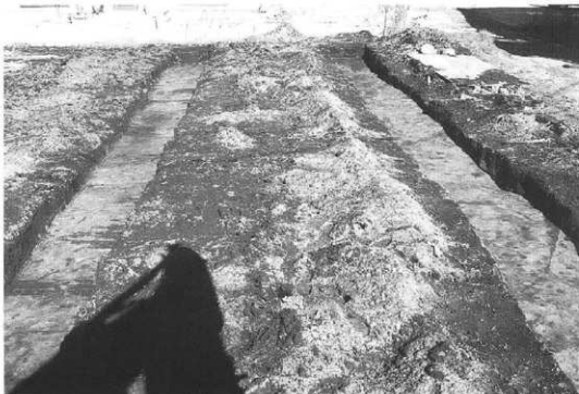
写真3 調査トレンチ（駐車場予定地）

前述したように地理的条件に恵まれているうえに、道路整備が進んだこともあり、第3次（昭和63年度）は住宅団地造成に先立つ調査で、宅地化が進むきっかけとなるが、縄文時代中期中葉の住居址6軒（内3軒は完掘、埋没保存2軒は部分調査・1軒は確認）、小竪穴82基、時代不詳の汐址2を発見し、縄文時代中期の典型的な環状集落址であることがわかってきた。第4次（平成4年度）と第6次（平成5年度）は個人住宅の建設、第6次（平成5年度）は宅地造成、第7次（平成5年度）は工場建設、第8次（平成9年度）は県営圃場整備事業原村西部地区、第9次（平成10年度）は村道改良事業、第10次（平成13年度）は建売住宅建設に先立つ調査で、第4次発掘調査以降は土器や石器は出土しているが、