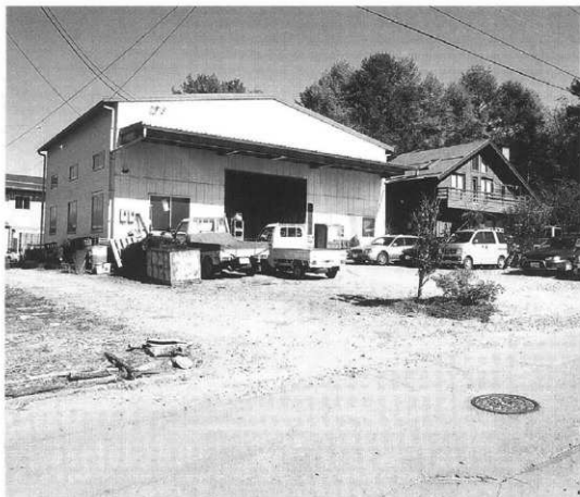
写真1 工場建設予定地

12月10日 工場建設予定地にトレンチ設定を行い、引き続き重機でトレンチの掘削、人力でトレンチ内の精査を行うが、遺構を発見するまでには至らず、片付けを行い調査は終了。