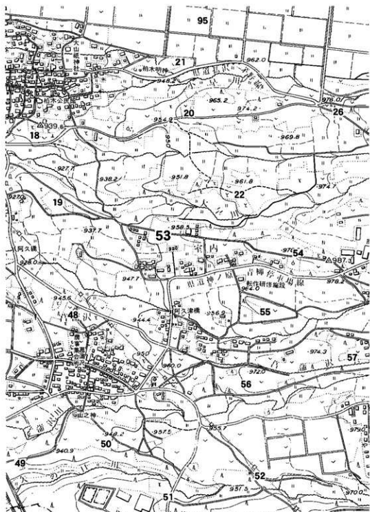
第2図 雁頭遺跡の位置と周辺遺跡 (1:10,000)