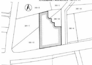
野馬窪遺跡群 1 調査全体図 (1 : 1,000)

現地表面から1.80m掘り下げて精査したが、いぜん駐車場を造成する際、浅間火山灰土(P1)まで深く掘り下げられており、遺構造物とも検出されなかった。