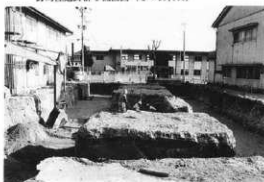
野馬窪遺跡群 1 調査地点近景 (南方から)