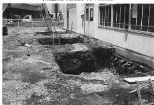
寺畑遺跡群5調査地点近景(東方から)

1994(平成6)年度の佐久市土木課による道路工事に先立って行われた発掘調査では、縄文時代草創期の爪形文土器群が検出されている。今回、上田電線電機工業株式会社佐久営業所事務所建築に伴い立会い調査を実施した。