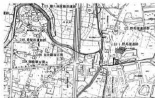
野馬窪遺跡群 1 位置図 (1 : 10,000)