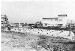
荒家遺跡1調査地点近景(南方から)