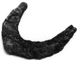
盛土中出土鉄製鉤先