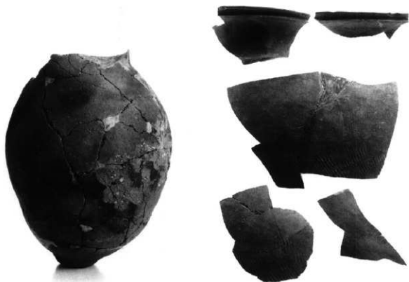
周溝内出土土師器・須恵器