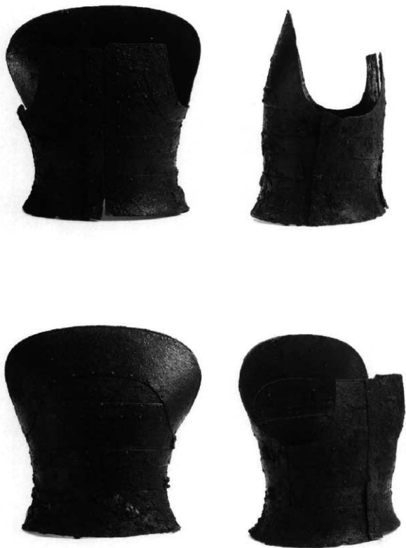
石室内出土横板短甲