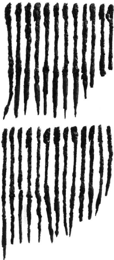
石室内出土鉄鏃（西群）