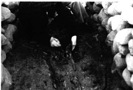
人骨取り上げ状況