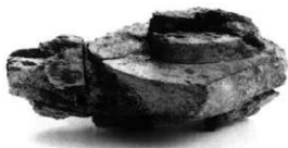
直刀 3 刀装具