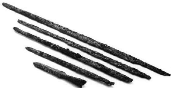
竪穴式石室内出土武器類