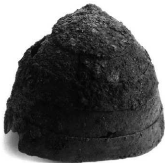
石室内出土衝角付膏