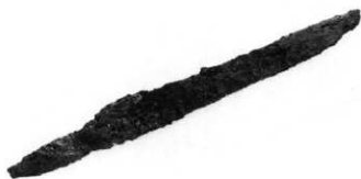
S K 83 出土短刀