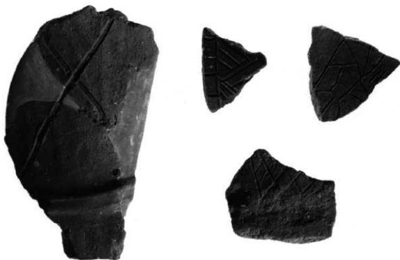
周溝内出土線刻のある埴輪