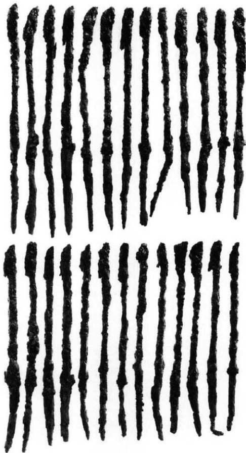
石室内出土鉄鍔（東群）