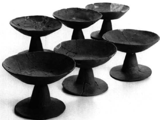
西側くびれ部出土高坏