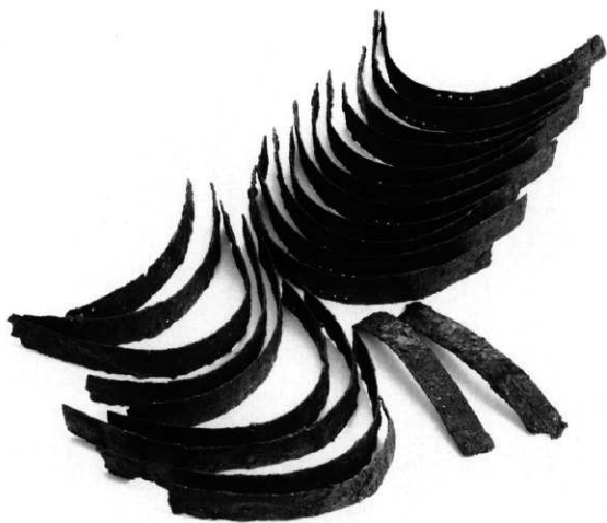
石室内出土 horn 甲