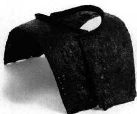
石室内出土 horn 甲