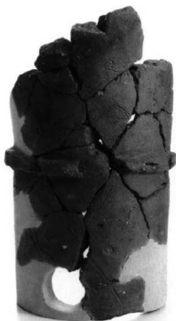
周溝内出土線刻のある埴輪