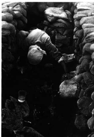
遺物取り上げ状況