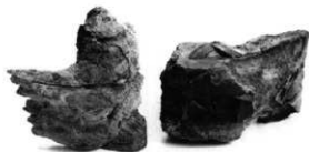
直刀 2 刀装具