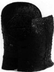
石室内出土三角板銜留短甲