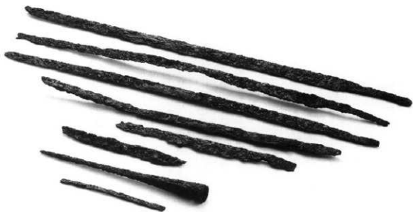
墳頂部出土武器類