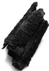
直刀 2 木製柄