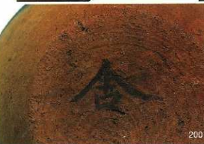
左： 墨書土器 「舍」 右：同上 「信」