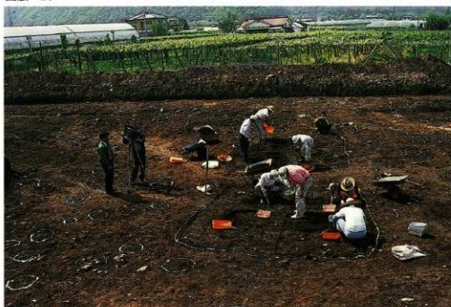
作業風景 取材（テレビ松本）