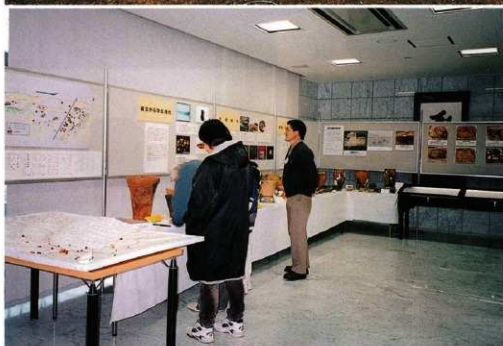
出土品特別展 （テレビ松本にて）