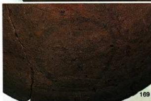
左： 墨書土器 「㊦」 右：同上 「子」