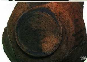
墨書土器 「三子」 右：全体 左：体部