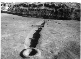
PL.82 曾木原遺跡(第3次・第5次) 1号溝(北西から)