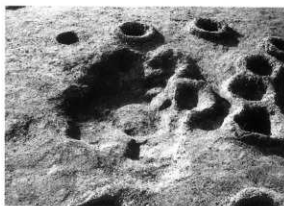
PL.80 曾木原遺跡(第3次・第5次) 1号土坑(南東から)