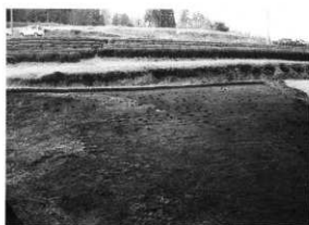
PL.78 曾木原遺跡(第3次・第5次) 柱穴群(東から)