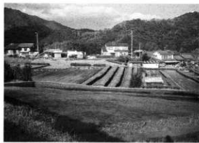
PL.77 曾木原遺跡(第3次・第5次) 近景(南から)