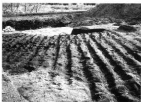
PL.79 曾木原遺跡(第3次・第5次) 畝(北東から)