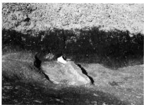
PL.81 曾木原遺跡(第3次・第5次) 2号土坑(東から)