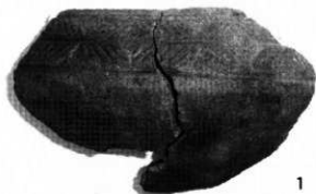
「樞原式紋様」で飾られた浅鉢