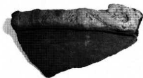
北陸地方の影響がみられる浅鉢