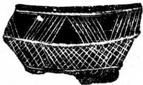
「樞原式紋様」に類似した線刻で飾られた浅鉢

特筆できる土器には、レリーフまたは線刻で飾った土器や、他の地方の影響をうけたとみられる土器があります。上の図に示した土器のうち、1、3の浅鉢は、樞原遺跡(奈良県樞原市)の出土資料で代表される、平行する沈線あるいは刻み目を施した沈線をはさんで三角形のくり込み紋を加えた「樞原式紋様」を飾っています。1は、底が丸いサラダポウル形で、外面には三角形に列り込んだ紋様に、七宝紋風の紋様を交えた紋様帯が巡ります。3は、頸部が直立し、その外面にはジグザクに施した斜線紋を、肩部の表面には斜格子紋を線刻しています。頸部の線刻で、三角形の紋様が表されており、「樞原式紋様」に類似するものと考えられています。ともに表面は丁寧に調整されています。「樞原式紋様」は縄文時代晩期では初め頃のみ