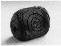
写真4 第109号竪穴住居址三角埴形土製品