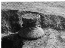
写真1 第113号竪穴住居址伏罽

縄文時代前期の竪穴住居址は、西地区で検出した第80号住居址であるが、不明瞭な点が多い。中期の竪穴住居址は東地区の尾根肩部付近から南斜面で検出した。すでに南側が流失したものが多くみられた。平面形は隅丸方形を呈し4本柱のものが多く、中期後葉の曾利期が多いようであ