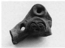
写真3 第96号住居址顔面把手