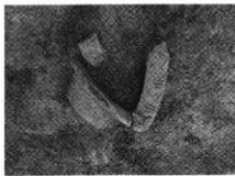
写真2 第93号竪穴住居址釣手土器