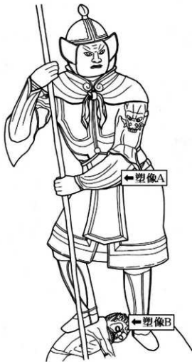
出土した塑像の部位

今まで『資財帳』の記載にとどまっていた奈良時代の塑像が、実際に発掘調査で出土したことは、大安寺の歴史を理解していく上で貴重な発見といえるでしょう。