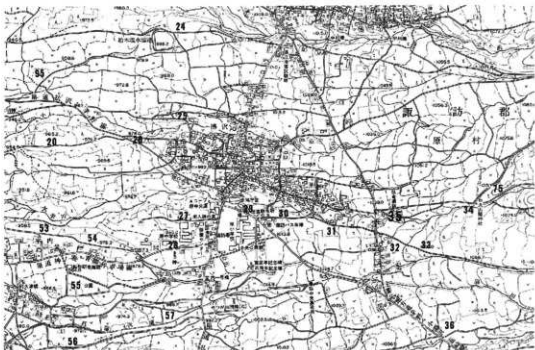
第1図 臥竜遺跡と付近の遺跡 (1/20,000)