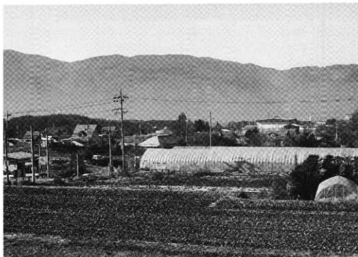
臥竜遺跡（発掘地区）遠景

平成7年9月に関係者と協議と打合せを行ない、原村教育委員会は株式会社諏訪貸家アパートセンターから緊急発掘調査の委託をうけ、平成7年12月13日から28日にわたり、臥竜遺跡第6次緊急発掘調査を実施した。