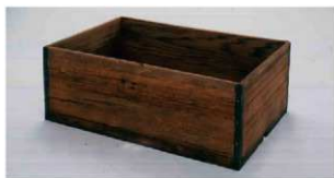
井戸枠に再利用された辛櫃