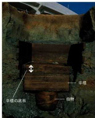
辛櫃を再利用した井戸1（南から）

文献資料によると、辛櫃の中には、紙・経巻・衣類などを納めていたことがわかります。今で言う家具にあたります。それが何らかの理由によって使用されなくなり、井戸枠として再利用したものと考えられます。物を廃棄せずリサイクルして有効に使うという、当時の生活の一端がうかがえる資料です。