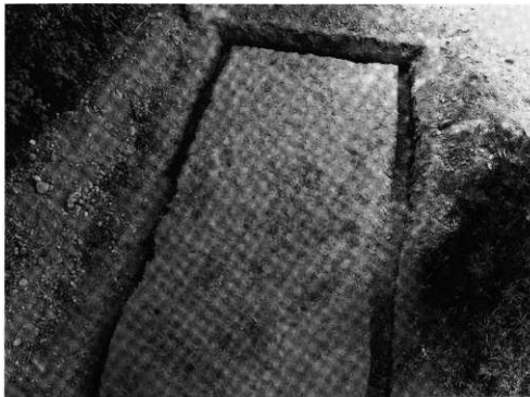
写真2 第1調査区(北方から)