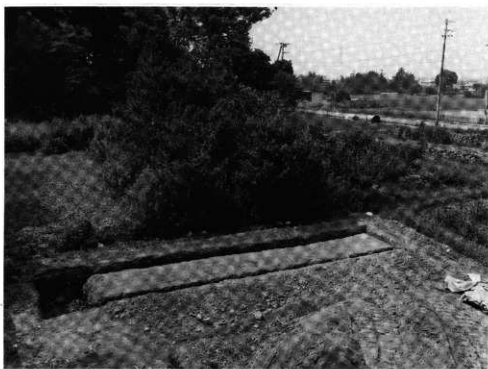
写真3 第2調査区(北方から)