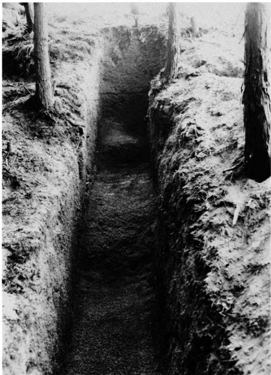
7. 墳丘北トレンチ（北から）